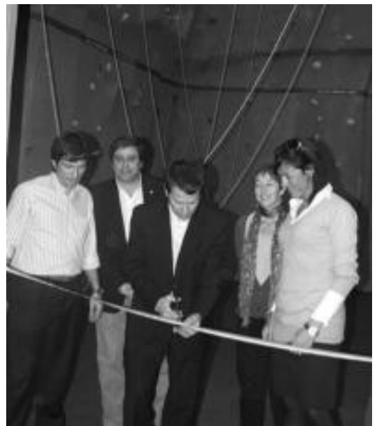
Atzo arratsaldean inauguratu zuten kiroldegi barruan dagoen rokodromoa. E. EZEIZA