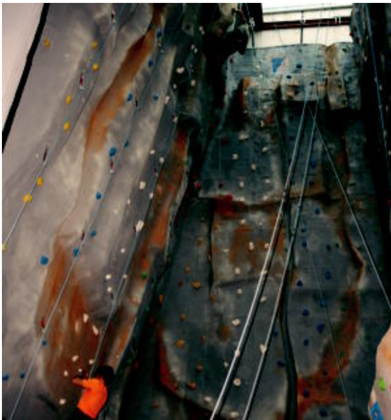
Bi eskalataile Usabalgo rokodromo berria probatzen, atzo. E. EZEIZA