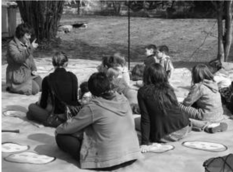
Gazttxoen saioek izan dute bereziki arrakasta Ahoz aho jaialdian.