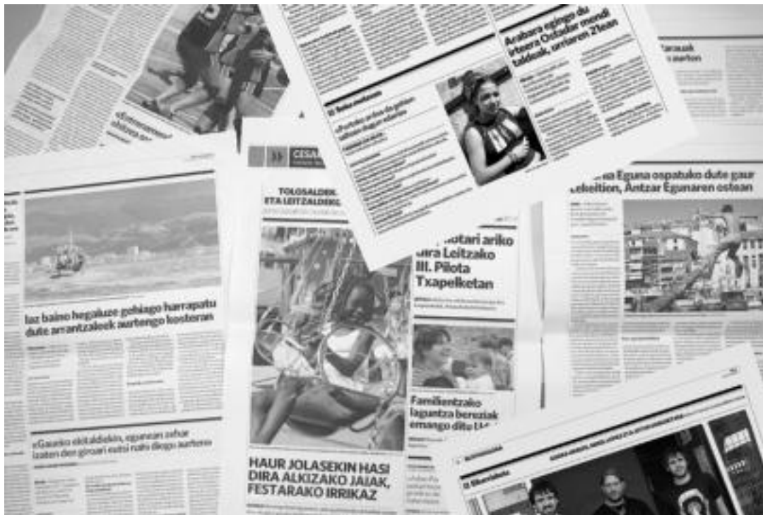
Aurten inoiz baino gehiago beharrezkoa da irakurleen fideltasuna; HITZA etxean jasotzeko 56 euro ordaindu behar dira. HITZA

harpidedun bakoitzarengandik jasotzen ditugun 20 zentimo horien garrantzia azpimarratzekoa da; zentimo horiek azken aldian gure eskualdean sortu den euskarazko herri-proiektu inportantecinari arnasa eta babesa emateko modurik egokiena baitira.