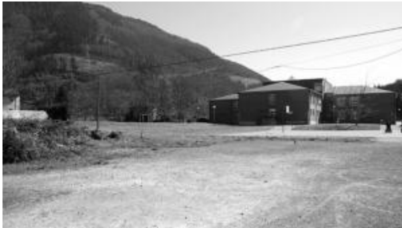
Ikastolaren ondoan kokatuko da auditorioa. I. GARCIA

Auditorioak Ikastolaren handitze aurreproiektuarekin zerikusia izango du. 2012rako Ikastola txiki