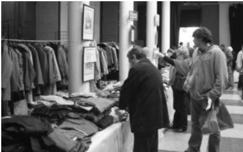
Merkatu txikian ateratakoarekin, Santa Ageda abesbatzak emandakoarekin eta Auzokideen diru laguntzarekin 5.800 euro lortu dituzte, guztia Nikaraguara bidaltzeko. INIGO TERRADILLOS