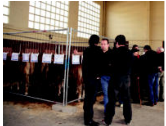
Aurreko urteetan baino biga gutxiago atera ziren enkantera atzo. E. EZEIZA

Goizean goiz eraman zituzten abeltzainek beraien bigak eta hainbat lagun hurbildu ziren ikustera. Aipatzekoa da, egun, gizonak direla arlo honekiko interesa agertzen dutenak, Ferialekuan zeudenen %95a halabaitzen.