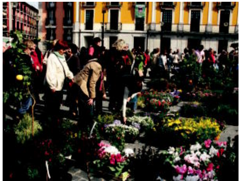
Hamahiru mintegi hartu zuten parte aurtan bigarren ospatutako Zuhaitz Egunean.