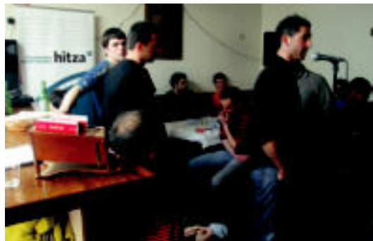
Ibarrako bertsolariak izan ziren nagusi herenegungo saioan.

Gogoratu behar da, era berean, lehen saioan Ibarrakoak eta Alegia-