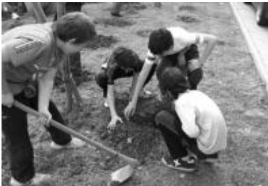
Ikastolako ikasleak gerezi-erramuak landatzen, atzo, Iturtzulon.