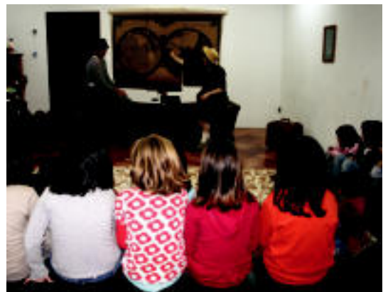
Atzokoan, Goringo taldekoen saioa izan zen ikusgai. A. IMAZ