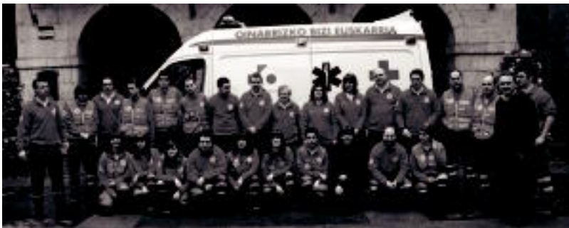
Pasa den igandean bildu ziren Tolosako Gurutze Gorriko kideak anbulantzia berriarekin argazkia egiteko. IDOIA LAHIDAGA

Programa amaitzean, udalerrri bakoitzak parte-hartzearen emaitzak emango ditu, parte hartu duten etxeek esker lortutako ingurugiro hobekuntzaren emaitzak eta familia bakoitzaren konpromiso pertsonal jakinago delarik. Horrez gain, programa bukatuko duten etxek Etxe Ekologikoaren ziurtagiria lortuko dute eta opariren zozketa batean parte hartuko dute, bizikletak, asteburuak landa-etxeetan, Karpin Abenturarako eta Madariaga Dorretxea Euskadiko Biodibertsitatearen Zentroarako sarre-rak lortu ahalko direlarik.