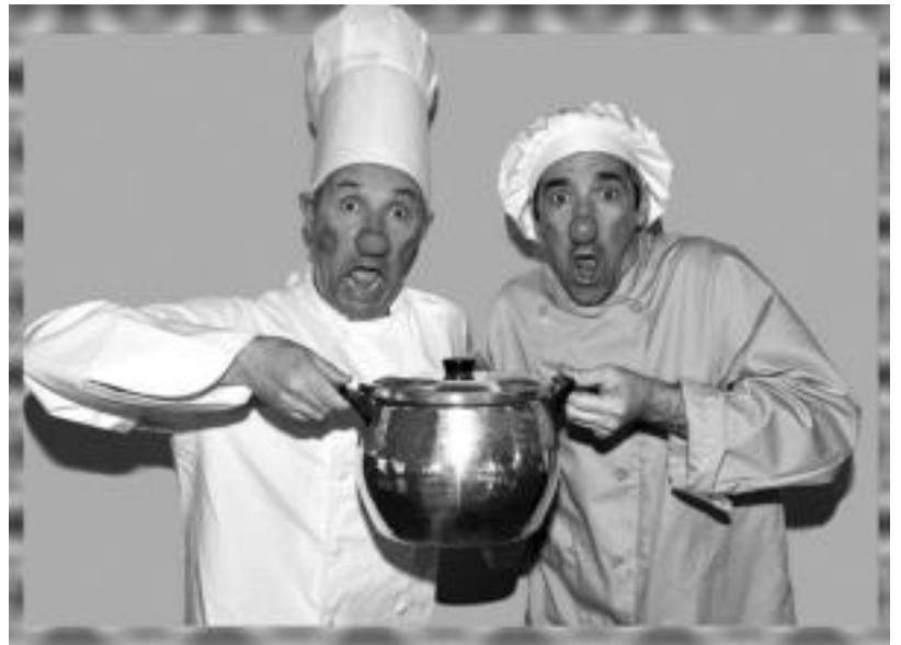
Clown estiloko antzezlanaren egingo dute Hipo eta Tomax pailazoek.

KULTURA SAILAK DIRUZ LAGUNDUTAKO HEDABIDEA