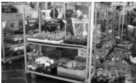
Eguraldi txarra egin zuen aurrekoan, eta bihar berriro egingo da. E. E.

Egun hau landare eta zuhaitz mota ugari ikusi eta erosteko aproposa izateaz gain, haiei buruzko zehaztasunak galdetzeko ere ego-