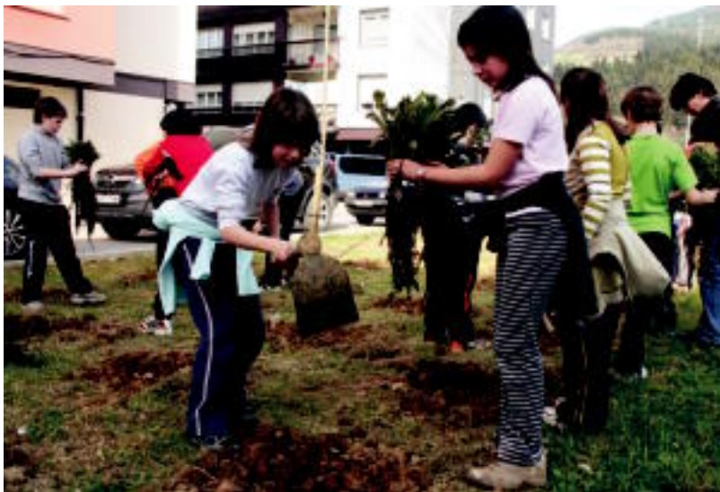
Iturtxulon 40 ikasle inguru aritu ziren landatzen. I. GARCIA

AURTENGOA laz baino parte-hartzaile gehiago daude; antolatzaileek ez dela luzea, baina gogorra dela diote 7