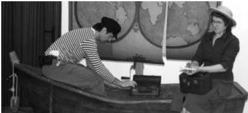
Ahoz aho jaialdiaren baitan, Sartutasortu tailerran, Gorringo taldeak haurrentzat emanaldia eskaini zuen atzo. A. IMAZ