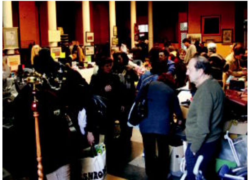
Jende ugari hurbildu zen Kultur Etxera arratsaldeko lehen orduan. I. TERRADILLOS

Emakume hauek guztiak independentzia behar dute euren bizitza garatzeko eta urteetako gizo-