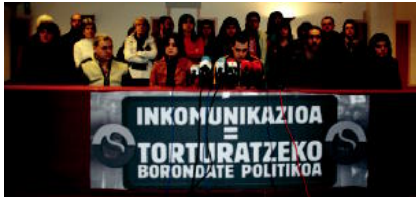
Donostian atzo egin zuten prentsurrekoaren une bat.

@ Testigantza. Manex Castroren testigantza guztia: www.tolosaldeko-hitza.info