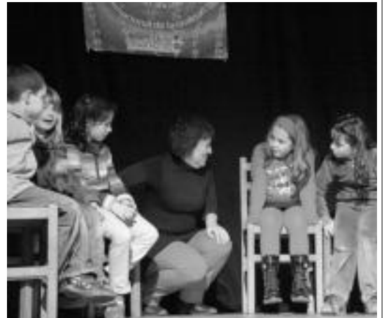
Itziar Rekalderen saioaz gozatu zuten atzo San Estebanera joan zirenek. E. E.

Asvinenea elkarteak kideen hitzetan «ahozkotanaren dream team-a» egongo da bertan. Ekitaldiko sarrearak kutxanetan daude salgai.