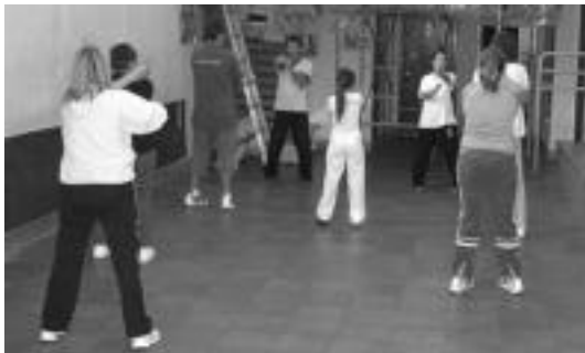
Larrialdi egoeretan, nola defendatu ikasteko aukera ematen du, I. GARCIA

Gizartea » Berdintasun sailak antolatuta du, eta hilaren 14an izango da Usabalen; izen-ematea oraindik zabalik dago.