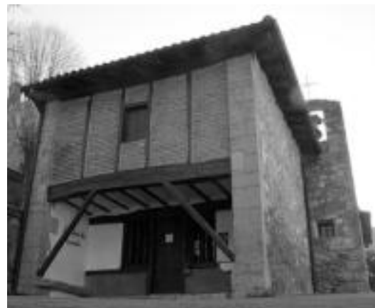
Belauntzako San Jose baselizan ere santuaren irudia lapurtu dute. R. CALVO

Ertzaintza lapurreta ikertzen ari da oraindik.