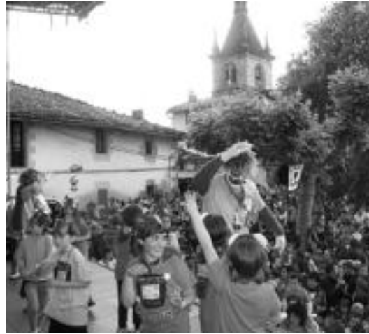
Iaz Eskola Txikien Festa Zerainen izan zen. JON MUÑOZA/GOIERRIKO HITZA

Oraindik goiz samar bada ere «gauza asko lotu» beharrean daude eta ondorioz, otsailean ere herri bilera bat egin zuten Berrobin eskolako guraso zein irakasleez gain bizilagunei ere laguntza eskatzeko. «Herri txikia gara, eskola txikia, baina festa handia egin behar dugu eta herri guztiaren parte-hartzea behar dugu horretarako. Oso garrantzitsua da herri txikien tzentz eskolak mantentzea eta horregatik urtero herri txiki batean ospatzen da festa. Datorren urtean Altzon izango da», argitu du Agirretxek. Izan ere, Eskola Txikien Festako kantuak dioen moduan Eskola txikiak, herri ta auzo, geroaren bila pausorikan pauso .