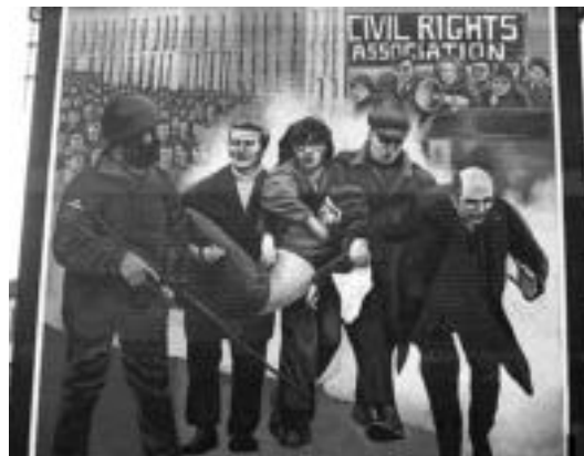
Irlandako Derry herrian 'Igande Odoltsu'aren omenez AUTOESKOLA ANTIKAPITALISTA

Ibarako taldeak Irlandaren inguruan bi hitz egingo dituzte filma hasi aurretik, «azken gertaerak azalpenak hori merezi dute, komunikabideek zabaldu dutenak zeresana sortu du eta hitzaldi bat baina gehiago horren inguruko tertulia egingo dugu ikuskizunaren aurretik. Horregatik, barnean antikapitalismoa sentitzen duten guztiak gonbidatzen ditugu Gaztetxera».