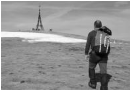
Gorbeia mendia igoko dute igandean Alpinoko mendizaleek. HITZA

Tolosa » Iganderako antolatu dute irteera; izen-ematea dagoeneko zabaldu dute telefonoz, internetez edo elkartearen.