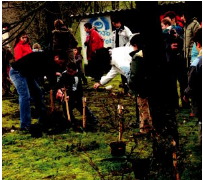
Umeek 32 zuhaitz berri landatu zituzten; ondoren, hamaiketako egin zuten. IDOIA LAHIDALGA

Bestalde, «egun hau naturarizor diogun errespetua eta maitasuna sustatzeko balio izatea nahi genuen», izan ere, «tamalez egunetik egunera natura kolpatuago dago