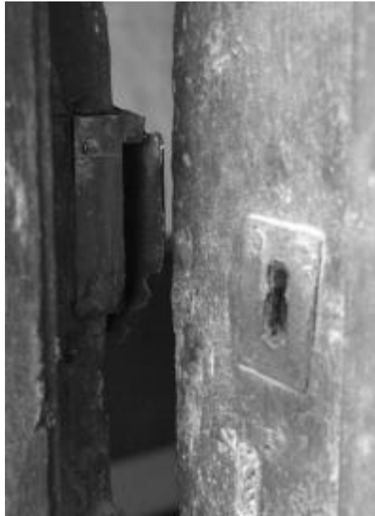
Berrobiko San Sebastian basilizan ateko sarraila hautsita sartu ziren santua lapurtzeko; eraikina 1551. urtekoa da. R. CALVO