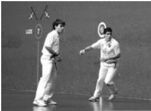
Sukia Aurrera-Saiazkoa eta Markinako pilotaria, Euskadiko Txapelketan. N.U.