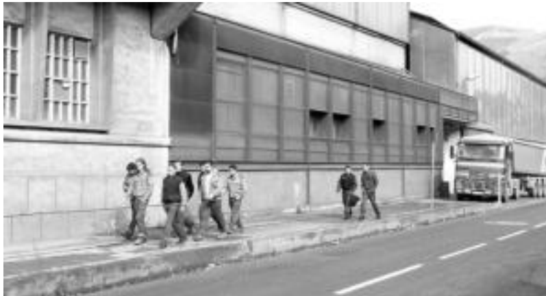
Langileak, atzo goizean, CAF enpresaren atarian.

Osalar erakundeko teknikariak heriotza ikertzen ari dira CAFen.