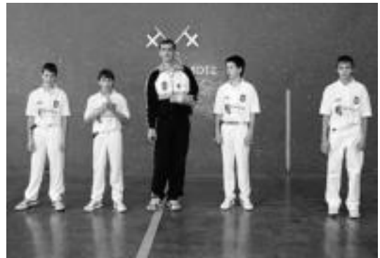
Nafar Jokoan inguruan haur ugari mugitzen da asteburero. HITZA

Sarreraren edota afariarako erreserbak egiteko: 948143747 telefono zenbakira deitu beharko da, edota ondorengo helbide elektronikora idatzi: nafarroakotxapelketa@bertsozale.com .