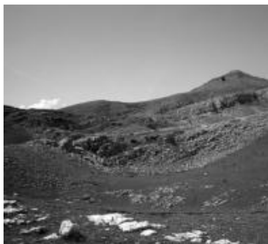
Enirio-Aralar eta Larrondoko larreak maiatzaren 1ean irekiko dituzte. LIZARRUSTI

18 urtetik beherakoek gurasoen baimena beharko dute joateko. Bestalde, izena emateko garaian, zehaztu egin beharko da zein ordutan itzuli nahi den etxera.