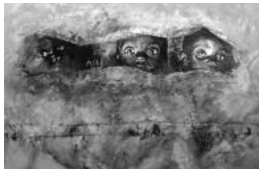
Mota eta estilo guztietako artelaren bitartez isladatzen dute errealitatea. E. E.

Orain 25 urte azaldu ziren GIB/hieseko lehen kasuak. Orain berriz, gaixotasuna mundu mailako epidemia bihurtu da. Egunero, 6.800 pertsona baino gehiagok hartzen dute infekzioa eta 5.700 baino gehiago hiltzen dira gaixotasunagatik. Heriotza eta infekzio berri horien gehiengo handia Hegoaldeko herrialdeetan gertatzen dira, aipatutako lurraldeen garapenean eragin negatiboa duelarik.