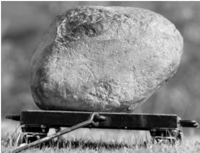
Harri-jasotzaileak Etxauriko harria altxatzen saiatuko dira.