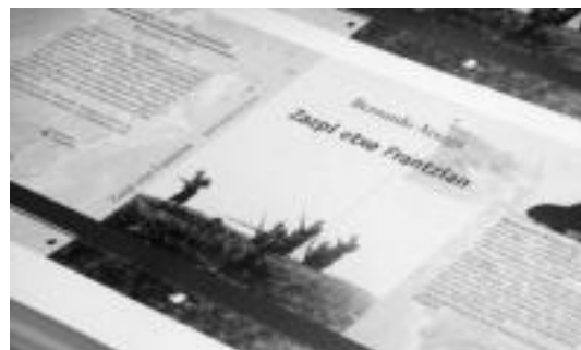
Liburuaren irudia inprimategitik liburu-dendetara atera aurretik. PAMIELA

Aipatu behar da, era berean, Zazpi etxe Frantzian aldi berean euskaraz, galizieraz, katalanez eta gaztelaniaz argitaratu dutela, nahiz eta aurki portugesea ere itzuliko duten. Etorkizunean beste hizkuntzetara itzultzea ere ez dute bazterzen.