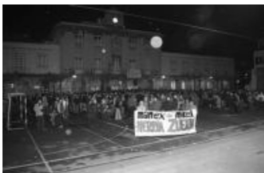
Eskualdeko manifestazioan herritar ugari parte hartu zuten. I. GARCIA

zioa. Beraien ustetan, inkomunikazioak tortura ahalbildetzen baitu. Bestalde, EAJ alderdiaren jarriera ere kritikatu zuten «Ertzaintzak bete beharreko protokoloa hainbatetan goratu duena, beste poliziek in desberdinak zirela saldu nahirik, bertan behera utzi duenean 3 urteren ondoren, Manex eta Mikel torturatuak izateko arriskuan jarri» gaineratu zuten.