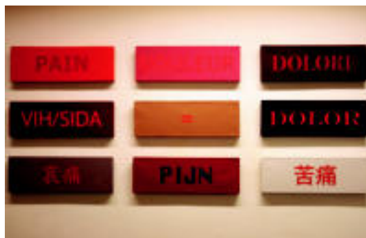
Mota desberdinetako artelaneak isladatzen dute errealitatea. E. EZEIZA

TOLOSALDEA Euren esanetan, «maileguak emateko baldintza berdinak ditugu orain» 2-3