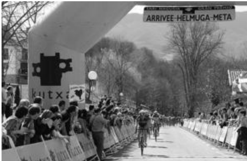
Aiztondo Klasikoa bailarako herrietatik zehar igarotzen da. NEREA LIZARTZA

Antolatzaileek azaldu dutenez, igoera horretan erabakiko da ziu-