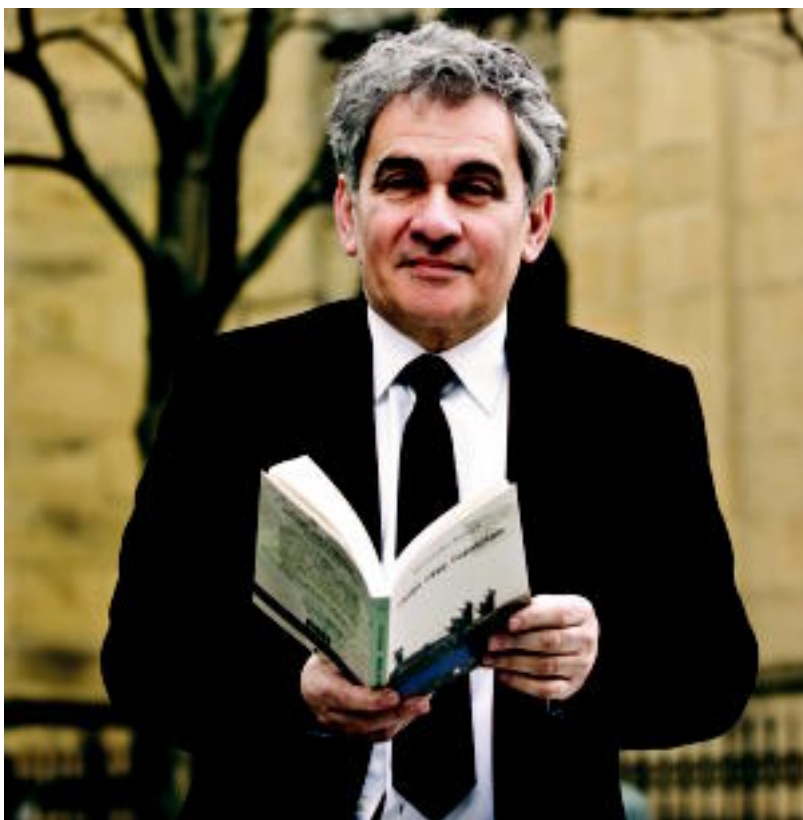
Atzo aurkeztu zuen bere liburua; Euskaraz, galizieraz, katalanez eta gaztelaniaz kaleratu dute aldi berean.