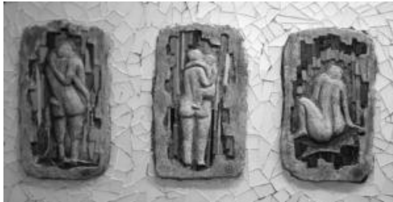
Zortzi artisten lanak bildu dituzte Aranburu jauregian. E. EZEIZA

Ekintza horiek, hurrengo hilabetetan Gipuzkoako beste herriak bisitatuko dituztenak, posibleak dira GIB/hiesaren gaiaren inguruko pertsona desberdinen, artisten, zinelarien eta adituen konpromisoari esker, epidemiak mundu mailan planteatzen dituen erron-