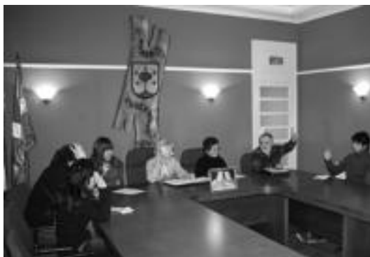
Ezker abertzaleak aurkeztutako mozioa irakurtzen, atzo, udaletxean. I.G.

Idatzirekin, Udalbatzak gogor salatu nahi izan du inkomunika-