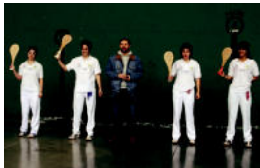
Hoberenako pilotari nafarrak, atzo Emakumea Pilotari Irekian. AIMAZ

ZIZURKIL Maiatzaren 31n izango da, Azpeitiko zezen-plazan; bakoitzak 3.000 euro jarri ditu 6