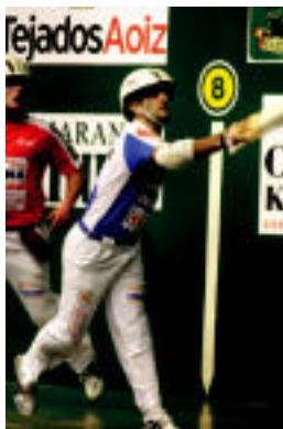
Zeberio II.a joaneko finalean.

Saldiaokoak joanekoa irabazi zuen, askoren harridurarako. Izan