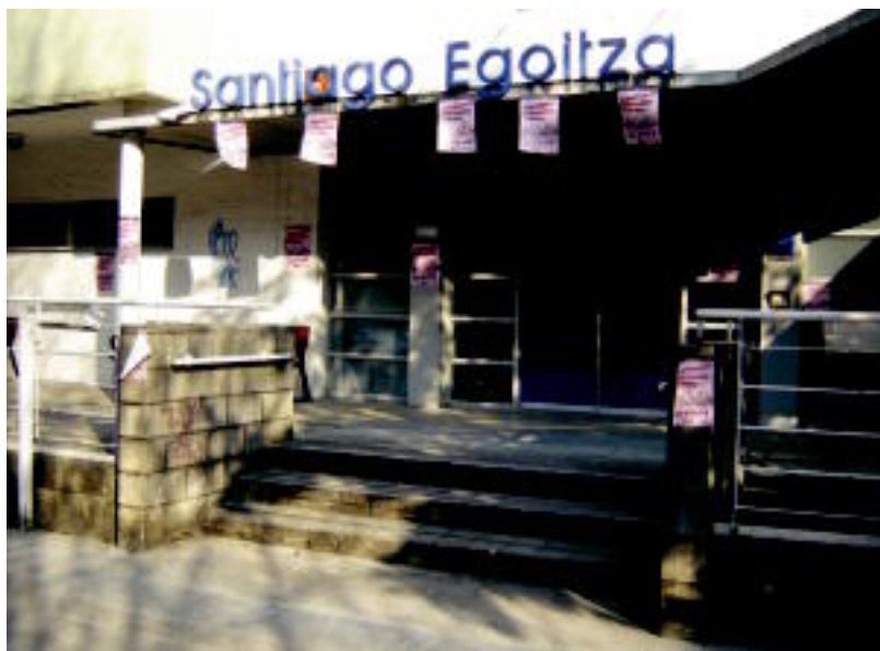
Santiago egoitzako langileek gaur ere egingo dute lanuztea, 10:00etatik 13:00etara. M.G.