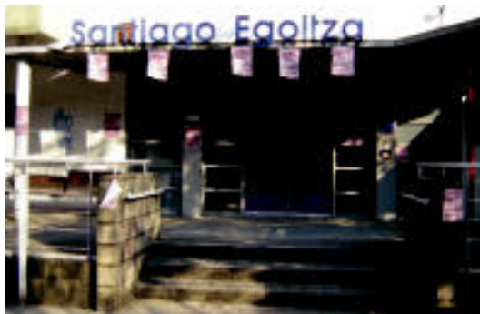
Villabonako Santiago zahar egoitzaren irudia. M. GALARRAGA

Villabona » Egoitzaren kudeaketaz arduratzen den Catalunya2 enpresako langileek hiru orduko lanuztea egingo dute gaur.