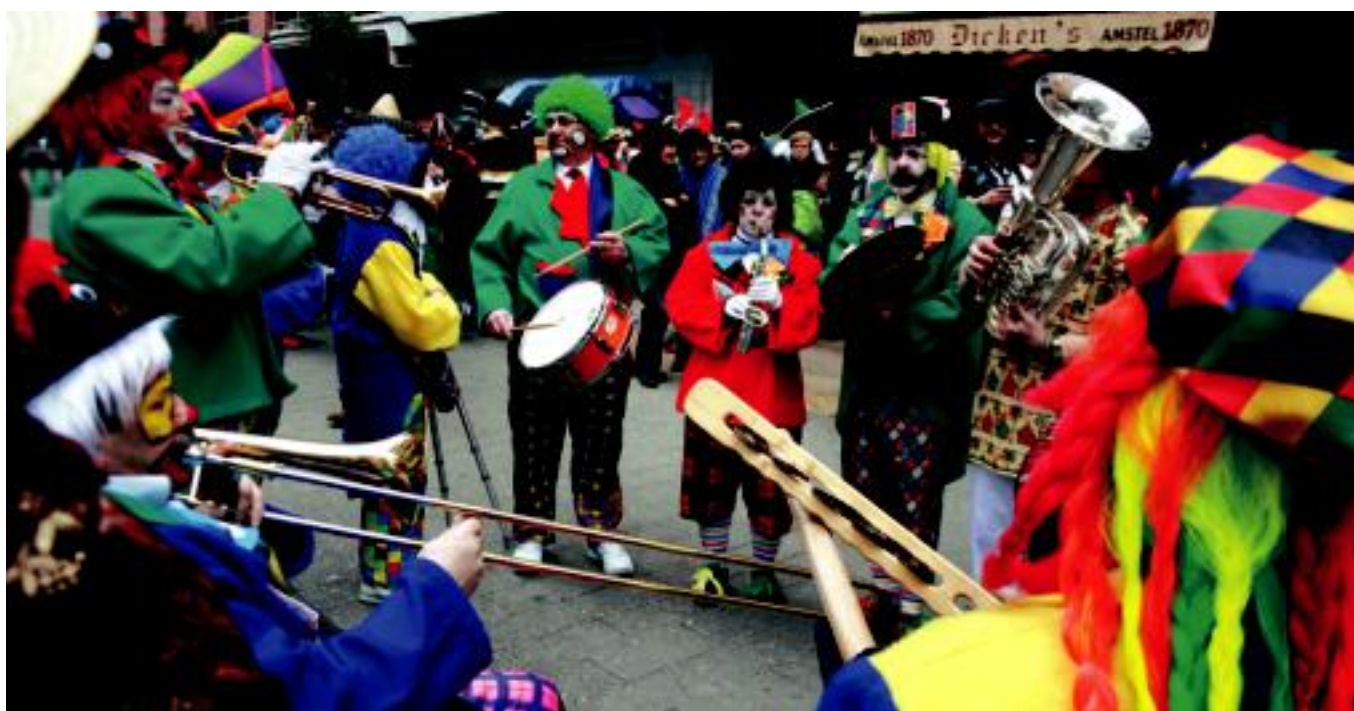
Benetakoak ala gezurretazkoak, txarangak dira Inauterietako protagonista nagusiak.

GAUR Ajearen eguna atsedenerako baliatzekoa izan ohi da; HITZAren kasuan ere, bihar ez baita kalean izango 3-6