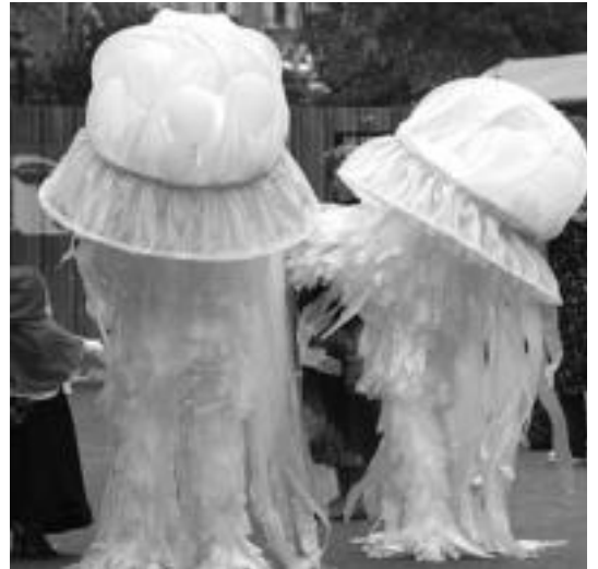
Tartean mozorro berritzaileak ere agertzen dira. I.T.