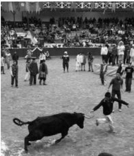
Izkingile batzuk ere aritu ziren zezenen adarretan eraztunak sartzen. I. GARCIA