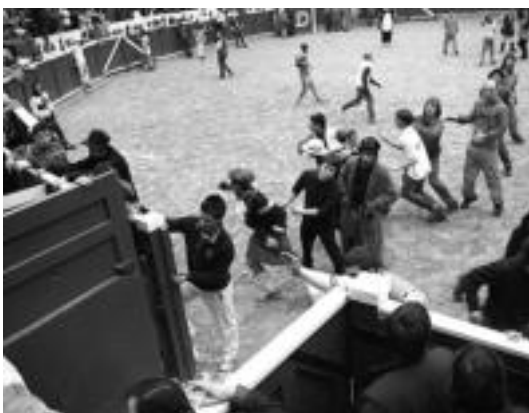
Zezena noiz atera zain. I. GARCIA