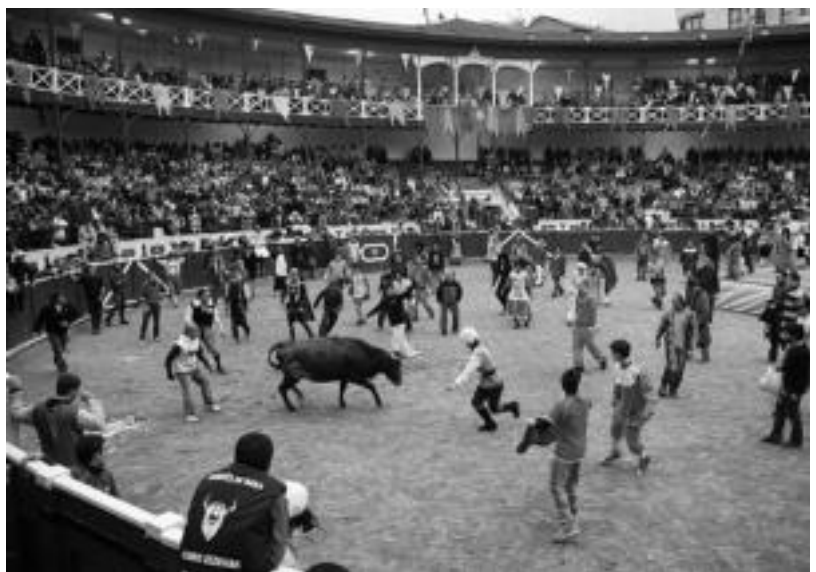
Gaszte ugari izan ziren bigantxen aurrean. I. GARCIA