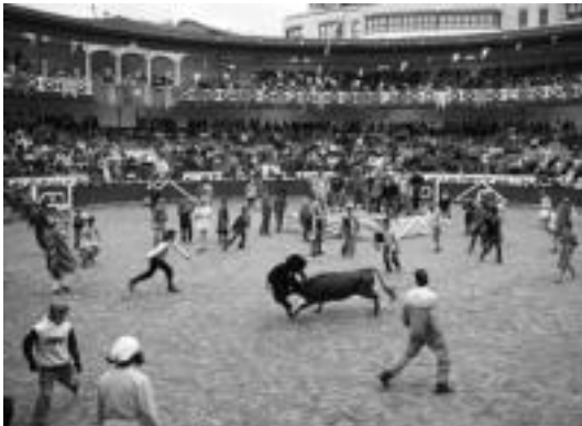
Zezenzale ugari harrapatu zituzten plazara ateratako lau hankakoek. I. GARCIA