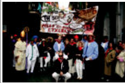
Mozorro batzuk joku handia ematen dute, waterpoloz jantzita esaterako; Lizardi elkartekoak ere hor bilt ziren.