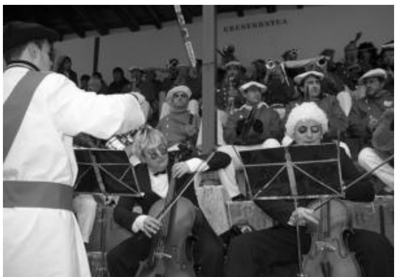
Txarangek gogotik girotzen dute Pattar Zezena. I. GARCIA