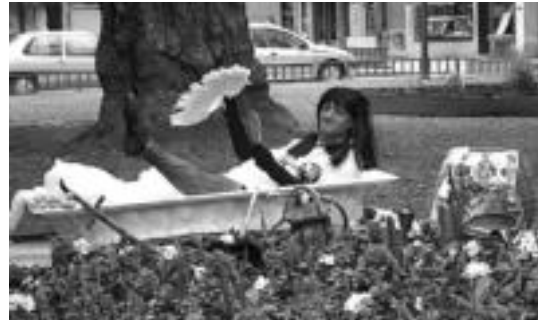
Cleopatrak ere askotan bisitatu izan ditu Tolosako Inauteriak. I.T.