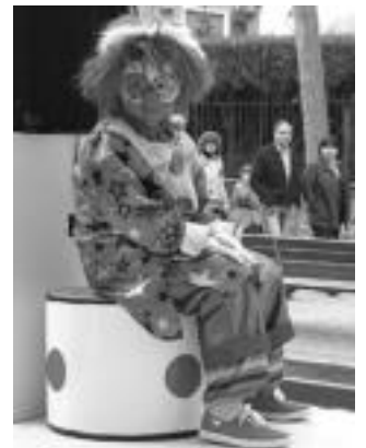
Urtetik urtera arrakasta gehien izaten duen mozorroetako bat izaten da pailazoarena. Gazte nahiz heldu, pailazo ugari ikusi dira aurten ere. I. TERRADILLOS / N. LATABURU