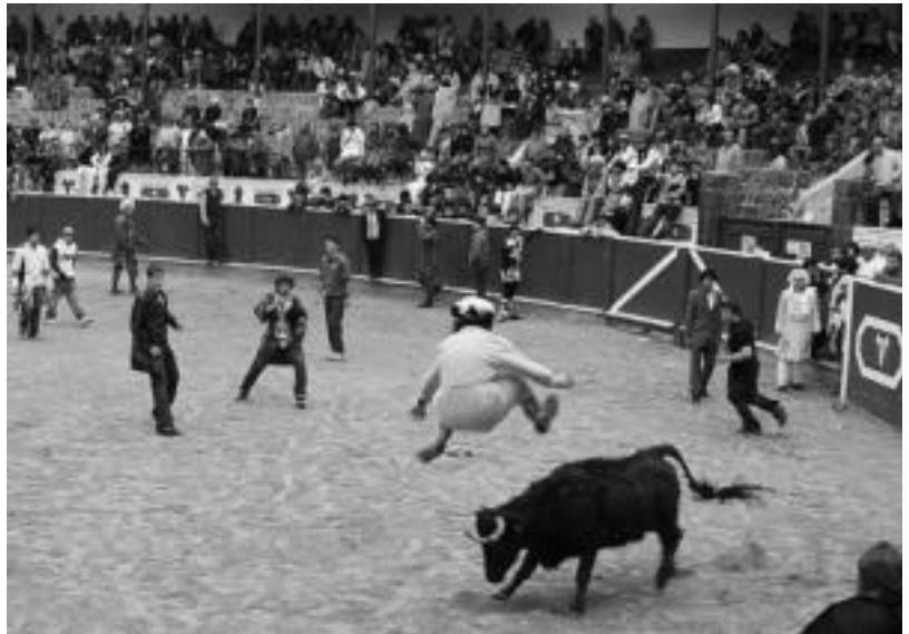
Zezenzale batzuk zezenaren gainetik salto egiten aritu ziren. I. GARCIA