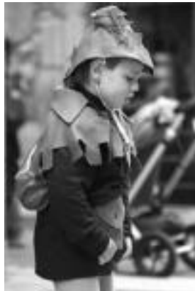
Tzanogorritxo, indioz, mexikarrez, Charlot edota Robin Hood- ez asko ikusi ditugu mozorrotuta. I.T.