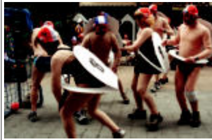
Askok hotza pasatu behar izaten dute, Gurutze Gorrikoen kasua horrela izan zen.