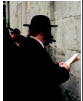
Judutarak San Frantzisko elizan erresatzen aritu ziren...