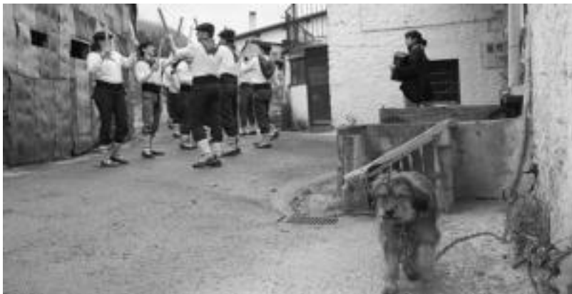
San Martinen gosaldi ondoren, Dantzarinea baserri aldera joan ohi dira. N. URBIZU

Bukatu ondoren, 14:30ak aldera, hain zuzen, basoan barrena berriz herrira bueltatu ziren, datorren urtean berriz ariko direlakoan.