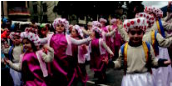
Kirikiñoko gazte eta helduak, 300 bat inguru, Mario Bros pertsonaia aukeratu dute artengo koreografa egileko. 1. TERRAOLLOS

Inauteriak Aisialdi taldeen txanda izan ezin atzo; Atsedena, Txiribitu, Ttentek, San Bernardo, Kazkabarra eta Kirikiñoko gazteek ederki alaitu zituzten herriko kaleak.