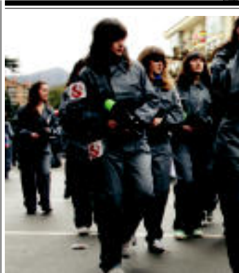
Atsedenaok Cazafantasmak aukeratu dute. 4. CAUVO