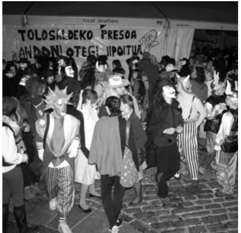
Txosnagunean jende ugari elkartu zen herenegun jaiak eta aldarriekin bat eginaz. A. IMAZ