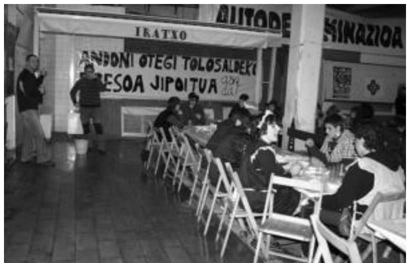
Amnistiaren Aldeko Mugimenduak antolatzen duen presoan aldeko sagardotegiak 10 urte bete ditu aurtengoa. A. IMAZ