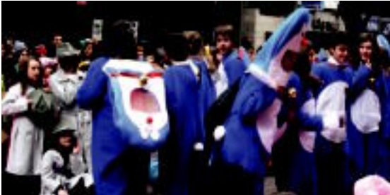
Kazkabarra aisialdi taldekoak marrakizki bizidunak atara ziren; Pantera Arrosa, Doramen, Gatchet inspektorea, Son Goku eta Vicky bikingoa, zehazki. 2. CAUVO

Guztira 1.000 gazte eta heldu inguru ibili ziren dantzatzen kaleetan zehar. Baskalku eta goz, bari bai, zezen-plazara joan ziren gaztiak pilak kargatu eta arratsaldian bertze ere dantzatzen zeraitezko.