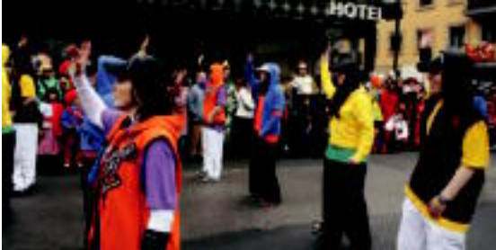
Atsedenaok kirikiñoko tribuak aukeratu dituzte; raperoak, gotikoak, heavyk... 3. CAUVO