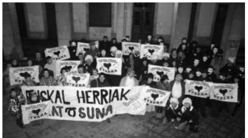
«Eskualdeko iheslari eta preso politikoen argazkia» atera zuten hainbat koadrilek herenegun.