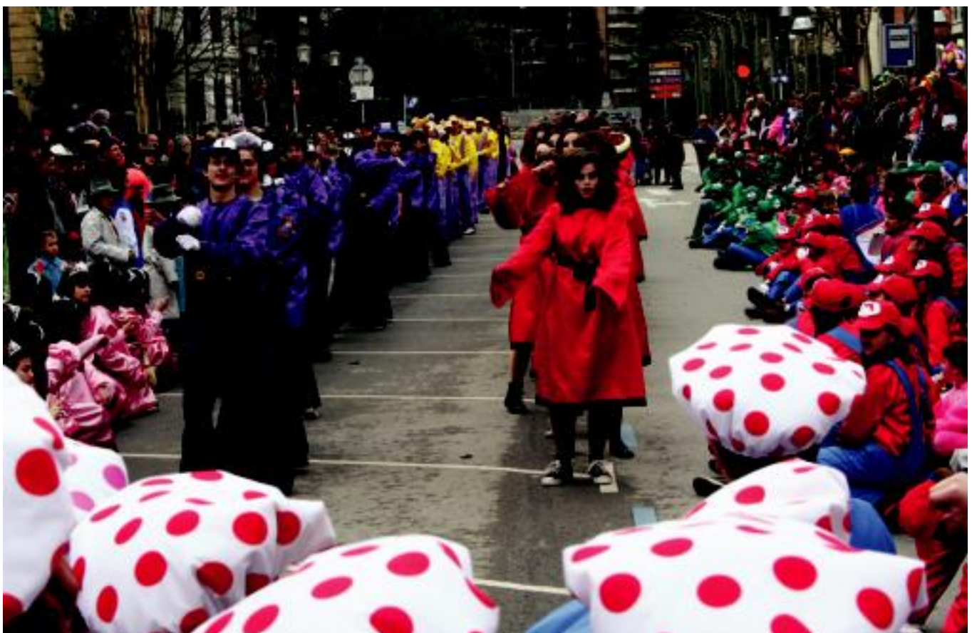
1.000 gazte inguru irten ziren atzokoan kalera dantzazera. Irudian, Kirikiño aisialdi taldekoak Mario Bros mozorroarekin. I. TERRADILLOS

GAUR Inauterien azken eguna izango da; pattar zezena, xexen-festa, 'Sardinaren hileta', karrozak, konpartsak... 2-5