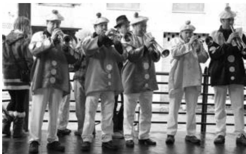
Tolosano txarango tronpetak sokamuturra alaitzen Plaza Berriko kioskotik. I. GARCIA