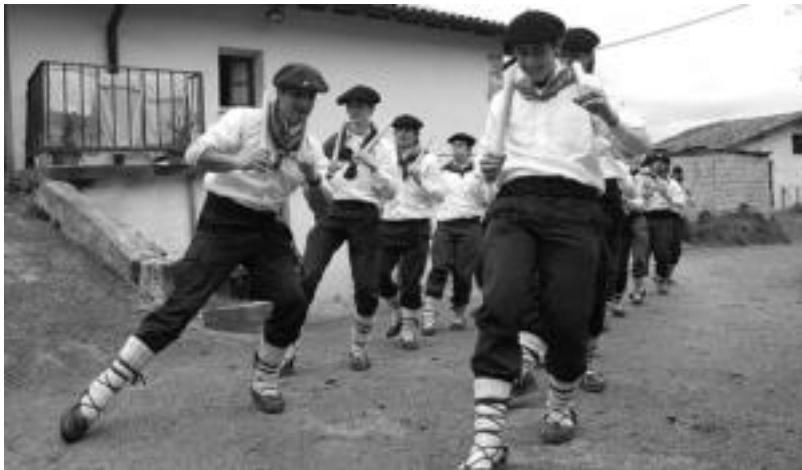
Gero eta gehiago dantzatu, gero eta aldaera gehiago egiten dituzte batzuk, esaterako, hanka gehiago luzatu. N.U.