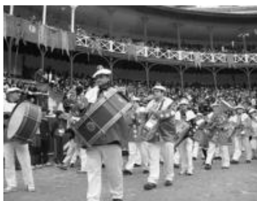
Zezen-plazarako kalejira eguneko alaienetakoa izaten da. I. GARCIA