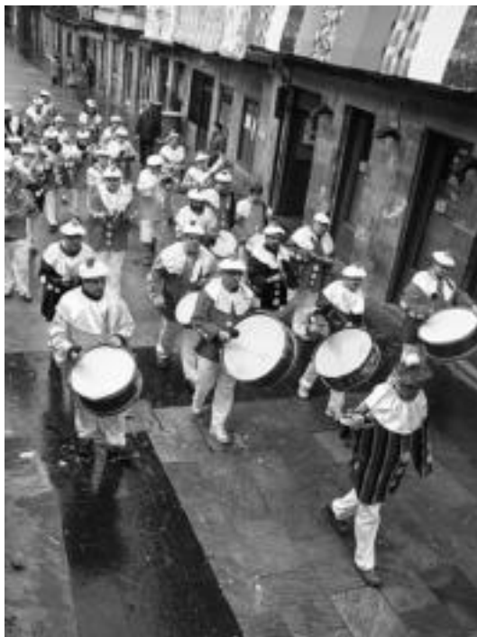
Tolosanoko kideak kalejira Alde Zaharretik. I. GARCIA