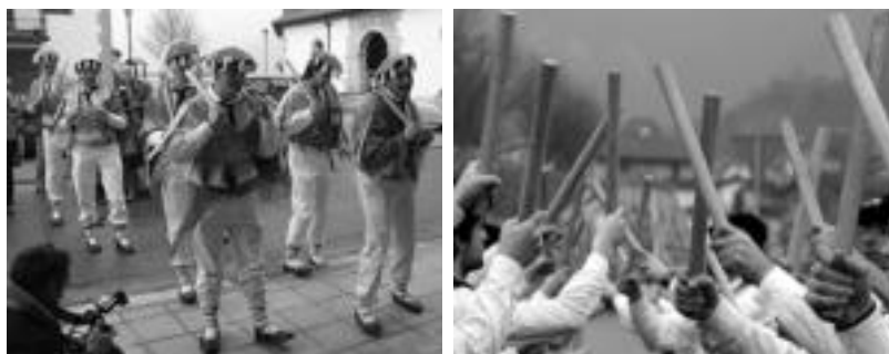
Ikusmina handia zen Abaltzisketan, gutxienez lau argazkilari baitzeuden. Eskuinean, Amezetako makilik airean. N.U.