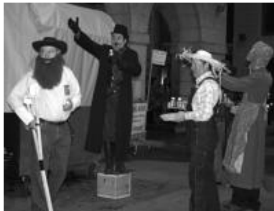
Min guztiak kentzen zituen elixir magikoa banatu zuten batzuek. E. EZEIZA