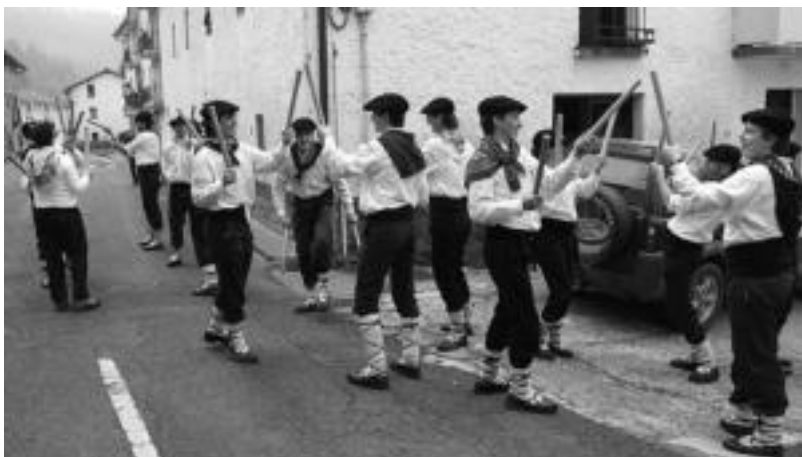
Hamaiketakoa egitera ere dantzan sartu ziren amezketarrak, aurretiko zegoena oztopoa izan gabe. N. URBIZU