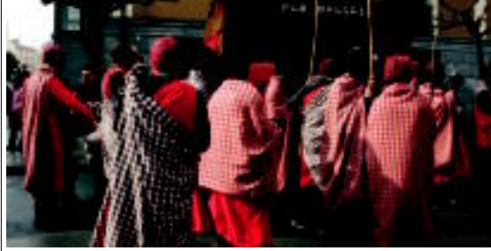
Rociotik Tolosaraino etorri ziren batzuk astoz. Masabi tribuko parrandazaleek euren pub-a zabaldu zuten. Mila eta bat gau dantzan pasatako arabiarrek atsedean hartzeko ere ez zuten denborarik eduki. Iraultzaren Abeldura Txikiro Trenak geldialdia egin zuten. Eta hau dena Tolosaiko Inauterietan. ESTRELLA A. MAIZ

Karrozak eta konpartsak Inoiz baino talde gehiago ateratzen dira aurten kaleera Zalduntzan, gaur aisialdi taldeen txanda izango da.