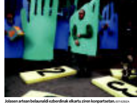
Jakoen artean belaraldi ezberdinak elkaru ziren konpartsetan. ESTRELLA