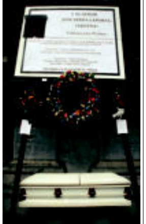
Jaka eta heriotza lotuz elkarren kanpoan. Urtero bezala San Frantziskoren burutako izugarriak Rosi ziren. COMPAZ