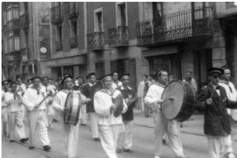
Lan handia egiten du Aiz Orratz Veleta elkarteak Inauterietan; aurten ere Jostuntxoaren Batailoia aterako dute. HITZA

Eva Nasarrerren dantzariak, Ulahop dantza, Bonbero torero, Manolak, Gurrutxagaren potolak, Turistak, Aragoiko jotak, Zapatariak, Rabino judutarrak, San Fermin, Urte Berriko kontzertua, Madrid castizo, Cadizeko txirigotak, Galegoak, Haur danborrada, Mary