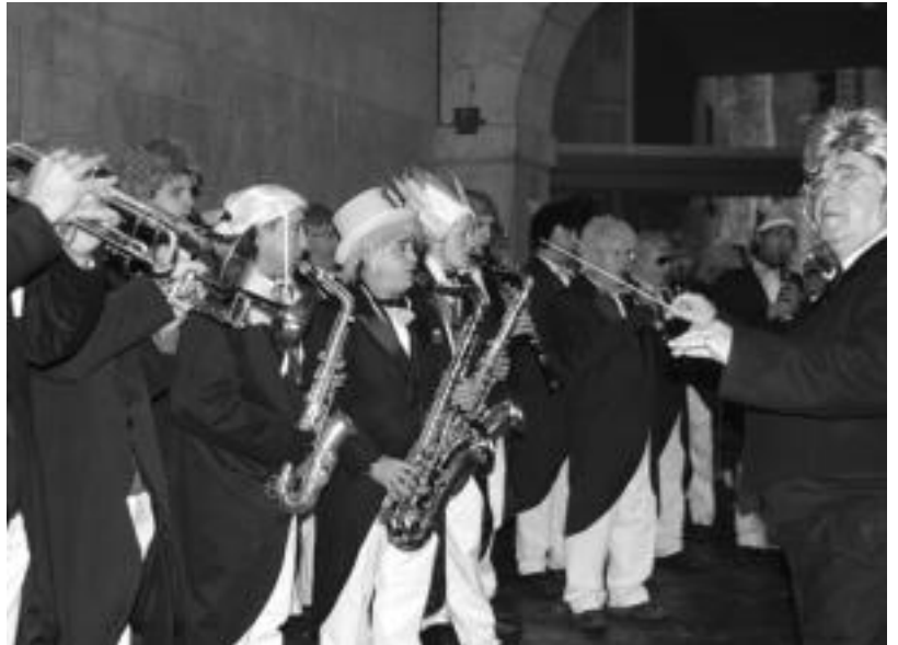
Behin eta berriro astindu zituzten instrumentuak Tolosako Udal Musika Bandakoek, jendea ohetik altxatzeko. E. EZEIZA

Esnatzen laguntzeko elixir magikoa zutenak ere baziren. Min guztiak sendatzeko eta aje guztiak kentzeko balio omen du edari horrek, eta jende artean banatu zuten Inauteri hauetan zorte ona izateko denek.