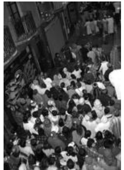
Jende ilara luzeak osatu ziren, Alde Zaharrean. E. EZEIZA