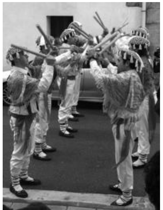
Mezaren ondoren egin zuten txantxoek herriguneko lehen saioa. N.U.