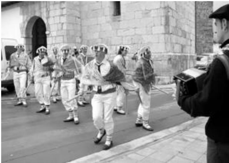
Abaltzisketako txantxoak, dantzatzen. Aurten ez dute plazan makilik hautsi, baina ez da izan saiatu ez direlako... N.U.