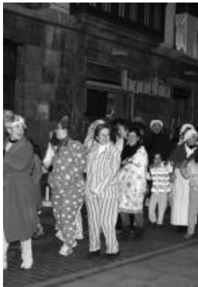
Gero eta jende gehiago hurbiltzen da Dianara. E. EZEIZA