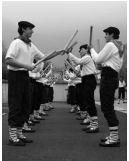
Talai dantzariak Amezetan: talde handia elkartu zen atzo. N.U.