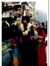
Ere ereginak panela frontoiaren gainean jarri zuten, ikusgarria. Teroeak bertiz, bi belarri irabazi ostean, besotetan zeharkatu zuten herris. ESTRELLA