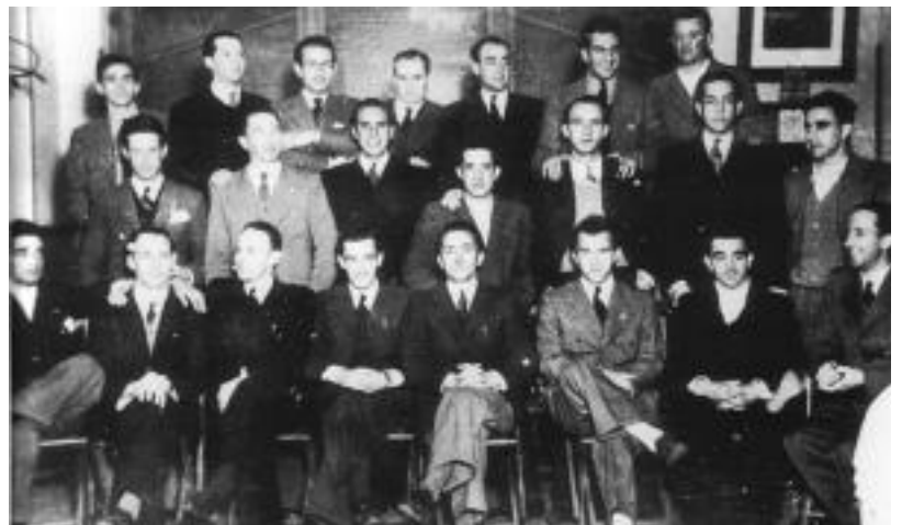
Tolosako Inauterietan indar berezia izan du betidanik Kabi Alai elkarteak. HITZA

egiten 23 urte daramatzate Kabi Alai kide batzuk. Sanjoanetan berri, azken hamasei bat urteetan eskopetari konpainia ateratzen du elkarteak. Herrian izaten diren hainbat azoka berezitan ere bere laguntza ematen du maiz. Eta santagedatan abesbatza bat osatzen dute Urdiña Txiki eta Gure Kaiola 'bizilagunekin'.