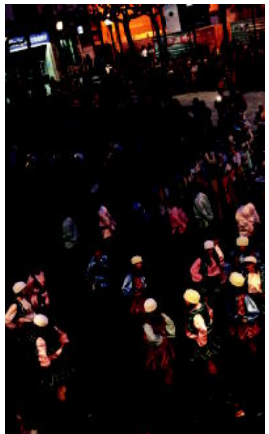
Lehenbizi Haur Danborrada atera zen Santa Maria kaletik; ondoren, 19:00etan, helduen txanda izan zen; egurdiala lagun izan zen eta jende ugari atera zen kalera. R. CALVO / E. EZEIZA