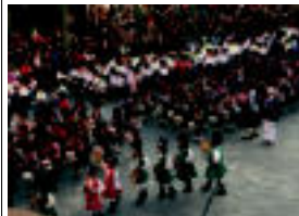
Herriko ikastetxetako 500 bat ume bildu zen danborradan. e. kutxa