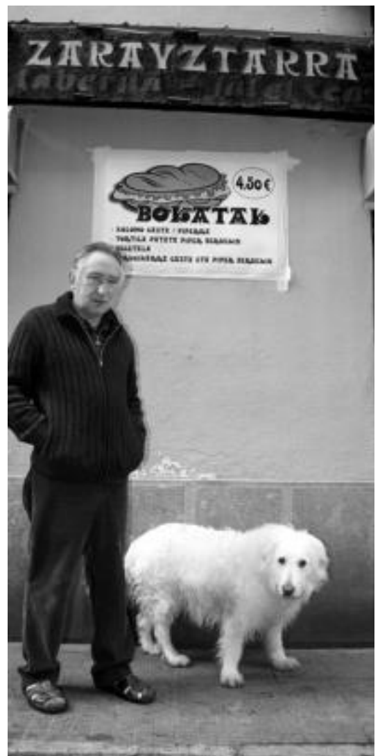
Zarauzitarra Taberna-Jatetxeko nagusia lantokiaren aurrean. A. IMAZ

Inauterien ostean hainbat taberna itxi edo nagusiz aldatuko direla zabaldu da Tolosan; zurrumurrurik honen inguruan gauzak argi utzi nahi izan ditu Aitziberrek. «Hori ez da horrela. Ahoz aho zabaldu den kontu bat da baina ez da