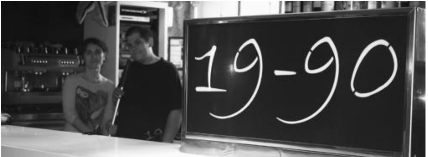
Gaean berandu itxi eta goizean goiz garbiketa lanetara. Hau da tabernarien patua Inauterietan, baita 19-90 Tabernako langileena ere. A. IMAZ

Inauterien txanponak bi alde ditu gutxienez. Bat, jakina da: jai. Bestea, berriz, ongi ezagutzen dute Tolosako tabernariak. Inoiz galdetu al diozu zure buruari Inauteriak nola bizi dituzte herriko tabernariak?