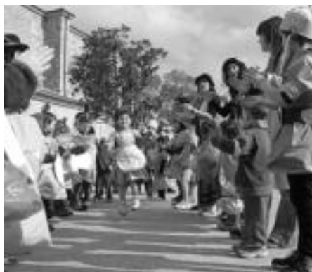
Alkizan hamaiketakoaren ondoren jolasak egin zituzten. N. URBIZU