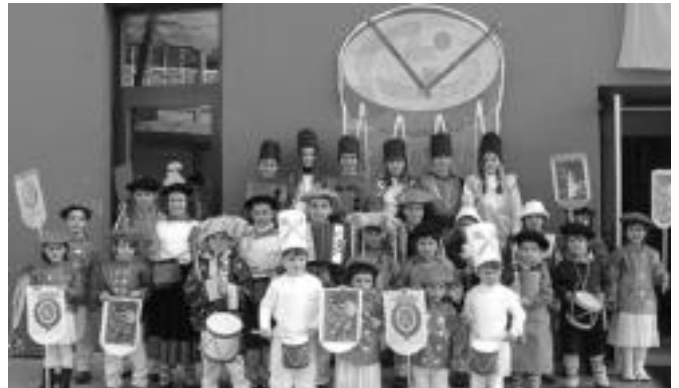
Laskorain ikastolakoek Ostegun Gizeneko festarako 'Pan, parran, pan Laskorain danborradan' leloa aukeratu dute. HITZA