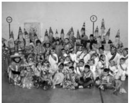
Bidegoangoek kalejira egin zuten: frontoian emanaldia eskaini zuten. HITZA