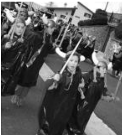
Abaltzisketako bikingoek herria konkistatu zuten. N. U.