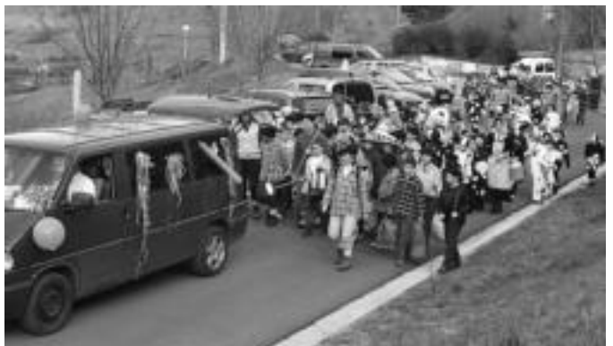
Ibarrako Uzturpe Ikastolakoak mozorroturik kalejiran jeitsi ziren herriko plazara. ASIER IMAZ