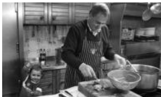
Txinpartan indarberitu eta txarangekin dantzatzera joatekoak ziren. R. CALVO