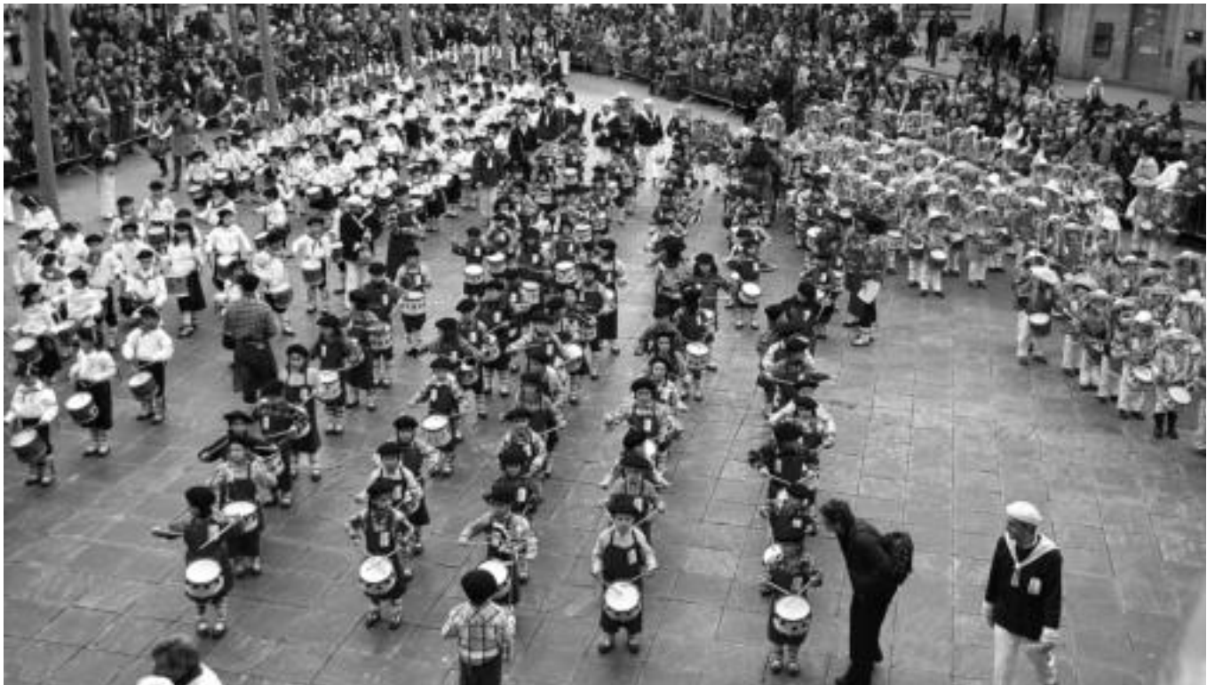
Hunka ume biltzen dira urtero larunbateko danborradan.

Aurtengo Inauterietan hainbat aldaketa barneratu dituzte; alde batetik, kolektorearen lanak direla eta, karroza eta konpartsen ibilbidea aldatu egin dute; bestetik Zaldunita Bezperako danborrada arratsaldera aurreratu dute, 19:00etan aterako direlarik.