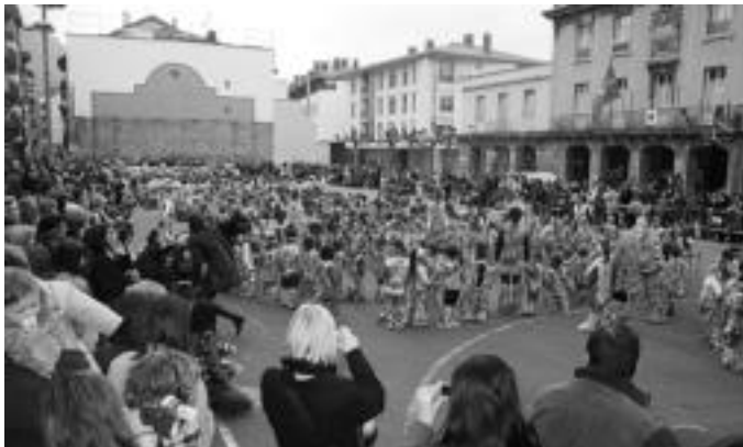
Villabonako plazan Fleming eskola eta Jesusen Bihotza ikastolakoek emanaldia eskaini zuten.