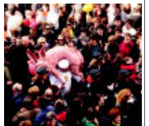
Aurten, 25. urteurrena ospatzeko, Ostegun Gizona pertsonalia sortu dute. N.L.