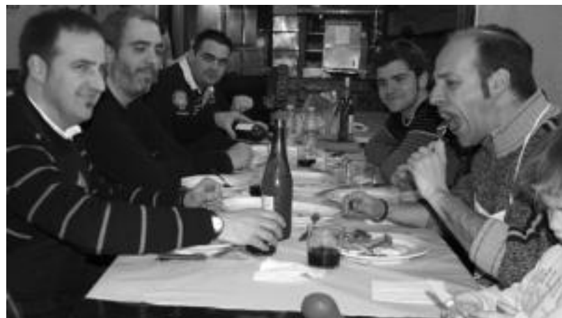
Ero Etxen ere lagun taldea bildu eta hamaiketako egin zuten, ondoren bazkaria eta afaria ere egin zituzten. R. CALVO

@ Inauteriak. TOLOSALDEKO ETA LEITZALDEKO HITZAREN web gunean Inauterietan azken berriak izango dituzue eskura. Era berean, argazkiak eta bideoak ikusteko aukera ere izango duzue. Zuen iritziaz ere jaso nahi ditugu eta horretarako inkesta, eztabaida eta Zurea da Hitza sailak dituzue web gunean: