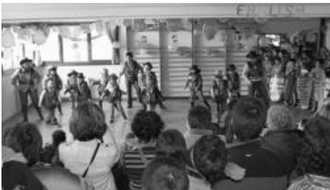
Ikaztegietaoek mailaz maila, munduko hainbat lurralde gonbidatu zituzten. N. U.