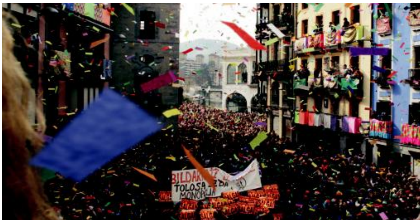
Ehunka lagun bildu ziren atzo eguerdian, Plaza Zaharrean, txupinazoaren unea gertutik ikusteko. Hau botatzearekin hasi zen zoramena guztientzat. REBEKA CALVO

GAUR Ostiral Mehe eguneko danborradak eta Arpegi taldearen jaialdiak osatuko dute gaurko egitaraua 4-5-6-7