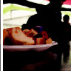
Txistor pintxo ugari banatu ziren atzo goizean jende artean. Txosnagunaren ere 12.000 euroko ireki hasi zen jala. JESSICA CAVIDO, N. LAFABEU