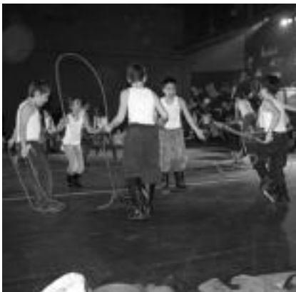
Anoetako ikasleak herenegun, kiroldegian bonberoz jantzi ziren, dantza eta guzti eginez. IMANOL GARCIA