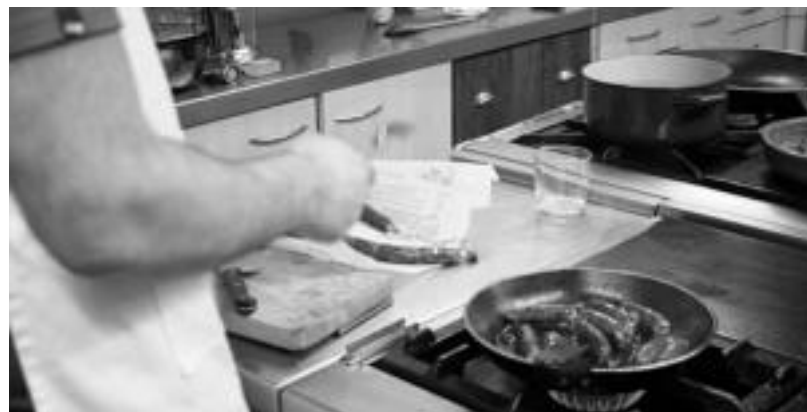
Gure Kaiola Elkarteetan ezin txistorra falta hamaiketako eder bat egiteko. R. CALVO