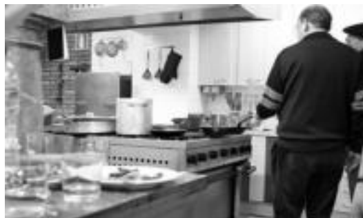
Gure Kaiolan txistorraz gain beste jaki batzuk ere prestatu zituzten. R. CALVO