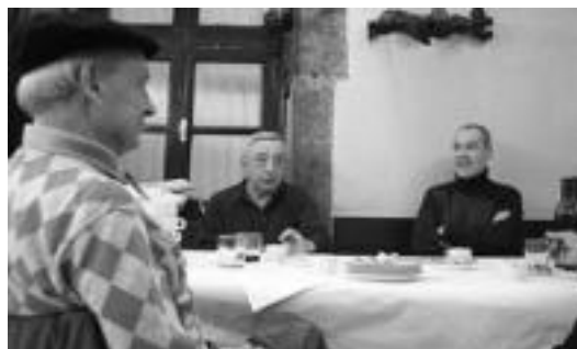
Aurrera Kirol Elkarteetan ere hamaiketako eginda tertulian ari ziren. R. CALVO