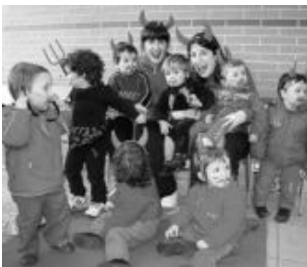
Berrobin deabrutxo talde bat ere irten zen eskolako patiora. A. IMAZ