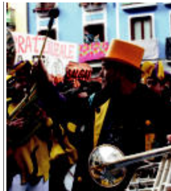
Txupinazo bota ostean Kabi-Alai txarangak. Ostegun Gizeneko doina jotzen hasi ziren; beraienkin batera ibili ziren kaleetan Pintxanakoak. ANSO TORRALBA