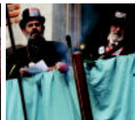
Kabi-Alaiak pregoiari eman zieten hasiera atzo Inauterietan. NICOLA LAFABEU