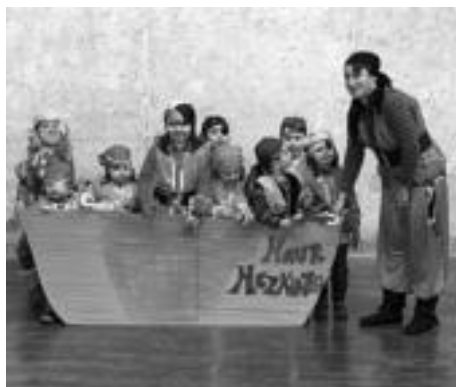
Albizturren piratek altxorra aurkitu zuten. ESTIEZEIZA