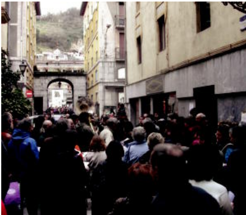
Pasa den hilabeteko saioan Bonberenea Txarangakoek laguntza izan zuten Tolosa Kantari ekimenekoek. HITZA

Datorren kantujiraren hitzordua otsailaren azken larunbatean, otsailaren 28an, izango da, ohibeza, 12:00etatik aurrera. Oraingo honetan Tolosako dultzaineroen laguntza izango dute.