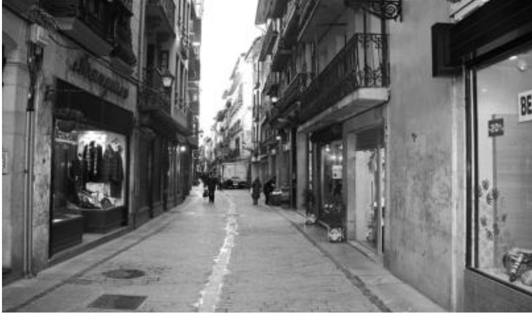
Egun merkealdi garaian daude dendak eta Inauterien gertutasunak ere, Tolosan behintzat, zerbait arintzen du kontsumoa. I. GARCIA