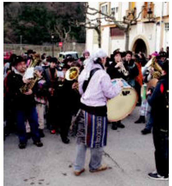
Iruran, herrian zehar egin zuten kalejira. I. GARCIA

Tolosan gaur arratsaldean aterako dira kaldereroak. Lehenago, goizean, erraldoiak eta buruhandiak aterako dira kalejiran Plaza Zaharretik. Arratsaldean, berriaz, 16:00etan Aiz-Orratz elkarte txarangara irtengo da elkartetik, eta 16:30ean elkarte honek antolatutako haur jaialdia izango da Leidorren. 19:00etan, Kaldereroen konpartsa aterako da Plaza Zaharretik, eta 23:30etan, Incansables txarangak kalez-kale ibiliko da.