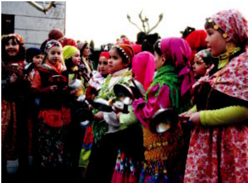
Ibarran plazan elkartu ziren kaldereroak, eta gurdi eta guzti ibili ziren. R. CALVO