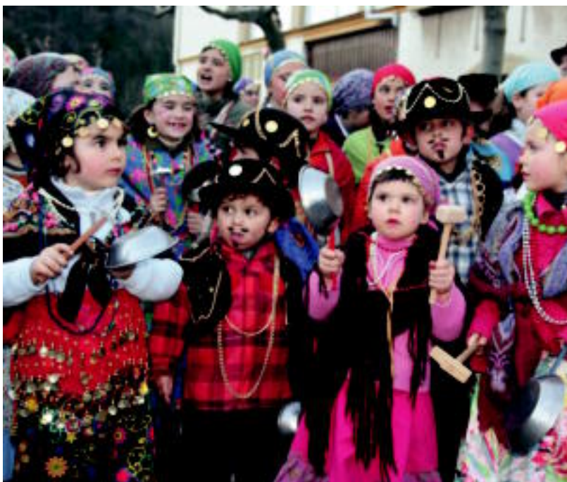
Iruran, gaztetxoak ijitoz jantzita eta eskuan zartagiak eta mailuak zituztela, atzo arratsaldean. I.GARCIA