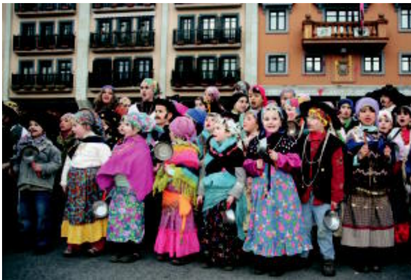
Anoetako plazan gaztetxo ugari elkartu ziren. I. GARCIA