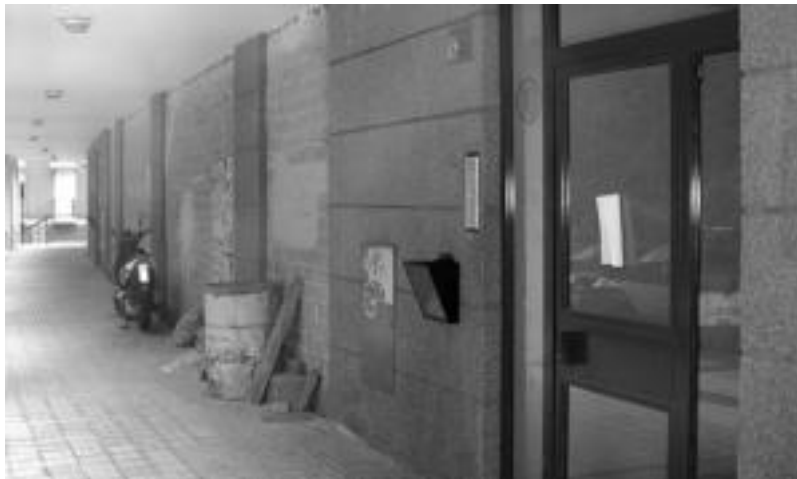
Kale hezitzaileentzat lokal bat egokitzea erabaki du Udalak; eraikin honetan izango da. HITZA

Belauntzarrentzat merkeagoa izango da. Bestalde, lehenatasuna Uliko Mankomunitateko herritarrek izango dute. Izen-ematea Kultur Etxean edo Herriko Jate-txean (asteazkena izan ezik) egin daiteke, otsailaren 22a bitartean. Informazio gehiago 943670020 zenbakian arratsaldez edo belauntza@euskalnet.net -en.