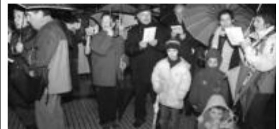
Lehendabizikoa abenduan egin zuten, eta jende ugari bildu zen. HITZA