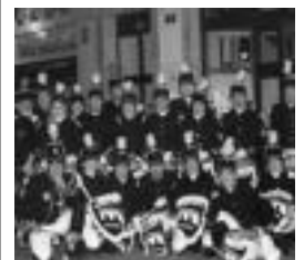
Berazubiko danborrada taldea.

TOLOSA » Inauterietan, Zaldunita Bezperako danborradan aldaketak egongo badira ere, oihutarri jarraituz, Berazubi elkarteok gauz aterako dira. 22:15ean elkartuko dira Berazubin eta San Frantzisko aldera bideratuko dira. Jarraian, Triangulon elkartu eta Alde Zaharretik barrena ibiliko dira. Datorren asteazkenean, hilak 18, entsegu orokorra egingo dute txarangarekin, zezen-plazan, 20:00etan.