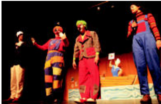
Azken urteetan bezala, Poxpolo eta Mokolo pailazoez izango dira jaialdian. M.S.

Joseba Usabiagak eta Maier Lopezegik aurkeztuko dute jaialdia, eta ia bezala, Poxpolo eta Mokolo pailazoez hartuko dute parte, Al-