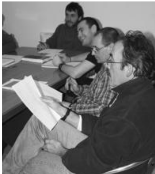
Bertsoak sortu eta garai bateko bertsoak ere kantatzen dituzte. N. URBIZU

Ikasleentako batek azalduta, «herrian bertsosko eskola bat egotea ondo egongo zela genion hiru lagunek eta Gipuzkoako Bertsozale Elkarteari jarri ginen harremanetan. Gero, Udalarri proposamena egin genien, komentatuz, bertsosko eskola bat nahi genuela. Bagenekien parte hartu nahi zuten jendea zegoela». Handik aurrera, Udalak deialdia zabaldu zuen eta ahoz-ahozkoak ere emaitza onak eman zituen. Izan ere, «ez genituen zor-