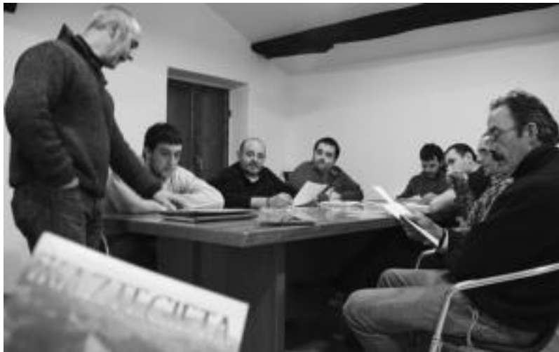
Zortzi lagun elkartzeko dira asteazkenean, bertsotan ikasteko eta aritzeko, beti ere era ludikoan, gozagarrian.

AMEZKETA • Gaur gauean, 21:00etan hasita, Amezketako Larrunarri pilotalekuan Euskadiko Ligako pilota Txapelketako partidak jokatuko dituzte. Lehenik, kadeteen mailako eskuz banakako partida izango da, Zazpi-iturri (Joseba Gallurraide) eta Txukun Lakuako kadetearen kontra. Ondoren, kadeteen mailako eskuz binakako norgehiagoka jokatu dute Zazpi Iturriko Gaztañaga-Jakak eta Txaruta eskolako bikoteak.