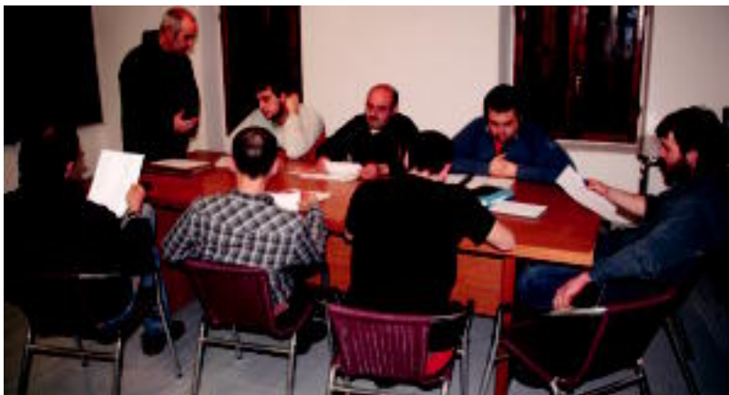
Ikaztegietan zortzi lagun elkartzen dira asteazkenero, bertsotan ikasteko eta aritzeko. NEREA URBIZU

INAUTERIEI BEGIRA «Errespetuzko portaerak defendatze aldera» pegatinak eta pankartak banatuko dituzte 4