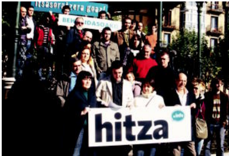
Azaroaren hasieran hainbat eragile bildu zen Behe Bidasoako HITZA laguntzeko Irunen egindako agerraldian. HITZA

Gaur banatu dute 0 zenbakia, baina HITZAren sustatzaileak aspaldi