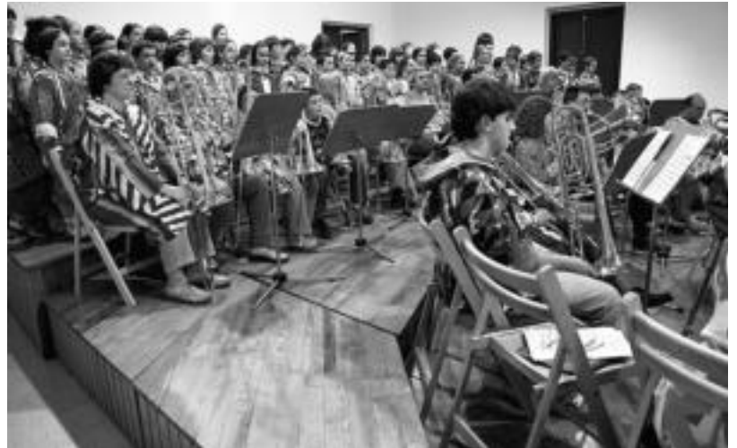
Musika Eskolako kideak Kalderero kontzertuaren une batean. HITZA

Puntu kontakturik: autobusak@diezautobusak.net