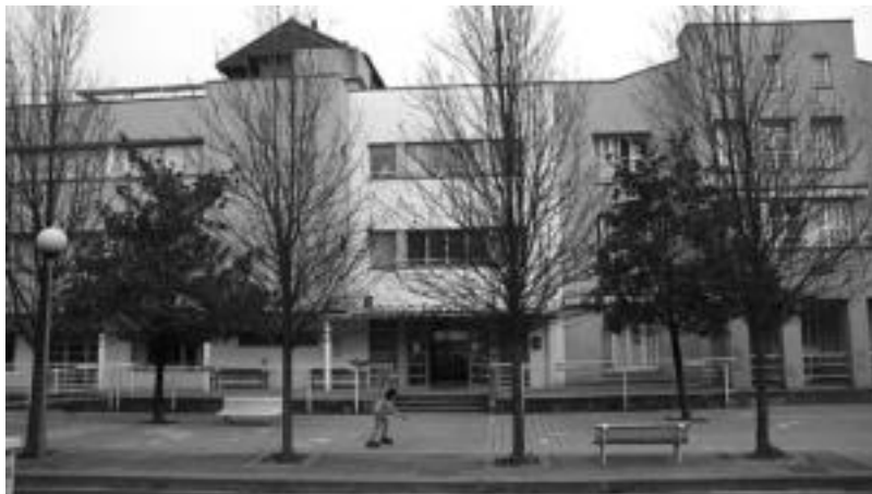
Santiago egoitzan iaizo langile kopuru bera ariko da berriz: 15 langile eta bat ordezkapenak egiteko. I. GARCIA

Villabonako Udalak ELA sindikatuak eta bertako langile batzordeak azken egunetan adierazitako gezurren aurrean mintzatu da. Santiago Zaharren egoitzaren eraikinean «Villabonako alkatearen aurkako kartel eta mezu iraingarriak agertu dira. Kartelak ELA sindikatuak eta bertako langileek sinatuak izan dira». Honen aurrean Villabonako Udalak «goitik behara gezurtatu behar ditu bertan