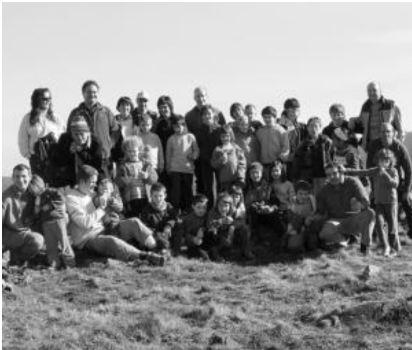
Leitzako Mendibil Mendi Taldeak eta Aurrerak iragan urtean Ipuñiñora antolatutako mendi-irteera. MIKEL ILLARREGI