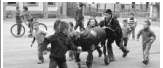
Iaz ere ederki pasa zuten umeek Inauteriak ospatzen. E. EZEIZA

ango dira guztiak; Kuku elkarterean izango da eta babarrun jatea izango da. 17:00etan nesken dantza izango da herriko plazan. Eguna pilotalekuan amaituko dute, bertan izango baita nesken dantza eta gero erromeria trikitalariekin. Talogileak ere izango dira.