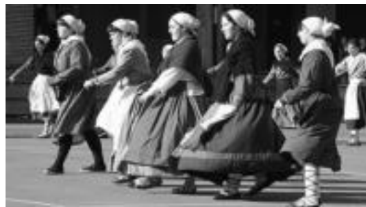
Iazko Dantza Sokaren egunean hartutako irudia.

Egitaraua goizean goiz hasiko da, 8:30ean. Dantzariak plazan bilduko dira ordu horretan eta base-rietara abiatuko dira ondoren, 9:00ak aldera. 11:30ean Loatzo