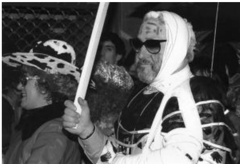
Urtez urte moztorro ezberdina prestatzen du Aranzabek; orain, argazkiak ikusgai dira Amarozko Auzo Etxean. HITZA