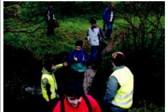
Kultur asteari amaiera emateko mendi ibilaldia antolatuta zuten.