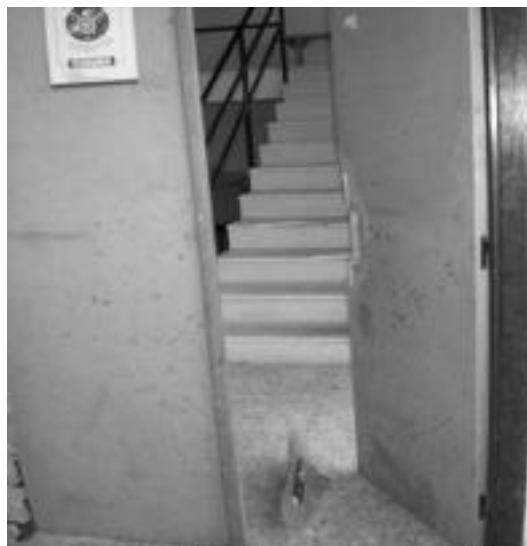
Txolarre irratiara doan atea txikitu zuten erasotzaileek. HITZA

Gertaera honen aurrean, Edurka Pabilioian egun egoitza duten Txolarre Irratiak, Anoetako Gaztetxeak eta musika taldeek adierazi dutenaren arabera, «beste behin ere salatu nahi dugu aski dela eten-