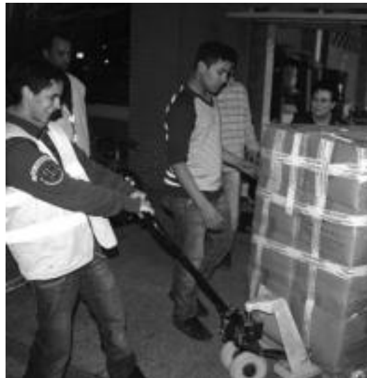
Herenegun gauean aritu ziren janaria kamioietan kargatzen.

Tolosaldea Sahararekin elkar-teak hainbat proiektu garatu izan ditu errefuxiatuen kanpalekuetan. Une honetan bi proiektu dituzte,