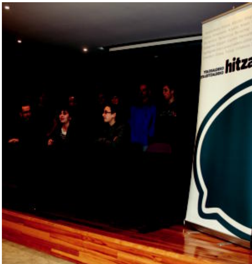
BertsolarHITZA desafioaren aurkezpena egin zuten atzo Ibarako Kultur Etxean.

HELBURUA Hiru bertso eskolek jarriko dute abian desafioa «harremanak sendotze aldera»; finala, apirilaren 4an 7