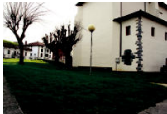
Ezkerreko espaloietik elizainoko espazioa dute parkea egiteko. N. URBIZU

Aurretik, eskolaren parean dagoen lurra zertxobait moldatu beharko dute, gorabehera batzuk baititu. Erdiko farola ere kendu beharko dute.