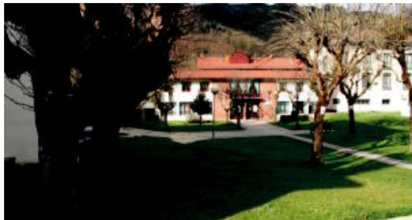
Eskolaren parean parkea egingo dute, eta ahalik eta berdegune gehiena mantenduko dute. N. URBIZU