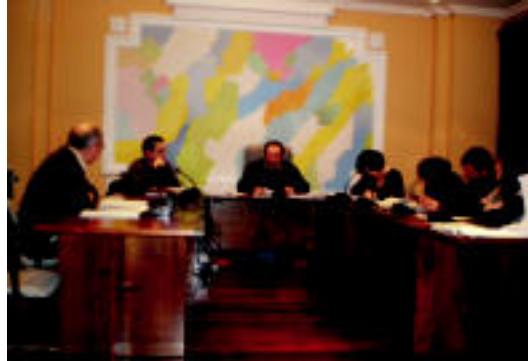
Udalbatzak mozioa aztertu zueneko osoko bilkura.

Eguno Anoetako Udalbatzak hainbat argudio zehaztu ditu onartutako mozioan. Horrela,