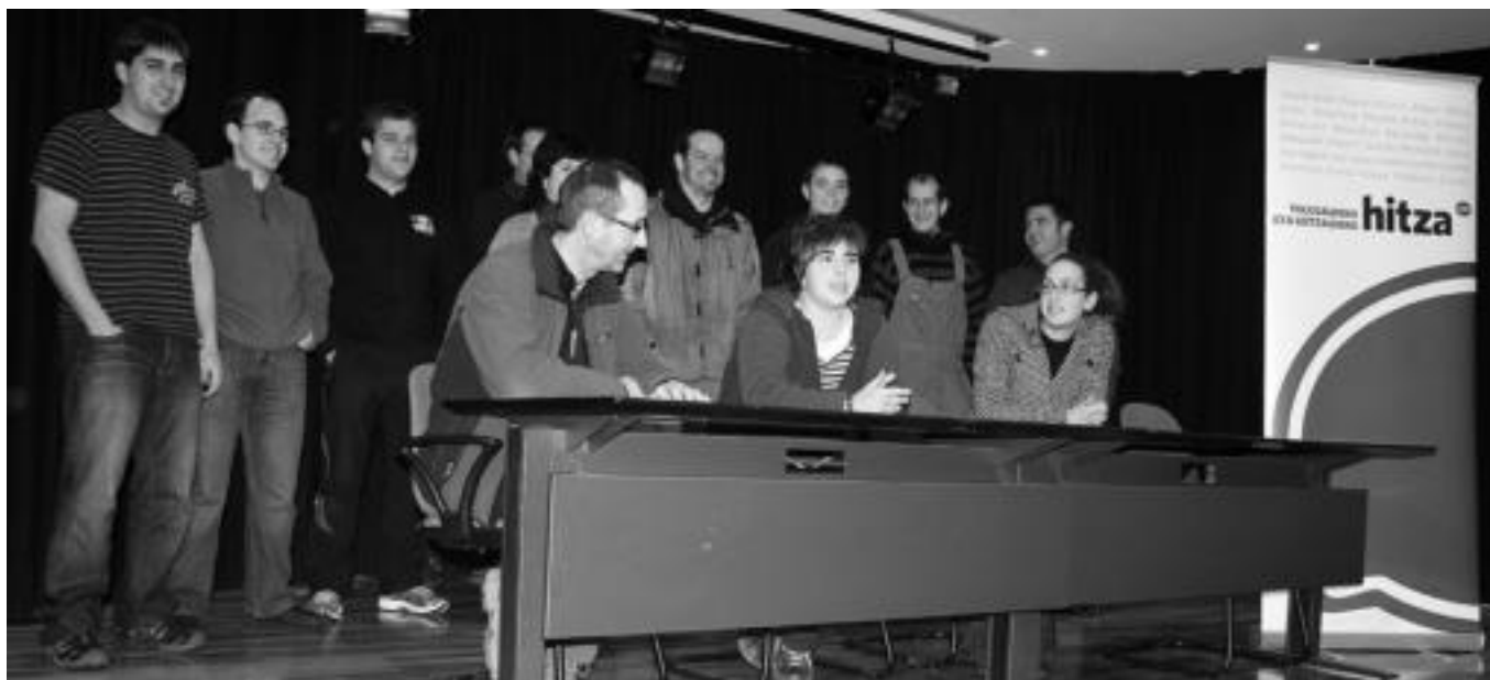
'Tolosaldeko eta Leitzaldeko BertsoarHITZA Desafioa' aurkeztu zuten atzo Ibarako Kultur Etxean. Alegiako eta Ibarako bertso eskolako kideak bertan izan ziren besteak beste.

Antolatzaileen esanetan, eskualdean helduen bertso eskola gehiago aurkitzen dira, «baina helburu honetarako maila soberan eduki arren, parte hartzea ez dute argi ikusi. Hala eta guztiz ere, hurrengo urtean berriz antolatzen baldin badugu, Leitz, Berastegi, Amezket... desafioan egotea espero dugu».