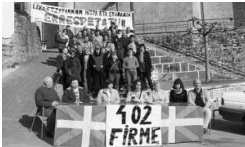
Otaola alkatezatiak kentzeko 402 sinadura bildu ziren; irudian horren harira eskainitako prentsaurrekoa. N. GARZIA