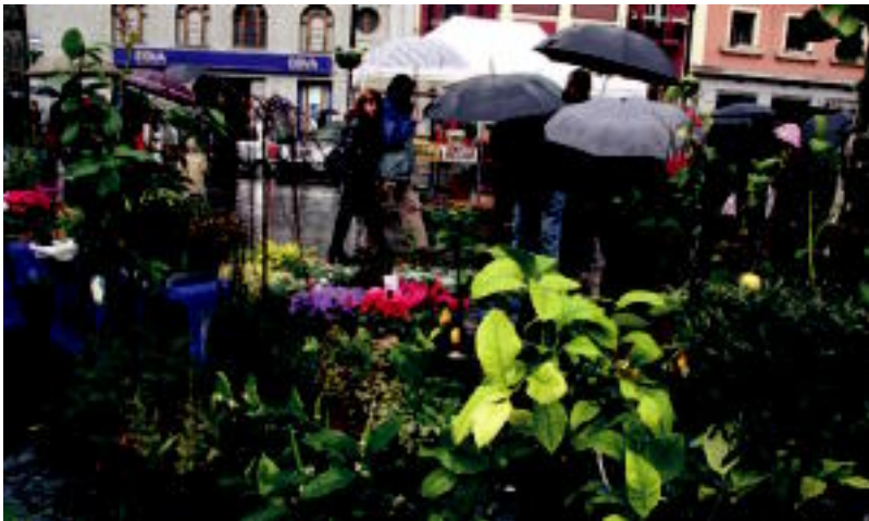
Kolare biziko zuhaixka eta landareak ikus zitezkeen atzo goizean, Triangulo plazan. E. EZEIZA