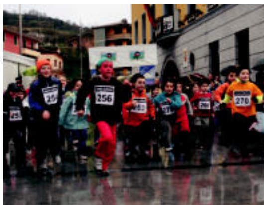
Gaztetxo ugari hartu zuten parte atzoko krosean. I.T.