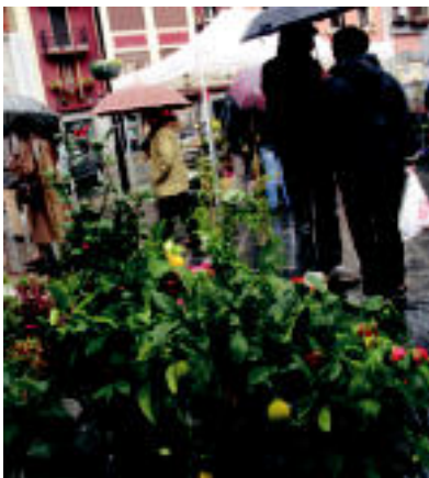
Zuhaixken artean, besteak beste, limoiondoak. E. EZEIZA