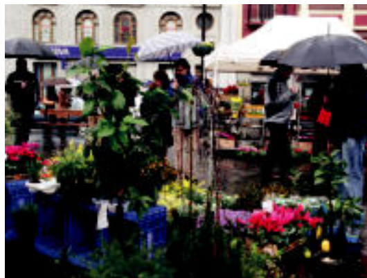
Ez zen jende gehiegi izan eguraldi txarra dela eta. SINADURA

LIZARTZA Atzo ekin zieten lizartzarrek festei; eguraldi kaxkarra izan arren, giro onak ez zuen hutsik egin herritarren artean s