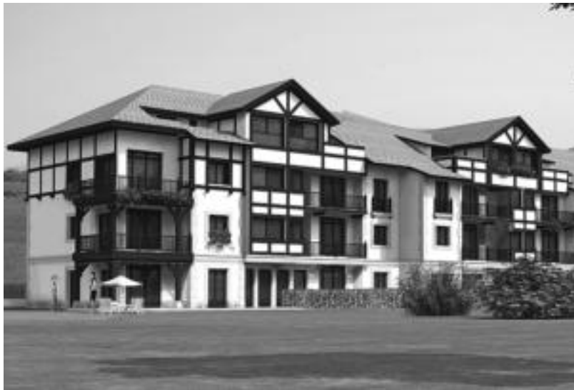
Printzipioz, momentuz, bi bloke egingo dituzte: bakoitzean zazpi etxebizitza izango dira. HITZA

Deialdi honetarako, baldintza berriak adostu dituzte eta jende gehiagori parte hartzeko aukera emateko bi talde osatu dituzte. Lehenengo taldearen baldintzak hauek dira: alde batetik, jabegoan etxebizitzarik ez edukitzea, edo, edukiz gero, hura saltzeko konpromisoa hartzea.