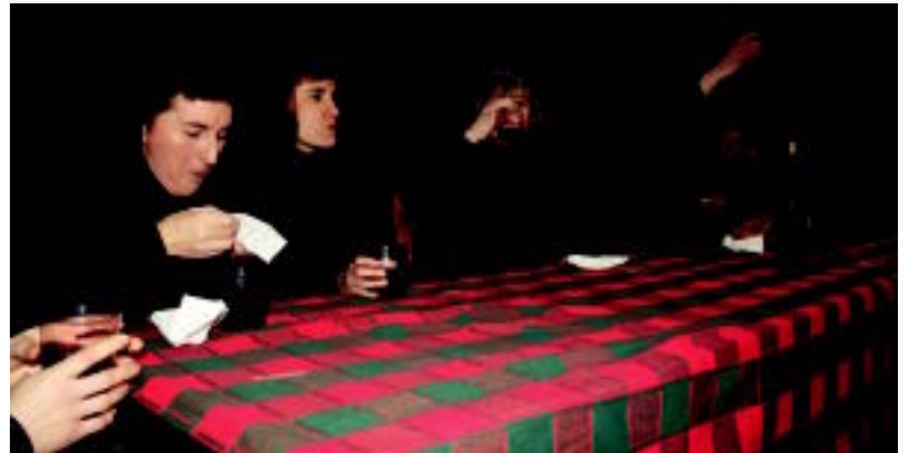
Udala osatzen zuten emakumeak, gibel-pintxoak jaten. N. URBIZU

Banakoia, Orpo-Punta, Orioko balea, Sorgin dantza, Gipuzkoako eta Baztango zortzikoa, Agintari... eskeini zituzten dantzariak. Bitartean, txekor-gibel pintxoak banatu zituzten jendartean, ohi bezala. Típula, ogia eta haragia zeramaten. Jendeak eskertu zuen mokadutxoak.