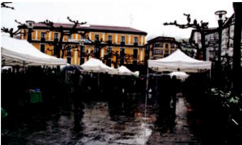
Euria eta hotza egin zuen atzo goizetik, ondorioz, espero baino jende gutxiago hurbildu zen azokara. E. EZEIZA