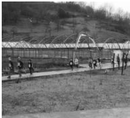
Arrakastatsua izan zen arratsaldeko krosa. Goizean, zaku karreratan ere jendea animatu zen.

Lau maila desberdinetan banatuta zeuden korrikalari gazteak, eta zaharrenak 1995. urtean jaiotakoak izan ziren; gazteenak, 2001ekoak, hain zuzen. Kazkabarrapean egonda ere, aritu ziren.