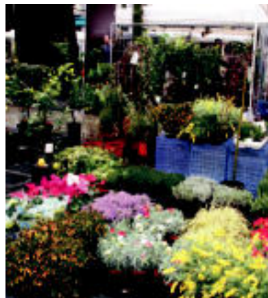
Udaberriari begira, lorategiak apaintzeko aukera. E. EZEIZA