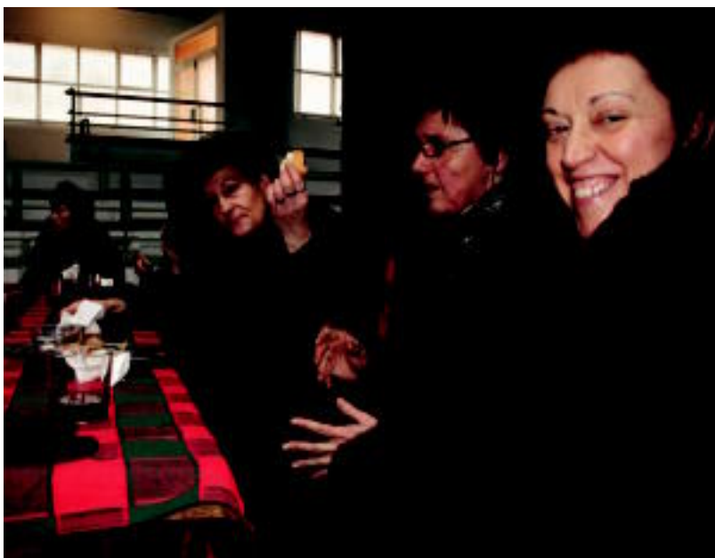
Goian, Otsolar dantza taldekoen saioaren une bat. Behean, antzerkiaren irudi bat. N. URBIZU