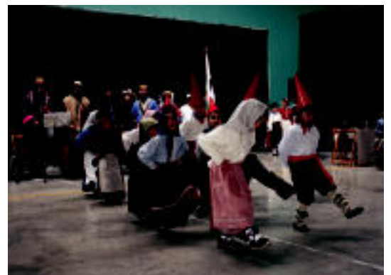
Antzerkiaren ondoren, Otsolar dantza taldearen saioa izan zen, adin guztietakoak. Irudian, txiki-txikiaren dantzetako batean. N. U.