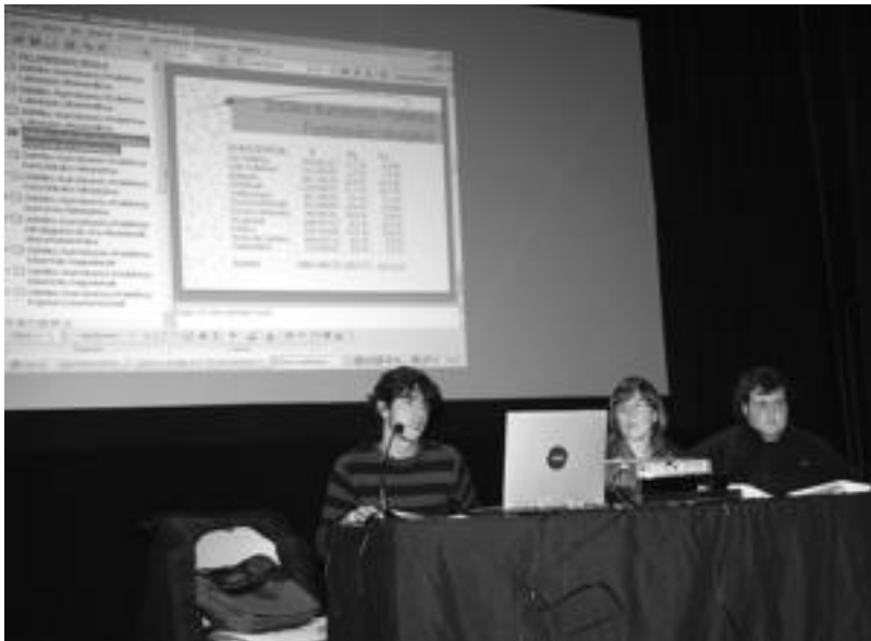
Izagirre, Arretxe eta Ayestaren Gurea aretoan egindako aurkezpenean. I. GARCIA