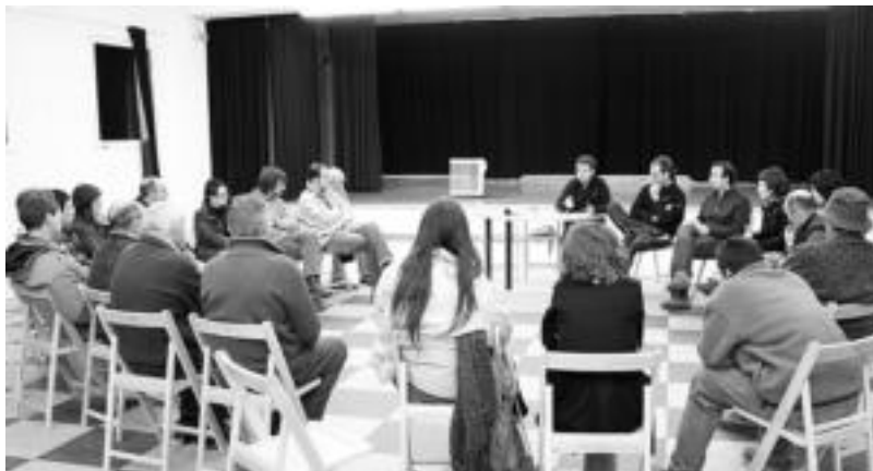
Kultur Etxean egin zuten bilera informatiboan 18 lurjabe egon ziren, informazioa eskuratu nahian. N. URBIZU

Alegia » Lurjabeen zuzendutako bilera informatiboan hainbat zalantza argitu ahal izan zituzten.