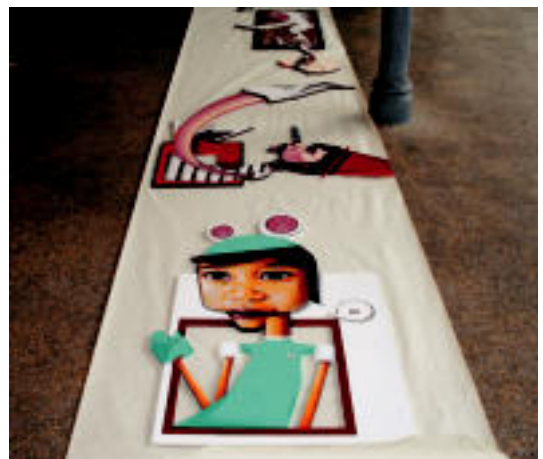
Lanaren zati bat dagoeneko egin zuen Beasaingoak. N.L.