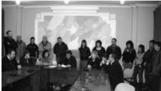
Anoetako udaletxean eman zuten prentsurrekoak. I. GARCIA

Anoeta » AHTren bultzatzaile nagusien jarrera salatu dute, «informazioa zabaltzearen aurkako jarrera» baitute.