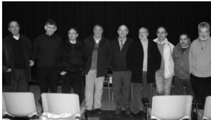
Gizonen Elkarguneko kideak urtarrilean egin zuten aurkezpenean.

Emakumeen eta gizonen arteko berdintasunerako bidean, atal berezia izango du emakumeenganako indarkeriak. «Indarkeria mota asko daude, eta horietako batzuk, ezkutuan, gainera, eta horiek aztertuz hasi beharko genuke», dio Arakamak. «Gure kulturaren oso barneratua dago gizona ardatza izatea, eta bigarren mailan edo azpian emakumea egotea; beraz, oso