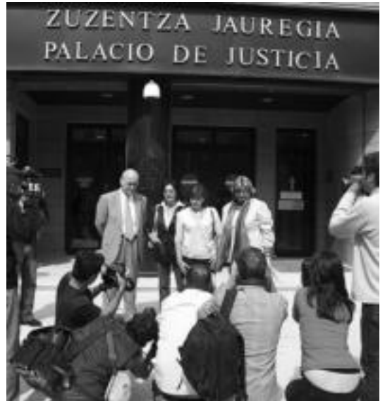
2007an Tolosan izandako epaiketaren ondotik aterako irudia. A. IMAZ

Olanoren aldeko mobilizazioak Peio Olanoren epaiketa dela-eta hainbat mobilizazio egingo dituzte herrian.