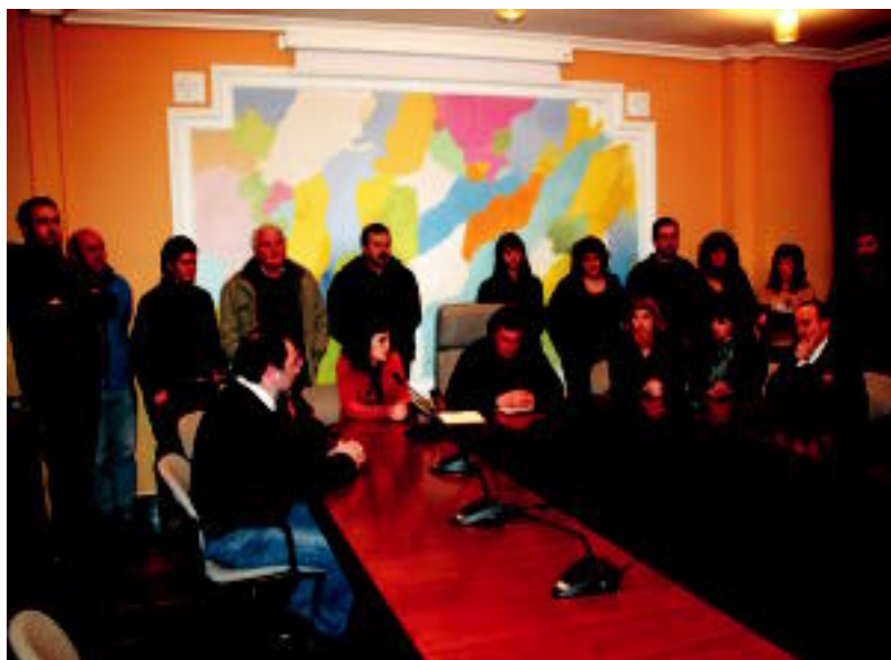
Aduna, Hernialde, Anoeta, Alegia, Gaztelu, Tolosa, Ibarra, Leaburu-Txarama eta Amezketako Udal hautetsiak. I. GARCIA