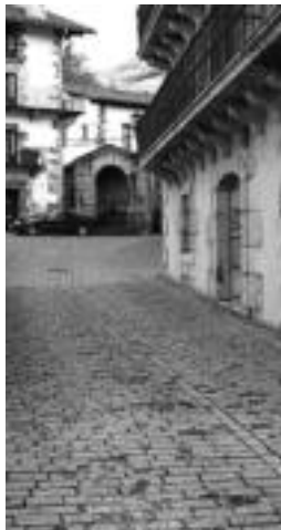
Adokinen konponketa. A.I.

«Nafarroako Gobernuak haur eskolen inguruko dekretua atera zuen, 2010. urterako haur eskola bakoitzak bete behar zituen baldintzekin. Nafarroako Gobernuak hobekuntza lanetarako ez du normalean diru laguntzarik ematen, berria eraikitzeko bakarrik, eta dekretu horretara egokitzeko erreforma hauek deialdi honetan sartu genituen: eskuak garbitzeko iturriak, leiho berriak, berogailu sistemaren hobekuntza... Egokitu ezean 2010ean Haur Eskolak aurrera jarraitzeko zailtasunak aurkituko lituzke».