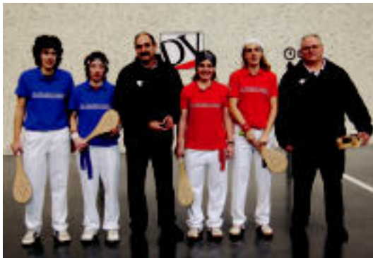
Su-Berriko pilotariak asteburuko Diario Vasco Saria partidan. HITZA

Pilota » Lau txapelketetan aritu ziren eta guztietan ere «pilotarien maila altua» nabarmendu dute pilota elkarte arduradunek.