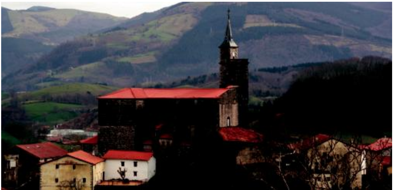
Asteasuko Elizmendi auzoan dagoen parrokiari teilatua eraberritu diote. I. GARCIA