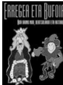
Ikuskizunaren kartel iragarlea. HITZA

Lasterketa erraldoi honek euskararen aldeko kontzientzia suspertzea eta gaur-eguneko euskaltzaren eguneroko lana indartzeko dirua biltzea ditu helburu. 1980an Euskal Herria Oñatitik Bilbora zeharkatu zuen 1. Korrika antolatuta zenetik, euskararen alde antolatzen den ekitaldirik jendetsuena eta garrantzitsuenetakoa da. Ordudunik 15 Korrika eta 28 urte igarodira.