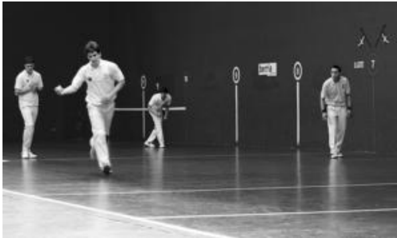
laz, Tolosako Beotibar pilotalekuan, Aurrera-Saiaz eta Ernioeren arteko norgehiagoka batean. N. URBIZU

Amezketako Zazpi-Itturrik hilaren 20ko asteburuan jokatu du baina zehazteke dagoen taldearen kontra. Danok Lagunak eta TxumuluXueta pilota eskolen artean dago aurkaria: kontua da, duela hamar bat egun izandako zi-