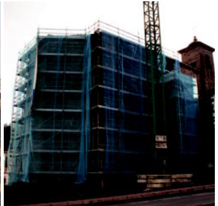
Larraulgo elizan (ezkerrean) eta Goiatz auzoko elizan (eskuian) aldamiok jarritu dituzte egunotan.