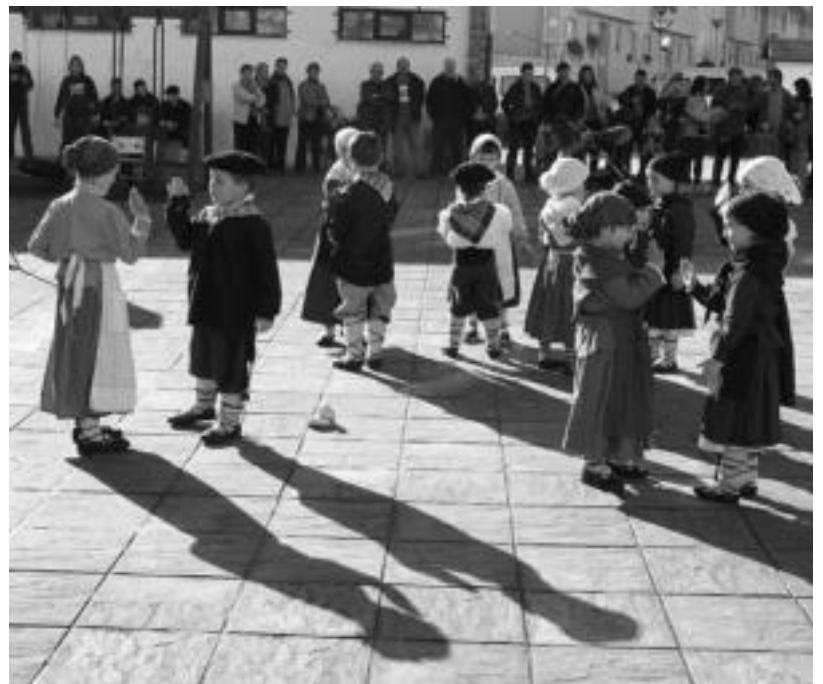
lako Inauterietako Otsolar dantza taldeko haurren emanaldia.

Inauteriak ijito erretzearekin amaituko dira, 20:30ak inguru.