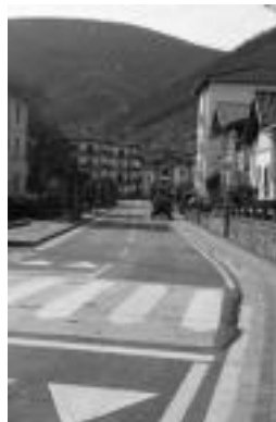
Bi zeharbide berri herri sarreretan. A.I.

«Puntu honetan oso zailak diren obra txikiak sartu ditugu. Adibidez, saneamenduen inguruko berbideratzeak; Lesakeneako espaloia; Alde Zaharrerako sarrera nagusia; Patxi Arrazola 36ko aparkaleku publikoa; elizara doan bidearen garbiketa eta konponketa...».