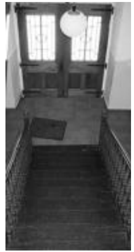
Udaletxean igogailua. A.I.

«Trafikoarekin arazo dezenteokoa daukagu abiadura dela eta. Bi puntu zehaztu ditugu eta hauetan altuera duten zeharbideak jarriko dira herri sarreretan. Bata Uitzitik datorren bidean eta bestea fabrikako bidean, Sagasti Jatetxearen ondoan. Herri barnean jartzea oso zaila izaten da, araudiak baldintza batzuk dituelako: errebueltak bategatik 50 metroa ezin da jarri... Orduan, kanpotik datorrenaren abiadura jaisten saiatu behar gara».