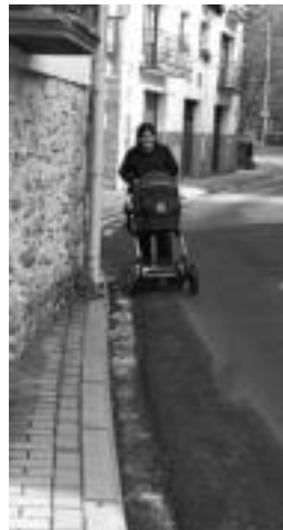
Oinezkoentzat espaloia. A.I.

«Printzipioz bi ekintza edo aktuzio ematen ari dira: alde batetik gaizki dauden puntu konkritu batzuen moldatzea eta bestetik, kottxe gehien ibiltzen diren zirkuitoak edo guneak markatu, urratu eta adokinak gehiago iraun dezan bilatuko da, horrenbeste ez mugitze-ko».