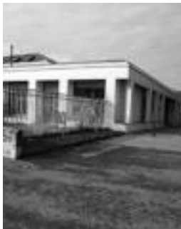
Haur Eskolan egokitze lanak. A.I.

Xabier Zabalok alkateak ondoren puntuz puntu azaltzen ditu proiektu bakoitzaren nondik norakoak, zergatiak, baldintzak eta abar.