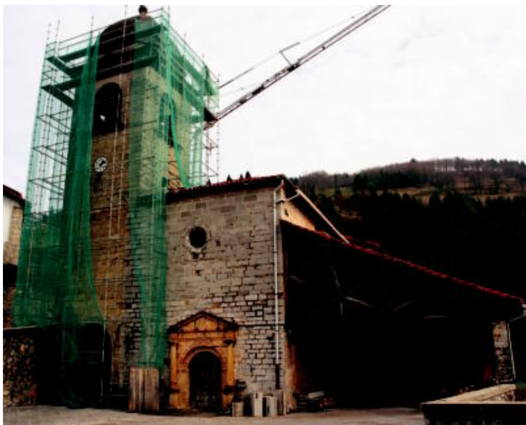
Belauntzako eliza ere berritzen ari dira egunotan; eskualdeko beste batzuetan ere obretan daude. IMANOL GARCIA