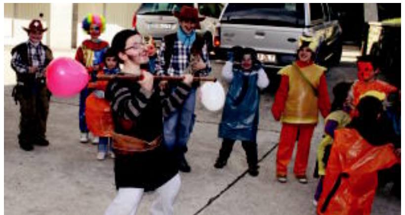
Aresoko Zirkoak alaitu zituen kaleak atzokoan, herriko Inauterietako lehen egunean. ASIER IMAZ