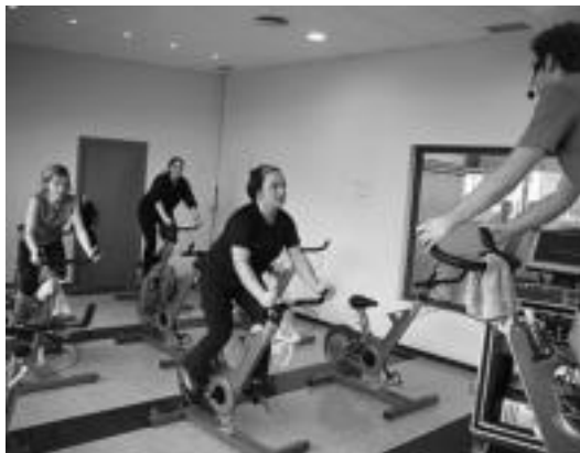
Kiroldegian egiten den cycling-eko klase bat. I. GARCIA

urterako mailegua eskatu zuen Udalak eta urteroa, interesak eta amortizazioa kontuan hartuta, 260.000 euro inguru ordaintzen ditu. Bestalde, kiroldegiaren kudeaketak defizita sortzen du, hau da, gastuak diru sarrerak baino handiagoak dira.