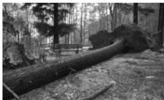
Douglas izeiak 35 metro inguruko luzera dauka.