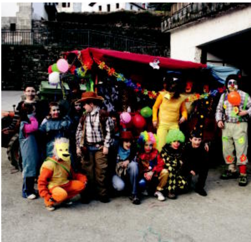
Eskolako haur eta gurasoak kalejiran irten ziren lehen egunean.