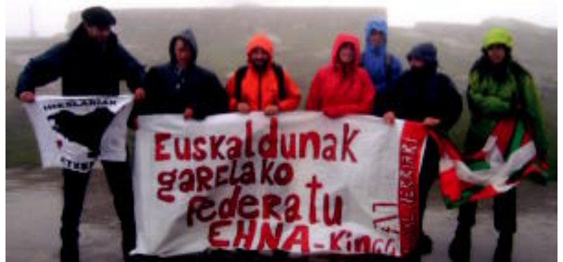
Azken irteera Larrun mendira egin zuten ibartarrek, nahiz eta eguraldia etsai izan. A. IMAZ

Ibaratik mendizaleak 08:00etan irteerako dira otsailaren 8an, igandean. Donibane Garazin autoak utzi eta Beorlegira joango dira, ondoren haserako puntura itzultzeko. Ibilbidea «oso erraza» dela azaldu dute, 3-4 ordutakoa.