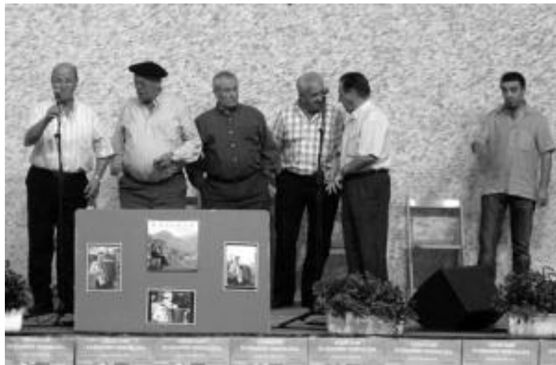
2005ean Kaxianori omenaldia egin zioten Lizartzan eta bere garaiko bertsolariak aritu ziren. HITZA

Urte bat beranduago Baserritik kalera diskoa argitaratu zuen eta hartutako bidearekin jarraitu zuen: euskal sustraiari lotutako doinuak ziren, kanturako asmaturak edo dantzarako, letrak ere be-