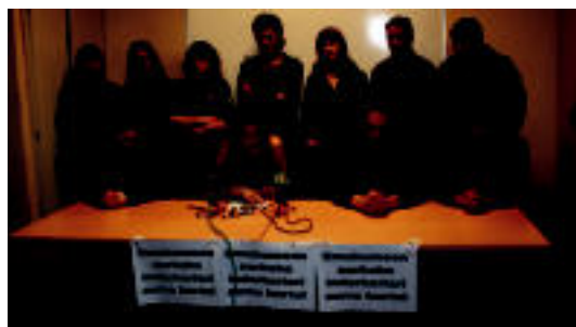
Agerraldia egin zuten testua aurkezteko. I.TERRADILLOS

LEABURU-TXARAMA Ezker abertzaleak Udalaren jarrera salatuta, «haserre» daudela esanez <