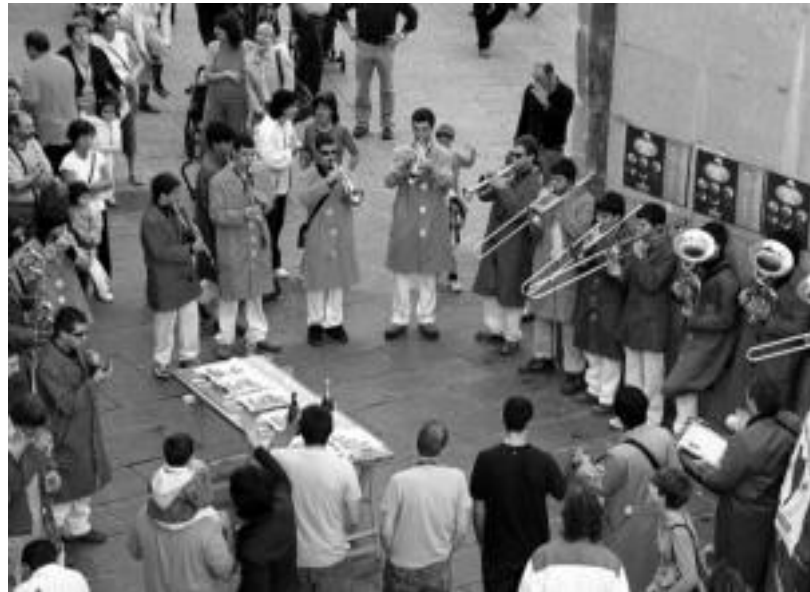
Kaleetan ez ezik, etxean entzuteko aukera ere izango da orain Bonberenea Txarangaren musika. NAIARA URBIZU

Bonberenea Txaranga 2003ko abenduan sortu zen Bonbereneako urteurrena alaitzeko asmoz. Hasiera batean urteurreneko ekintza bat bazen ere, gogo biziz