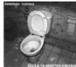
Diskoaren azala. HITZA

Diskoko kantua, txarangako kideek konposatutako zein beste kantuen moldaketak dira eta kantuen partitura liburua, instrumentu bakoitzarentzat prestatutako partituras, kantuen hitzak eta Eneko Aranburuk idatzitako txarangaren biografia aurkitu ahal izango dira.