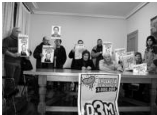
Ezker abertzaleak Udalaren jarrera salatzen agerria egin zuten. R. CALVO

Kontua atzetik dator, «nahiz eta azken Udal Hauteskundeetan