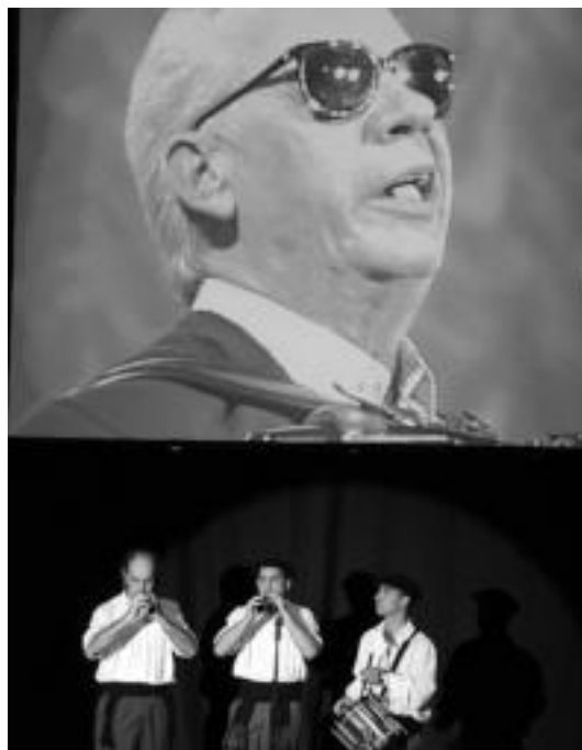
Omenaldian txistuaren doinua ere entzun ahal izan zen.