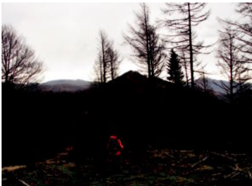
Aizkolegi mendiaren ikuspegia.

■ Aduna Asvinenea Kultur Elkarteak III. Poltsikoko Antzerki Lehiaketa antolatu du profesional zein amateurrentzat. Informazioa eta izen-ematea, www.asvinenea.com webgunean. ■ Asteasu. Otsailaren 7 eta 8rako eski irteera antolatu du Sagain mendi taldeak Luz Ardiden-era. Informazioa, www.sagain.org helbidean. ■ Berastegi. Aurtengo lehen odol ateratzek egingo dira, Muñagorri eskolako aretoan 18:30etan hasita. ■ Ibarra. Bihar, haur Festa 0-12 urte arteko umeentzat Belabieta kiroldegian 11:00etatik 13:00etara eta 15:30etik 18:00etara. Ondoren txokolatada izango da plazan. ■ Tolosa. Inauterietarako karroza eta konpartsetan izena eman daiteke Kultur Etxen 10:00etatik 13:00etara eta 17:00etatik 19:00etara. ■ Tolosa. Bihar, Palestinaren alde-