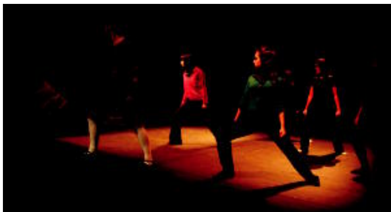
Alurr taldeko dantzariak Leidor antzokian, gaurko emanaldia prestatzen. REBEKA CALVO