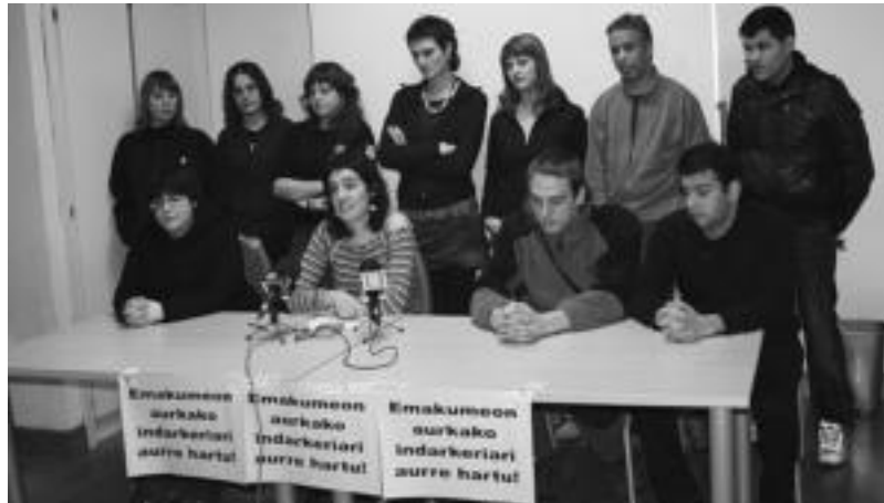
Gazte Independentistak, Sanblaspeko Gazte Asanblada, Bilgune Feminista eta Jatorkin elkarteak, herenegun. I.T.

Herenegun eragile horietako ordezkariak egin zuten agerraldian, kezkaz begiratzen diotela «errealitate gordin honi» esan zuten; «batik bat, kezka sortzen digute gazteen artean ematen ari diren eraso sexistek». Euren iritziz, emakumeen eta gizonen parekidetasunaren alde aurrerapauso handiak eman direla esaten den arren, eta «gizarte aurrerakoi batean bizi garela eta berdintasunera iristear gaudela edo berdintasunean bizi garela dioten arren errealitate bestelakoa da». Izan ere, «ia egunero jasotzen ditugu indarkeria sexistaren albisteak, eta gure eskualdean ere emakume bat baino gehiagok pairatu du horrelakorik».