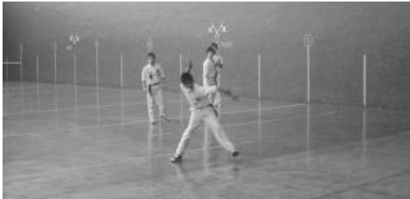
Nafar Jokoen barnean zazpi partida jokatuko dira bihar Amazabal pilotalekuan 10:00etatik aurrera. NAIARA GARZIA

Leitza » Aurrerako pilotariak gaur eta bihar jokatuko dituzte Nafar Jokoetako eta Euskal Herriko Ligako partidak.