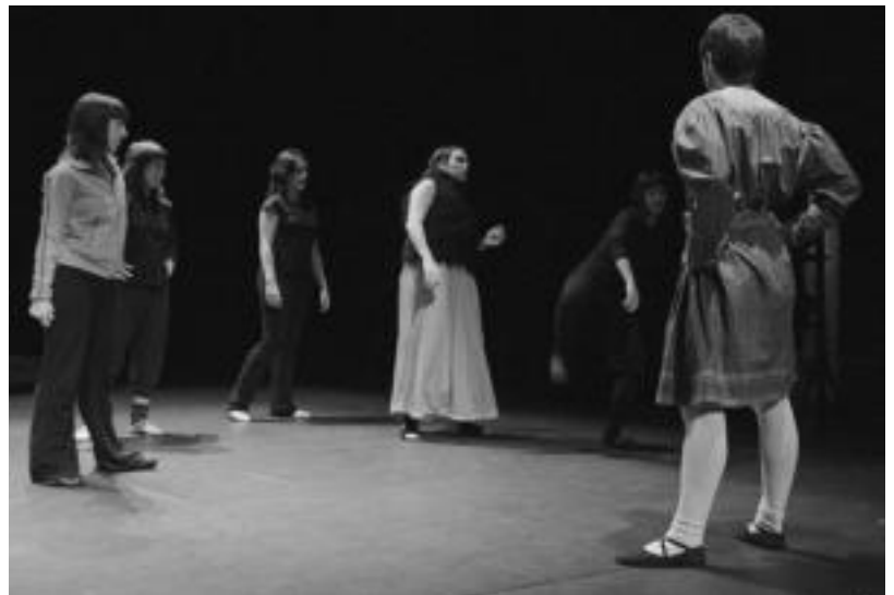
Alurreko kideetako batzuk Leidor antzokian Suaren Ibarra emanaldia prestatzen.

Aipatu «interpretazio» hori Sua pertsonaia gorpuzten duen dan- tzariari egokitu zaio. «Taldea ban- ditugu idazten ondo aritzen dire- nak eta haiek idatzitako esaldiak botako ditu dantzen loturak egite- ko», argitu zuen Iñaki Ulazia dan- tza taldeko kideak.