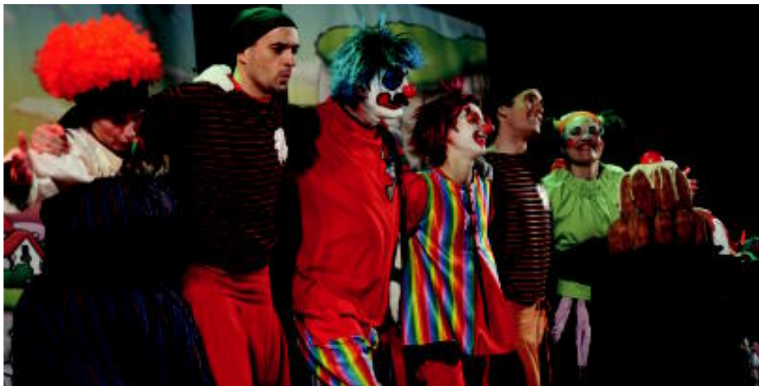
Pirritx, Porrotx eta Marimotots pailazoek euren emanaldia talaratu zuten, Ibarra Belabietara kiroldegian. BARTOLA JAI BATZORDEA

HITZAK ez du bere gain hartzen egunkariaren adierazitako esaneren eta iritzien erantzunik.