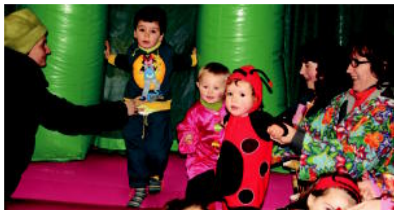
Belaunaldi berriak puzgarriekin jolasean. Helduak baserrik baserrira puske biltzen. A. IMAZ