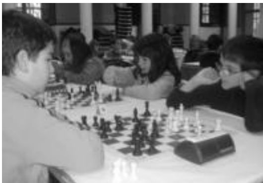
Joan den igandean jokatu zen lehendabiziko jardunaldia. HITZA