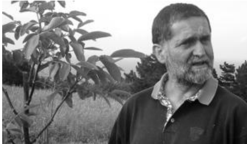
JON FERNANDEZ/LEA-ARTIBAI ETA MUTRIKUKO HITZA

moa gutxitu egin behar ditugula, baina, horiek arrazionalizatuz gero ekoizpena ere ari gara arrazionalizatzen. AHT eta saltoki handiak hartuko ditut adibide bezala, hitzaldiaren hainbat unetan. Ekonomia beste modu batera ulertu behar dugu. Nire azken mezua eraldaketa horretan, bestelako gizarte eredu horretan, oinarritzen da: ekoizpenaz, garraioaz eta ekonomiaz beste modu batean pentsatu behar dugu, aldaketa sakonak egingez. Eta, hori dena nola egin eskualdeetatik pentsatu behar dugu, hau da, nola eman garrantzia eskualdeei. Eskualde biziak izatea lortu behar da, ez azpiegitura handiek kondentatzen dituzten igarotzeko eskualdeak.