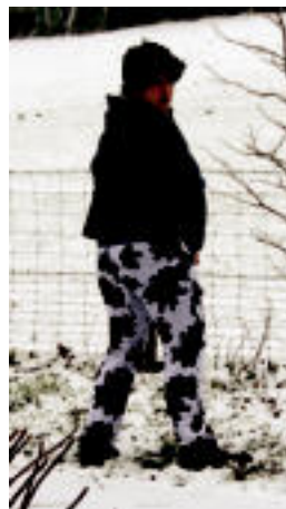
«Me gusta el vino...» kantatuz batzuk, besteak bedeinkatuz. A. IMAZ