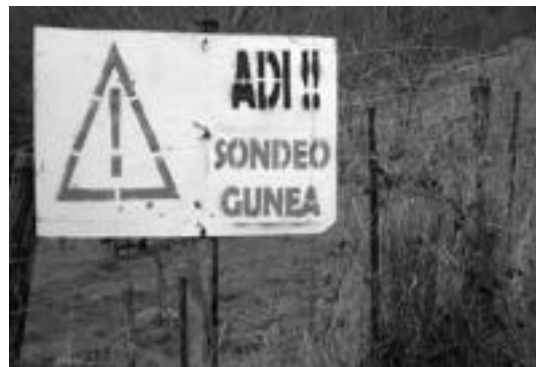
Zundaketa puntu baten ondoan jarritako seinaleetako bat.