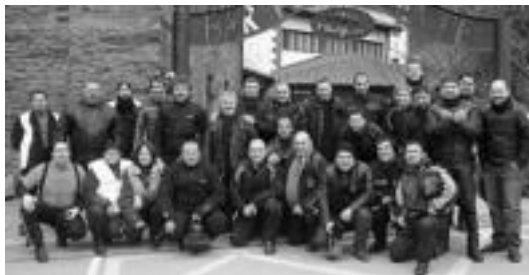
Langostino Moto elkarteak antolatutako azken irteeretakoa irudia.

Ibarra » 27 motorzaleek hartu zuten parte Langostino Moto Kultur Elkarteak antolatutako urteko lehen irteeran.