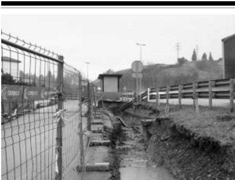
Errepidearen eta Trinketearen arteko lur zatian egiten ari dira lanak oraingo. I. GARCIA