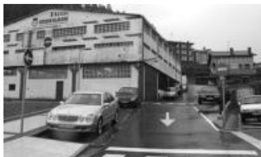
Goiko argazkian ikusten denez, eguraldia ez da ari laguntzen egunotan langileei. Beheko argazkian, Sagasti kalea, orain norantz bakarrean. I.G.

Oraingo errepidean bertan ez dira ari obrak egiten, baizik Trinketearen eta errepidearen arteko lur zatietan. Hainbat seinale jarri dituzte obrak daudela jakinarazteko. Geroago N-1 errepidean bertan egin beharko dituzte lanak, bai bazterbidea zabalduz baita zubia zabalduz ere. Ugaldek eskatu du obrak eragingo dituzten eragozpenak «barkatzeko» eta gogoratu du herritarrek egindako eskaria zela autobus geltokiaren egoera hob-