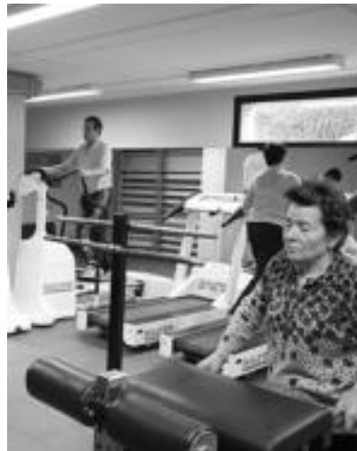
Belabietako kirolgunea zabaldu eta hobetzeko neurri desberdinak hartzeko nahia agertu du Udalak. R. CALVO

Udalaren helburua hainbat faseetan banatuta neurri ezberdinak hartzea da eta horiek gauzateko urteko aurrekontuaren erabiliko