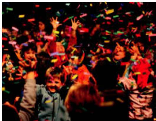
Etoko txikiak ederki gozatu zuten pailazoekin. BARTOLA JAI BATZORDEA

Emanaldia Ibarra Bartola jaien batzordeak antolatu zuen; Batzordeko kideek «Bartola Ibarra egiten ari den lana» azpimarratu nahi izan zuten: «Denok dakigu gure herriko egoera zein den. Guk sortuz irakatsiko diegu elkarlana zer den, ikasi ez duten edo saldu egin duten horiei. Pirata diruzale lapur horien piratak izango gara; elkarrekin ari gara arraunean eta Bartola gure itsasontzia da». Jaiekin batera, bertso jaialdia ere antolatu zuten duela hilabete eskas.