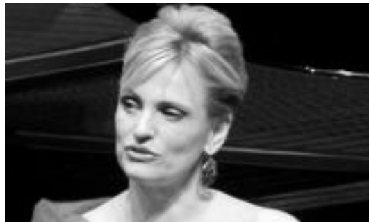
Azken urteetako abesti ezagunenetako batzuk bildu ditu Artetak. HITZA

Azken mendeko abesti ezagunak bildu ditu disko honetan. Due-