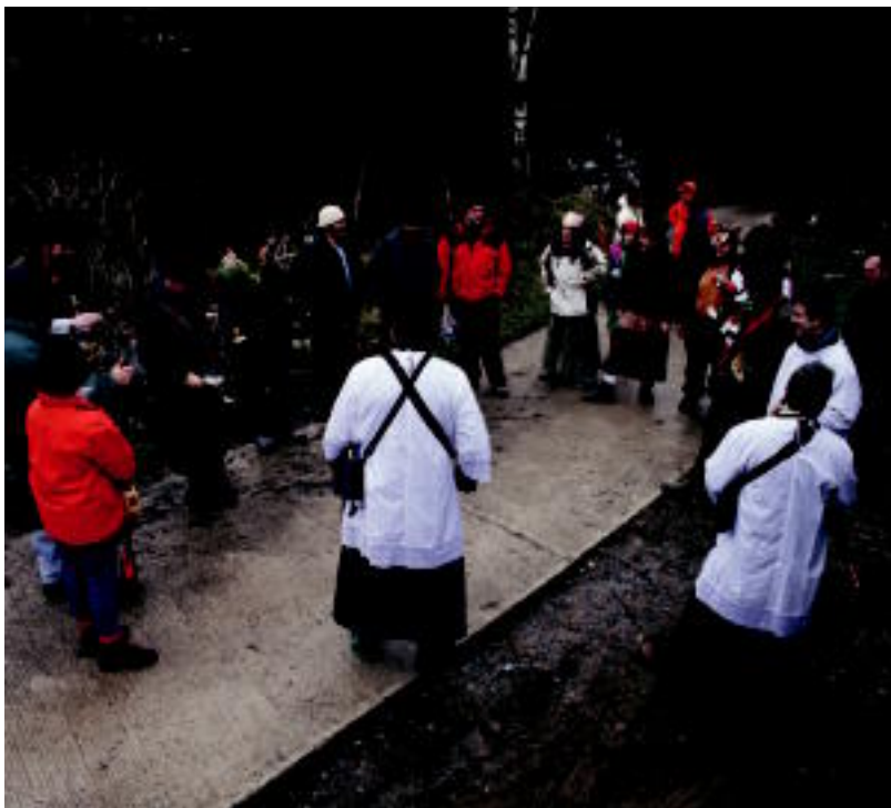
Mozorroak lau taldetan banatu ziren baserri baserri eskean aritzeko. A. IMAZ