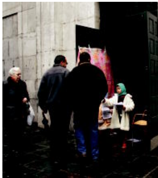
Sahararen inguruko informazioa banatu zuten kalean. E. EZEIZA

Abenduan kanpamenduan izan ziren elkarteko kideek, janari biltokiak hutsik ikusi zituzten, hori dela eta, aurreko urtean jasotako kopurua gainditu nahi dute. Iaz 400 tona lortu ziren, Tolosaldean 10.000 kilo. Aurtengoan ere emaitza hori lortzea espero dute, beraz, elkarteko kideek. Oraingoa Piztu itxaropena lelopean burutzen duten bosgarren elkartasun kanpainara da.