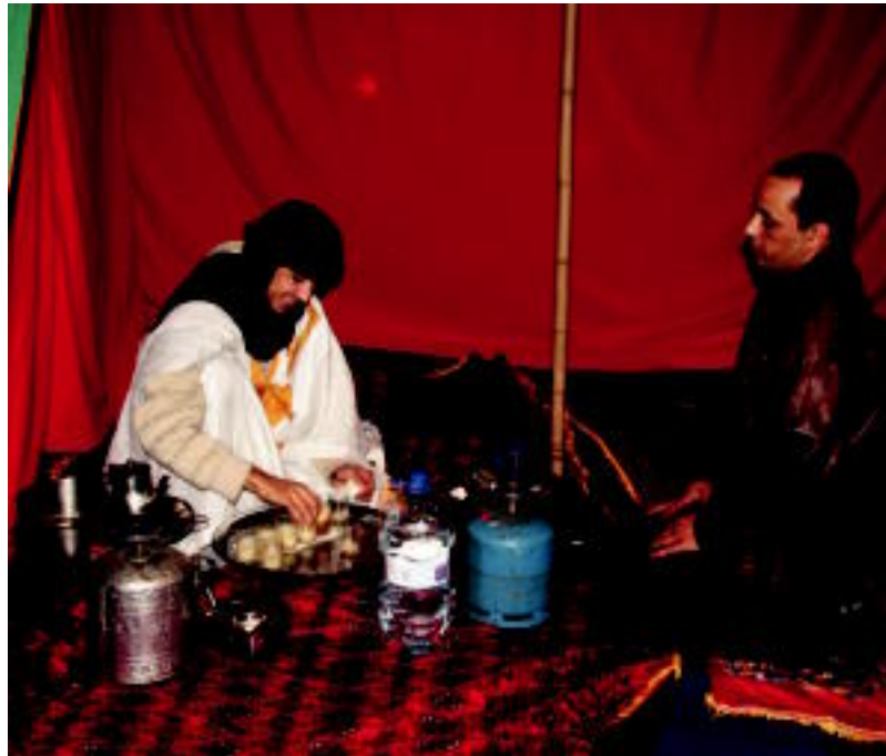
Egitasmoaren baitan, Saharako kultura hurbiltzeko asmotan, haima bat jarri zuten atzo Kultur Etxean. E. EZEIZA

33 urte igaro dira Maroko Mendebaldeko Saharan sartu zenetik, eta Espainiak hau saldu zuenetik. Ordutik, 200.000 saharar Aljeriak utzitako basamortu zati batean bizi dira. Bertako egoera oso gogorra da, lehen mailako beharrak asetzeko ere zailtasunak dituzte, elikagai, ur, medikamentu, osasun