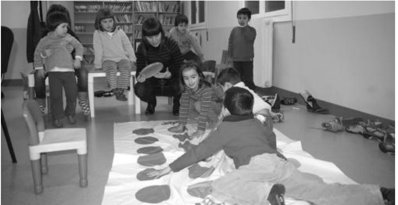
Liburutegiaren gela batean dago Haur Txokoa. Bertan begirale Inetan aritzen direnek aldiro jolasak antolatzen dituzte. I. GARCIA