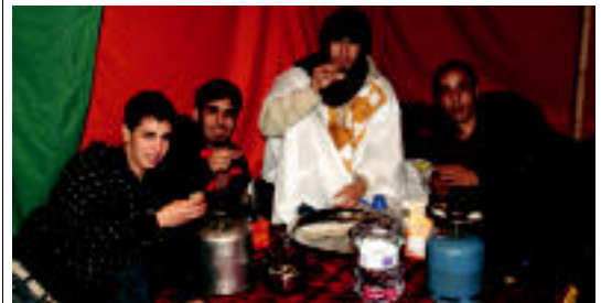
Tea edan zuten Kultur Etxera bertaratu zirenek. ESTI EZEIZA