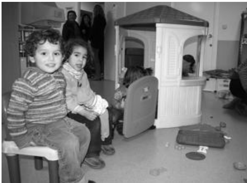
Haurrek hainbat jostailu dituzte jolasean aritzeko. I. GARCIA

Eskuineko gelan dago Haur Txokoa. Lehen leku hori medikuaren kontsulta zen. Hori dena bota da eta gela bakarra egin dute. 2 eta 11 urte bitarteko haurrentzat da, haurrak bakarrik egoten baitira bertan, gurasorik gabe. Lehen ludoteka edo haur txokoa zena Ikastolarekin partekatzen zuten, goizean Ikastolak erabiltzen zuten eta arratsaldean haur txoko bezala funtzionatzen zuten. Egun, egindako berrikuntzak eta gero, Ikastolak goiko solairuan dauden beste bi gela erabiltzen ditu Haur Hezkun-