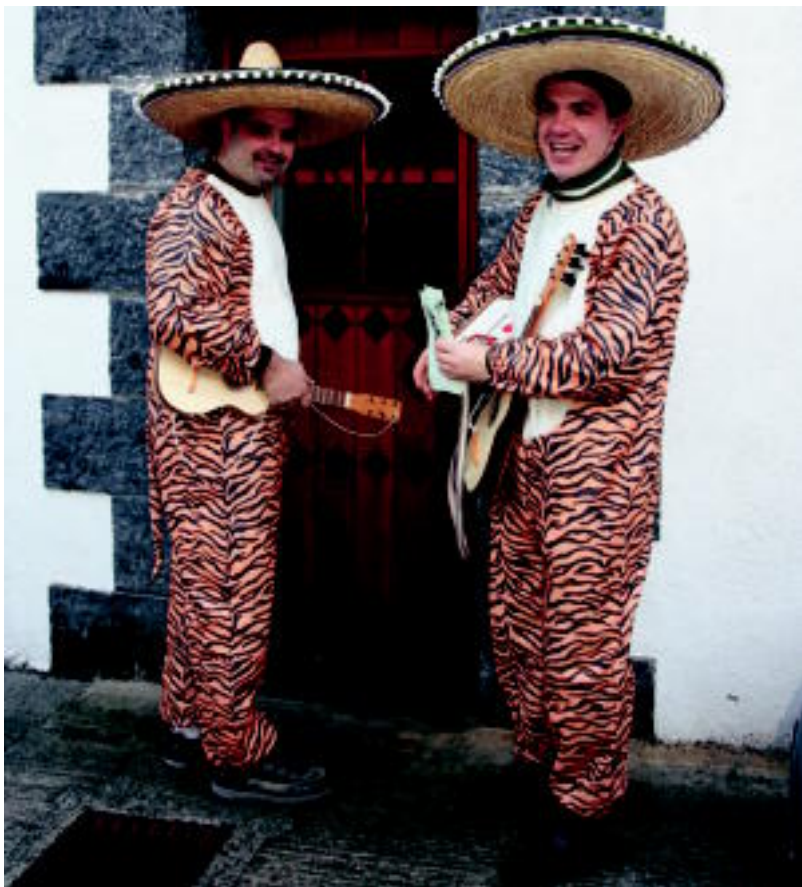
Leitzara etorritako tigre hauek ere eskean aritu ziren atzo arratsaldean. NEREA URBIZU

GAUR Atsaureak irtengo dira plazara txarangarekin; haur jolasak, bertso jaialdia, musika... ere izango dira 5