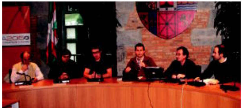
Udaleko zinegotziak, atzoko aurkezpenaren. I. T.

Pasa den urteko abenduan onartu zituzten udal aurrekontuak, eta bertan Udal zergen inguruko %4,9ko igoera aplikatzea adostu