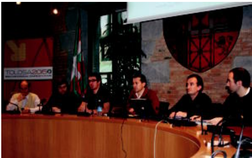
Atzo egin zuten Udal Gobernuako kideek aldaketa berriaren aurkezpena. I.T.