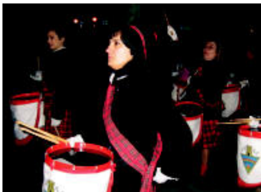
Orain arte gauez egin izan da Zaldunita Bezperako danborrada. I. TERRADILLOS

Bigarren honi dagokionean, zenbait eztabaidaren ostean, azkenik, Zaldunita Bezperan, 19:00etan ospatuko da. Izan ere, iazko Inauterrien balantzea egiteko garaian, Jai Batzordeak atera zuen ondorioetako bat izan zen, gero eta jende gutxiago biltzen zela orduara arte, gaur egiten zen danborrada ikustera. Gainera, aipatzekoa da,