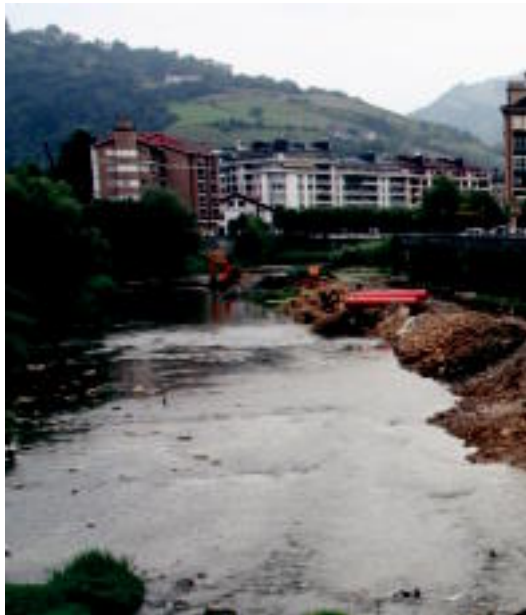
Oinezkoentzat eta txirindularientzat egingo dute zubi berria. I. GARCIA

Hain zuzen ere, atzo aurkeztu zuen Jokin Bildarratz Tolosako alkateak, Udal Gobernuaren osatzen duten gainerako alderdietako zi-