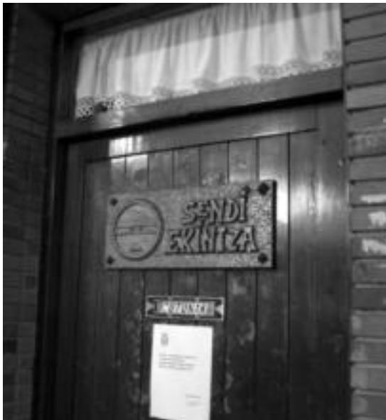
Sendi Ekintza elkarteak filosofia aldatuko du larunbateko batzarrean.