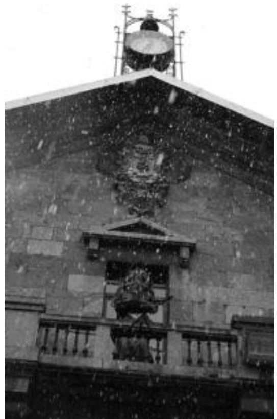
Udaletxeko balkoian dagoen Atsaurea elurrari begira. A. IMAZ