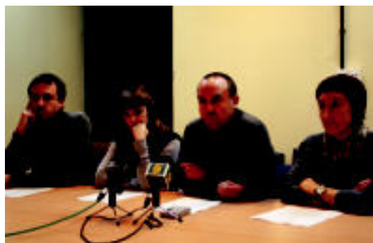
Ezker abertzaleak atzo egin zuen prentsaurrekoaren une bat. EEZEIZA

TOLOSA %20 murriztu dute kulturari dagokiona; 2008ari buruz, balantze baikorra egin dute 3