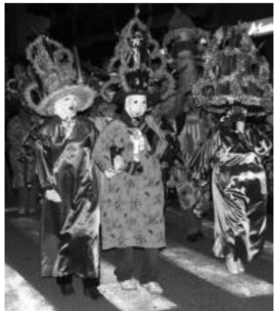
Iragan urteko Ihoteetan atsauren kalejira. NEREA URBIZU