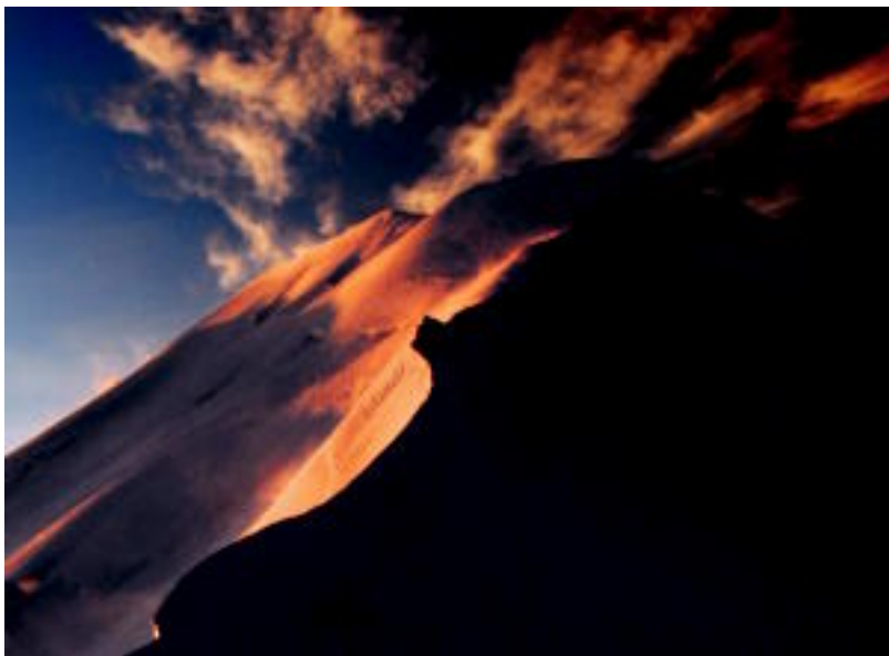
Argazki erakusketan ikusgai dagoen irudietako bat.