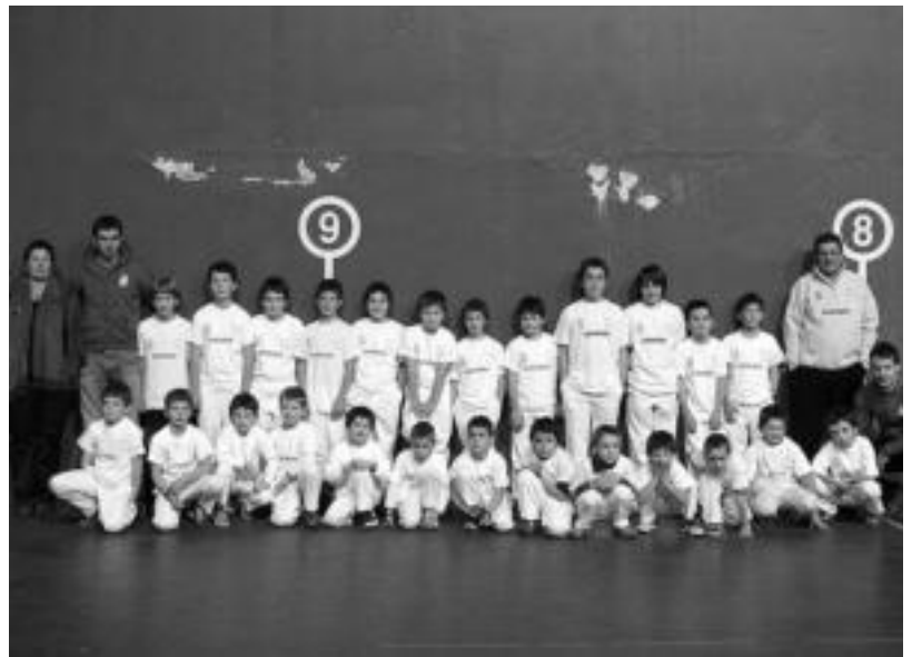
Elkarteak Pilota Eskola ere badu; 27 ume aritzen dira. HITZA