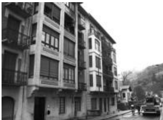
Kondeaneko aldapako 14. zenbakiko hirugarren solairuan piztu zen sua. J.G.

Atzo, 12:00ak inguruan, sutea piztu zen Kondeaneko aldapako 14. zenbakiko, hirugarren solairuan. Dirudienez, sutea piztu zen unean, etxebizitzan pertsona bat zegoen, bainugelan. Honek kea ikusi zuenean, bizilagunak ohartarazi zituen, eta ondorioz, ez zen zauriturik izan.