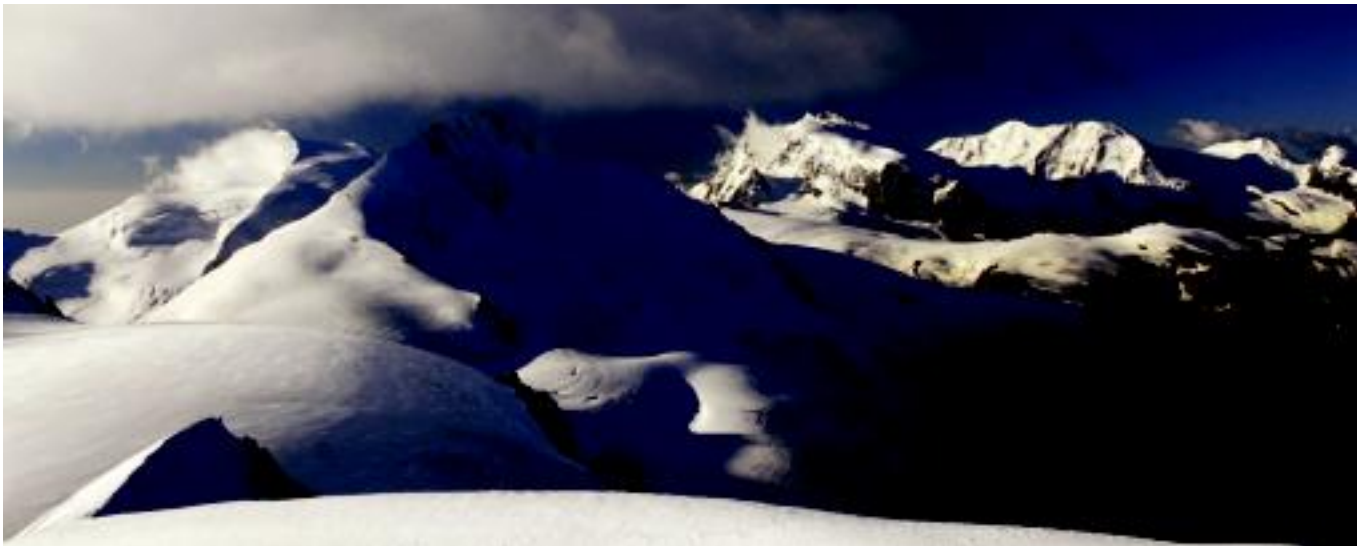
Udan ere Alpeetako gailurrak elurturik izaten dira eta eguzkiak hauekin jolasten du itzalak sortuz. HITZA