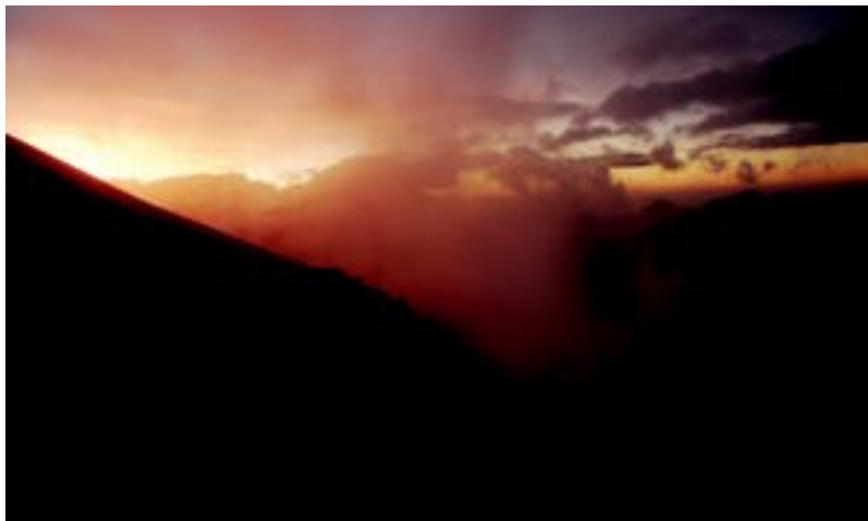
Egunsentiak eta ilunabarrak dira argazkietako protagonistak. HITZA

Denak paisaiak dira. «Guri gustatu zaizkigun argazkiak jarri ditugu», azaltzen dute. Egunsentiak eta ilunabarrak nabarmentzen