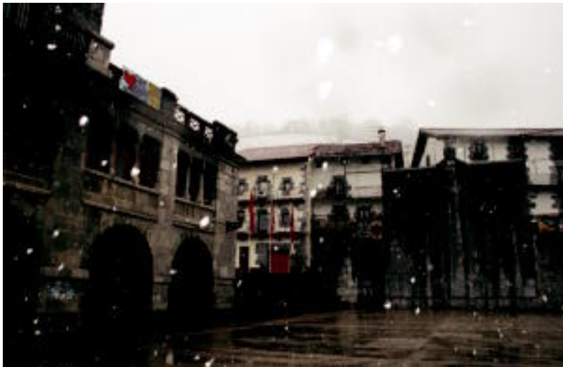
Atzo Leiztan elurra egin zuen berriz, baina ez zen zuritzera iritsi.

Elur malutak lurrera iritsi aurretik bide luzea egiten du eta jasaten dituen tenperaturen arabera, bere itxura modu batekoa edo bestekoa izango da; hezetasuna, 0 gradu inguru eta atmosferan partikula txikiak behar dira.