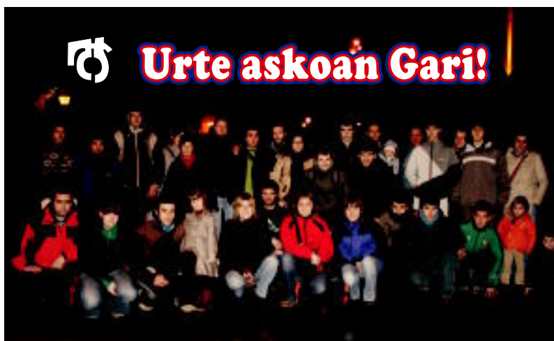
Urte askoan Gari! Jo ta ke, irabazi arte!