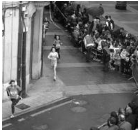
Eguraldiak gehiegi lagundu ez bazuen ere, jende asko hurbildu zen. I.LAHIDALGA