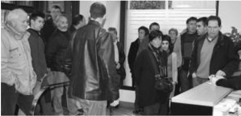
Eskualdeko kirolari, zinegotzi eta alkate ugari hurbildu zen atzo Notaritzara D3Mren alde sinatzera. R. CALVO