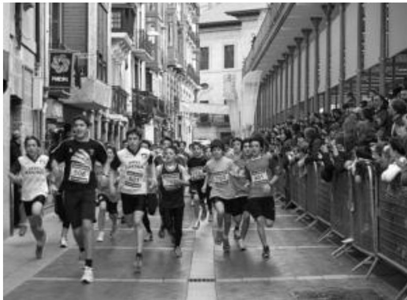
Zerkausitik abiatu ziren korrikalariak eta hiriko kaleak zeharkatu zituzten. IDOIA LAHIDALGA

Proba amaitu ostean Zerkausian elkartu ziren parte-hartzaileak nahiz ikusleak eta sari banake-