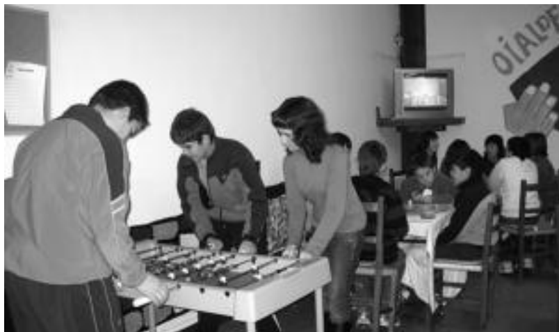
Herenegun ere zabalik egon zen gazte gunea, 16:30etik 19:30era. Gazteak joku ezberdinetan aritu ziren. HITZA

Igandean berriz, Ihoteak hastean, arratsaldez itxita egongo da baina afalorduan aukera berezia egongo da. Plazako musika amaitzen denean, gaztetxoek eurek emandako ogitartekoak bertan jateko aukera edukiko dute 23:00ak bitartean. Astelehenean eta asteartean ere, ordutegi eta helburu berarekin, ateak zabalduko ditu Oialde Txokok.