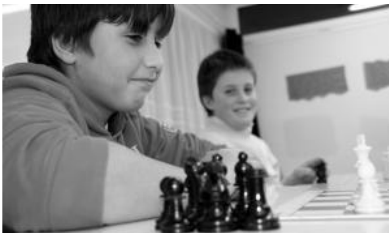
Neska zein mutilak elkartzen dira xakean aritzeko. I. GARCIA

ne bat egin zen xakearen inguruan Gipuzkoa mailan eta 60 joan ziren eta bakarrik hiru neska joan ziren». Txokora azaltzen dira neska batzuk eta Doktoriarenak pixkana-pixkana nahi du gehiagok izena ematea.