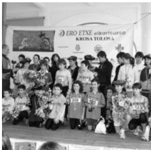
Lasterketa amaitu ostean, Zerkausian egin zuten sari banaketa. I.LAHIDALGA