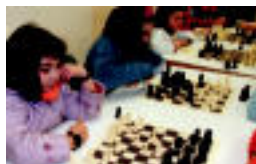
Gazte bat jolasean. I. GARCIA

ORENDAIN San Anton jaien baitan egiten den txapelketan Ikatz txakurrarekin aritu zen 5