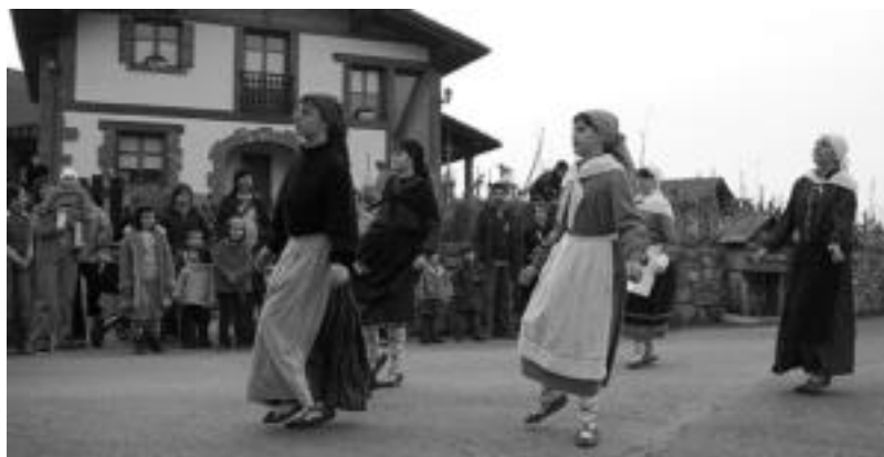
Leaburun arratsaldean, mezaren ondoren dantzariak emanaldia eskaintzen dute jendaurrean. N. URBIZU