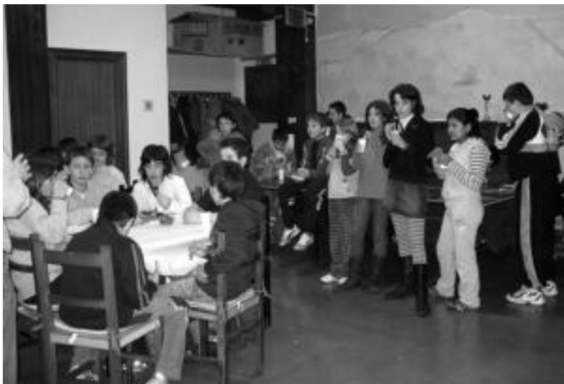
Iragan larunbatean zabaldu zuten berriro ere Oialde Txoko. Txokolate beroa hartu zuten 50 gaztek. HITZA