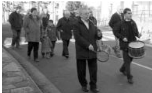
Orendainen, txistularien atzetik joaten da jendea baselizara. ANDER OTEZABAL

Herriko dantzariak, dantzari arropa eta guzti, emanaldi bat eskaintzen dute eta txistularien laguntza izaten dute. Herri sarrerako ermitaren aurrean egiten dute eta ingurua jendez betetzen da. Mezaren ondoren izango da.