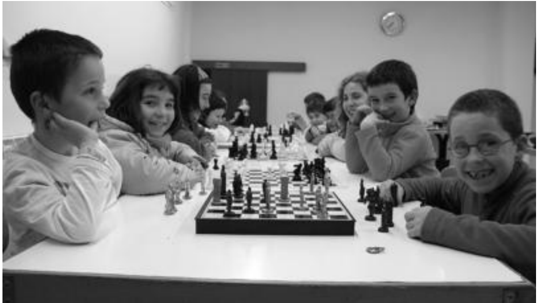
Giro onean aritzen dira adin ezberdinetako haurrak Xake Txokoan. I. GARCIA

Beste helburu bat ere badu Doktoriarenak: «Haur asko daude xakean jolasten dakitenak Anoetan. Orain etortzen ez direnak ere pixkana azaldu daitezela gustatuko litzaziguke». Xakean neska gutxi aritzen direla dio eta hori aldatzea gustatuko litzazioke Txokoaren arduradunari. «Orain bi urte topagu-