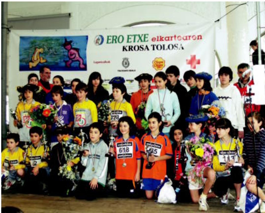
Lasterketa amaitu ostean, irabazle guztiak sari banaketan bildu ziren, Zerkausian. IDOIA LAHIDALGA

TOLOSALDEA Alderdien Legearen aurkakoei sinatzeko gonbita egin diete 6