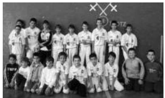
Nafar Jokoein batera Aurrerako pilotariak partidaz partida.