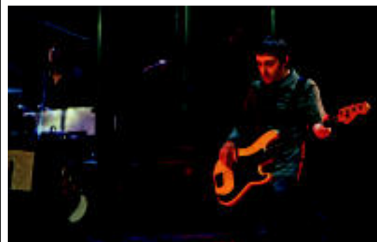
Herenegungo kontzertuaren une bat, Leidorren. KLISK

TOLOSA Laskorain ikastolak antolatzen duen Merkatu Txikia arrakastatsua izan da aurten ere 7