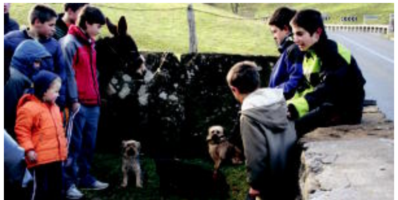
Haur eta gazte asko joan ziren, larunbata izatearekin errazago. Askok txakurrak eraman zituzten. N.U.