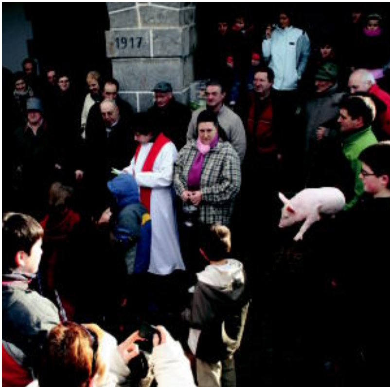
Haur eta gaztetxo asko gerturatu ziren, eta batik bat txakurrak eraman zituzten. N. URBIZU