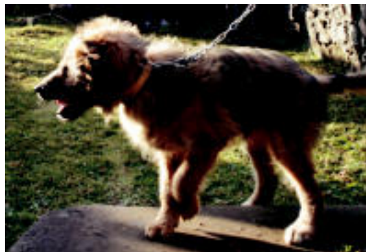
'Lagun'-i kostatu zitzaion bedeinkapenaren zain egotea... N.U.