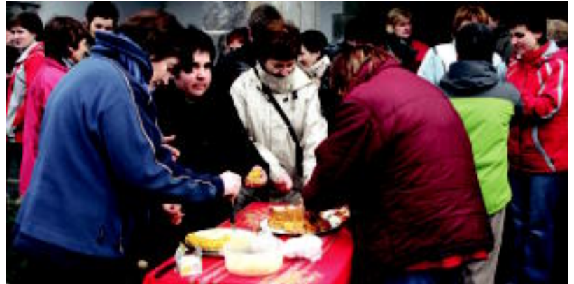
Animaliek bedeinkapena jaso ondoren ohiko hamaiketakoa egin zuten. Askok eskertu zuten. N.U.

Bedeinkapenaren ondoren, hamaiketakoa izan zen kanpoaldean. Fresko egiten zuten, baina eguzki izpi batzuk noizbehinka goxotzen zuten basilizaren aurrealdea. Patata-tortilla izan zen besteen artean, dastatzeko.