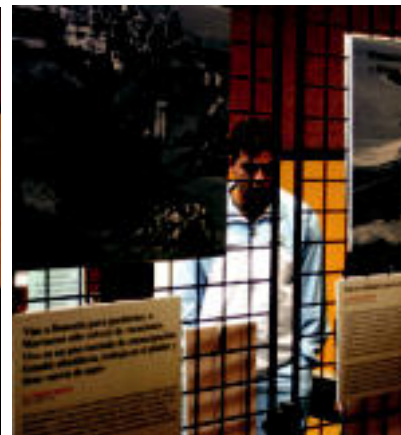
Usurbildik gerturatutako gazteek harretaz begiratu zituzten erakusketan aurkitutako argazki eta bestelakoak. R.CALVO