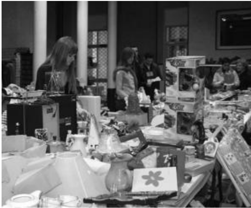
Denetarik izan zen aukeran Merkatu Txikian; herritarren erantzuna «oso ona» izan dela gorai patu dute. ESTI EZEIZA

Ildo honetan, «egoera horiek leuntzeko eskuera dugun aukera eta herritarren artean zabaldu nahi dugun konpromisoa ezagutzera eman» dutela diote Laskorain ikastolakoek. «Ziur gaude eki-