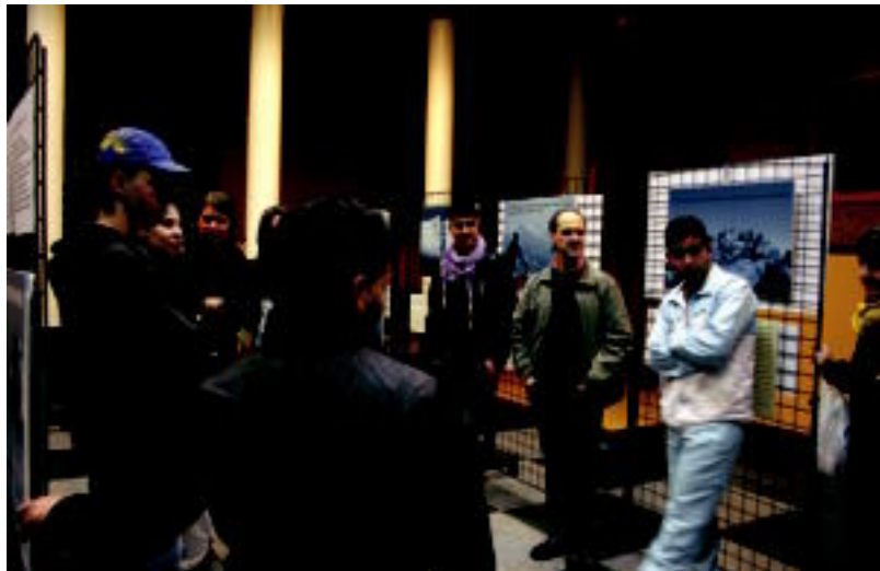
Erakusketa ikusi eta gero han zeuden guztiak bildu eta solasaldia izan zen Kultur Etxean. R.CALVO

Lau gazte hauek lanerako gogotsu daudela agertu zuten, egoera latza izan arren, hona lanera etorri direla argitu zuten eta batez ere hauxe aldarrikatu nahi izan zuten: «Gure artean, hemengo jendearen artean bezala, aldeak daude. Denak ez gara berdinak. Aukera bat merezi dugula uste dugu».