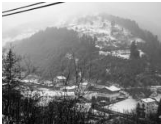
Elur ugari bota zuen eskualdean, pasa den astean. ESTI EZEIZA

Euskaltelek eta Vodafonek antena berdinak erabiltzen dituzte eta enpresa hauetako bezeroek arreta zenbakietara deitzen dutenean hitz egokiak jasotzen dituzten arren, arazoak konpontzeke jarraitzen du. Badirudi erantzunaren premiak eta konpaini hauek Bidanien duten bezero kopuruak erlazio zuzena dutela. Eta hau guztia aurrera omen doan herri baten gertatzen da, hori dioen gobernuak kudeatzen duen enpresa baten ardurapean.