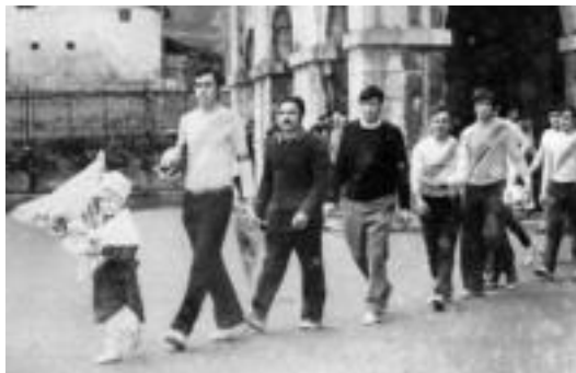
Txapelketa asko antolatu izan ditu elkarteak.