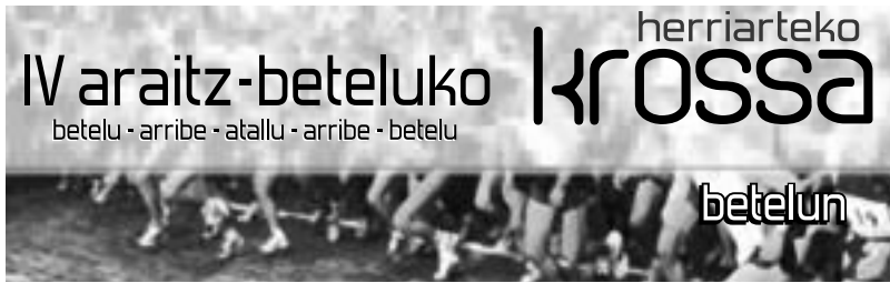
Urtarrilaren 18an, igandean, Herriarteko Krossa lehiatuko da Betelu eta Atallu artean. HITZA