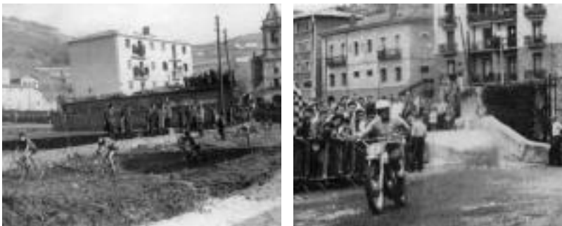
Garai bateko argazki ugari biltzen dira Kirol Elkarteak kaleratutako liburuan. IBARRAKO KIROL ELKARTEA