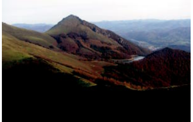
Aizkardiakoek Ezkurratik Sunbillara irteera antolatu dute. HITZA

Irteera 08:00etan izango da, Asteasuko udaletxea aurrean. Esan bezala, itzulera bazkaltzeko orduan helduko dira.