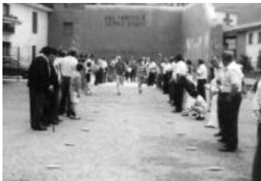
Jende asko biltzen zen antolatutako ekintzetan. IBARRAKO KIROL ELKARTEA

kiak urtez urte sailkatuak azaltzen dira». Horiek horrela, liburua bitan zatitu dute Iglesiasek esandakoaren arabera: «Batetik, akta liburuen bileretako laburpen txikiak eta argazki bilduma, bestetik. Pertsonaia desberdin asko ikusi daitezke bertan, aurreneko urteetan egiten ziren zirklokrosa edo motokrosa lasterketan parte hartutakoak, bazkideen arteko festak, lasterketa desberdinak...».