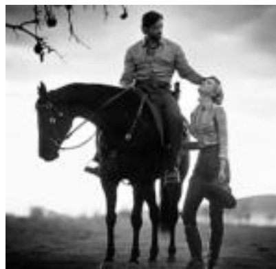
Asteburu honetan, Australia filma ikusteko aukera izango da, baita Atila y los Unos entzuteko ere. SINADURA

■ Urtarrilak 31, larunbata. 17:00etan, Una amistad inolvidable lana ikusgai izango da. 19:30ean, El intercambio eta 22:30ean, La ola .