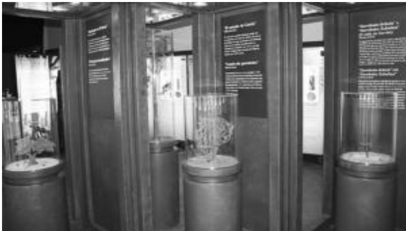
Inguruan ditugun baso mota desberdinak zein diren eta ze ezaugarri dituzten ikus daiteke erakusketan. I.T.

Hilaren 18ra arte egongo da Aranburu jauregian dagoen 'Basoa' erakusketa bisitatzeko aukera; basoek duten ondarea eta garrantzia ezagutaraztea eta hauen inguruan herritarrak sentsibilizatzea da bere helburua.