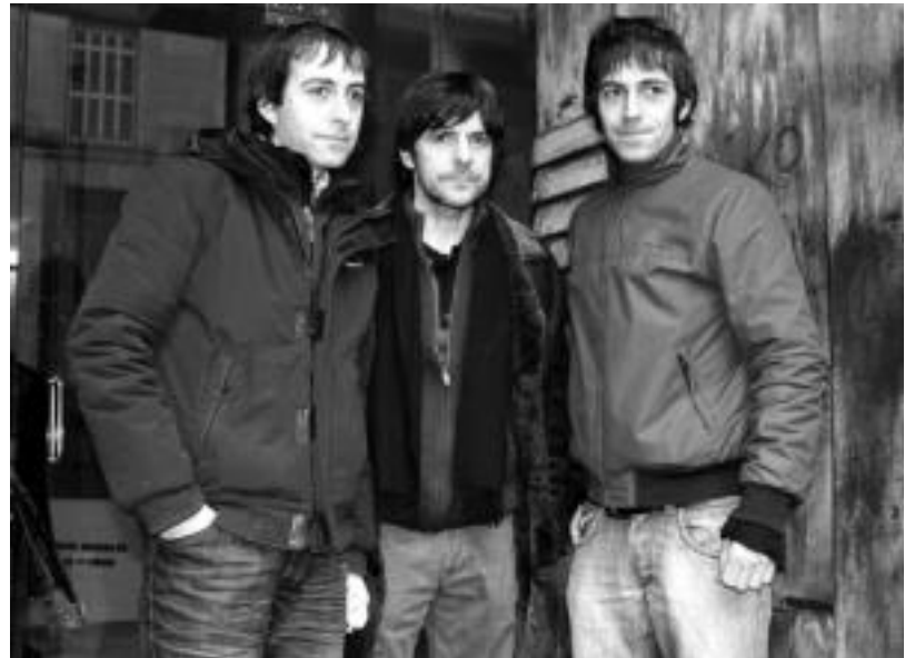
Tolosako Bide Ertzean taldeak kontzertua emango du Leidorren, hilaren 16an, zuzeneko diskoa eta DVDa grabatuz. R.C.

■ 'Geureak ere badira edingabe horiek'. Bakarrik dauden adin txi-