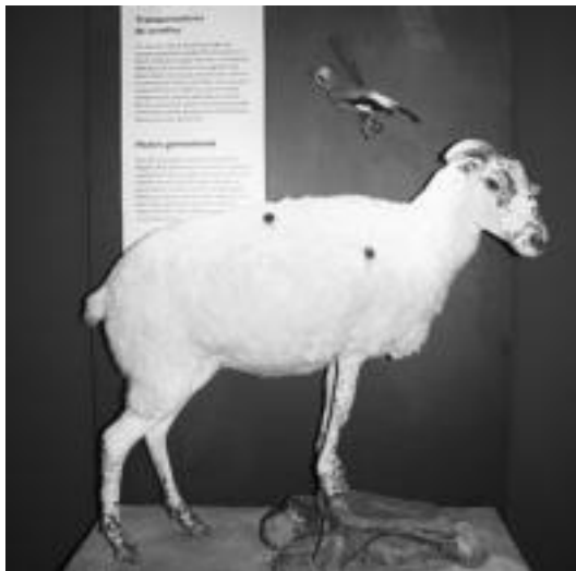
Animaliak hazien garraiolariek direla ikas daitezke. I.T.

Bada, beraz, zer ikasi eta ikusia Aranburun dagoen erakusketan, hain gertukoak zaizkigun basoen inguruan.