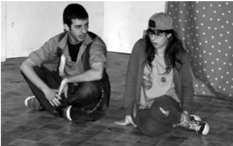
'Magia teilatuetan' umeentzako antzerki saioko une bat. IMANOL GARCIA