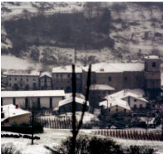
Albizturren egun osoan zehar egin zuen elurra; herria zuri-zuri zegoen. E. EZEIZA

Ohi bezala, fenomeno meteorologikoak bi aurpegi izan zituen; baretik, gure kale eta mendietan utzitako paisaia ederrak eta, bestetik, trafiko arazoak. Elurra kentzeko makinek gogor egin behar izan zuten lana gurean, errepide nagusietan eta bigarren mailakoetan, elurra kentzeko.