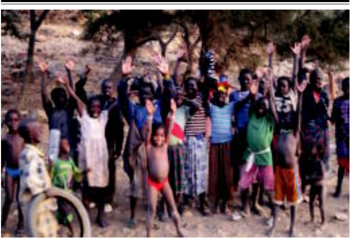
Hainbat lekutat jasotzen zuten afrikarren berotasuna eta kulturalkatea ere. Argazkian, Maliko hainbat lagunek agur egiten furgonetarekin aurrera egiten zutela.