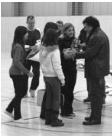
Finalak amaituta sari banaketa egin zuten. Nekati Realeko jokalaria ere izan zen bertan. A. IMAZ

Lau mailetako finalak izan ziren ikusgai. Alebin nesketan, Oiarzabal (Tolosa) taldea izan zen txapelduna, Margok (Tolosa) taldeari 1-3 irabazi ostean; alebin mutiletan,