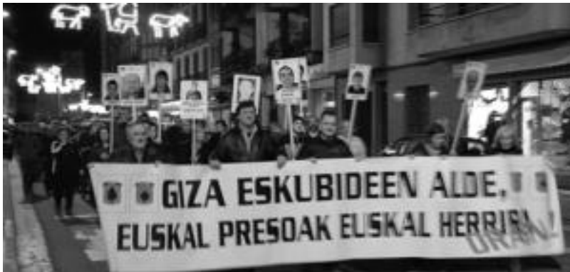
Jende asko bildu zen Villabonan giza eskubideen alde agertzeko. HITZA

Villabona » Aiztondoko bost udalek giza eskubideak bermatzearen aldeko mozioa onartu eta manifestazioa egin zuten.