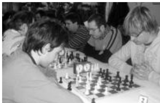
Pasa den igandeko txapelketaren une bat. HITZA

Aurtengo txapelketan 64 taldek hartu dute parte denera.