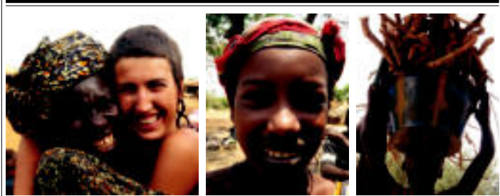
Eskeerko argazkian, senegaldar emakume bat eta Onditza Jauregi besarkatzen. Erdiko argazkian ginear bat eta eskuibako mallara.

Bidaiari buruz hitz egiten ezta-ten zaien, ikusten da bidaiari auzar dize ekin zirela, abentura bila. Gero, bidaiak orokulu zirela, bihotzak ireki. Eta bidai horrek emandako betirako gordeko du-tela beraienkin.