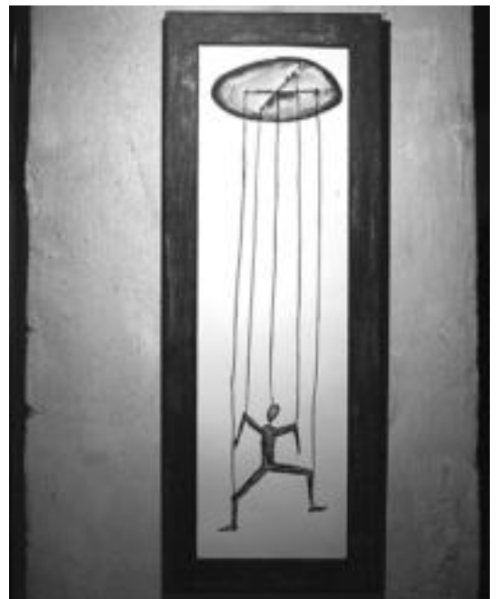
Galeria honetan Tolosan berriak diren proposamenak ikus daitezke. HITZA

2009 urte onuragarria izan daiteke galeria honentzat. Erakusketetako egutegia beteta edukitzeaz gain, GKO honetan banaketa egongo da, nahiz eta guztiak toki berean jarraituko duen. Alde batetik GKO denda egongo da eta bestetik GKO espazioa. Baina proiektu eta ideia hauek guztiak ezingo dira garatu jendearen partaidetzarik gabe. Hori dela eta, espazioko arduradunek herriko biztanle guztiei bertatik pasatzeko gonbidapena luzatzen diete, arte urbanoa ezagutzen hasteko eta Tolosako kultura zabaltzen jarraitzeko.