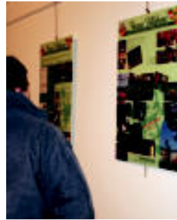
Erakusketa panelez osatuta zegoen eta hainbat gai jorratzen zituen.