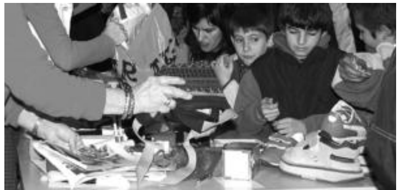
Aurreko urteetan bezala, jende ugari pasako da Kultur Etxean kokaturiko Merkatu Txikitik. E. EZEBIZA

Bestetik, arazo psikiko eta fisiokoak dituzten Sahararako haurrentzako Auserd-en dagoen eskolari emango diete laguntza jasotako di-