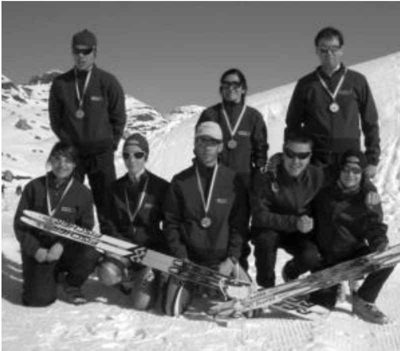
Alpino Uzturre elkarteko eski taldea aurreko denboraldi batean.