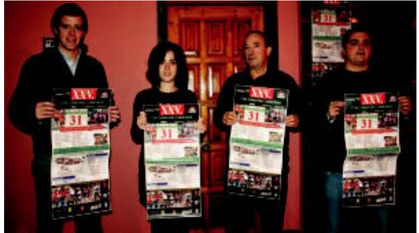
Urte Zaharreko krosa antolatzen duten Zunbeltz eta Urkamendi elkarteak. I. GARCIA

Aurtengo abian jarri dute beste ekimen bat krosaren webgune berezia da eta bere helbidea www.picasaweb.google.es/urtezaharkrosa .