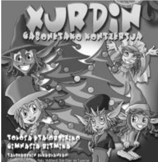
Xurdin, ohiko lagun ez gain, lagun berriekin etorriko da Gabonetan. HITZA

Xurdinen Gabonetako kontzertua hilaren 27an eta 29an ikusteko