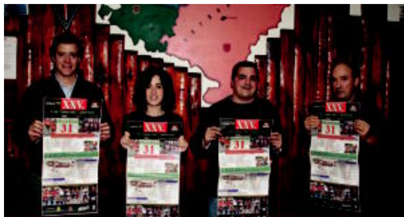
Villabonako Zunbeltz eta Zizurkilgo Urkamendi elkarteko kideak, atzo.

TOLOSA EITBk antolaturiko elkartasun maratoiaren baitan, Bilboko itsasadarrean 24 orduz egin zuen igeri 2