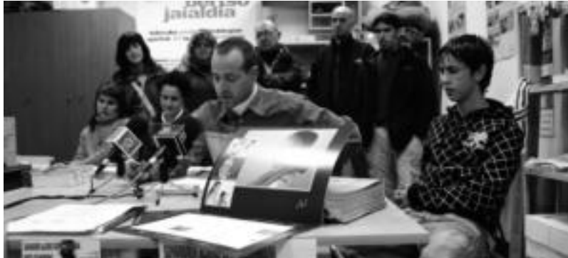
Tolosaldea Sahararekin elkarteak kideak Piztu itxaropena kanpainaren aurkezpena egiten. I. T.

Hauek uzteko lekuak ohikoak izango dira: herri gehienetako udaletxeetan; eskoletan; Tolosako Eroski, Consumer eta BM supermerkatuetan; Merkatu txikiak irauten duen denboran Tolosako Kultur Etxean eta urtarrilaren 10ean eta 24ean, 11:00etatik