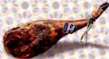
Guijueloko beso Iberikoa