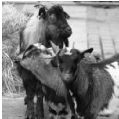
Oreinak beharrean, aurten antxumeak izan dira. E. EZEIZA