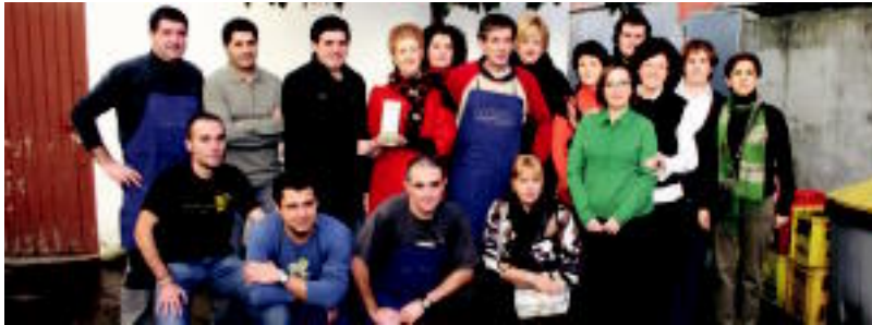
Irrintzi Elkarteak kideak, udal ordetzaria eta Hutsunea Betez taldeko urteko billabonatarrak.

Villabona » Irrintzi Elkarteak urtero herriko talde edo pertsonaia bat sarituko du Irrintzi Saria emanaz.