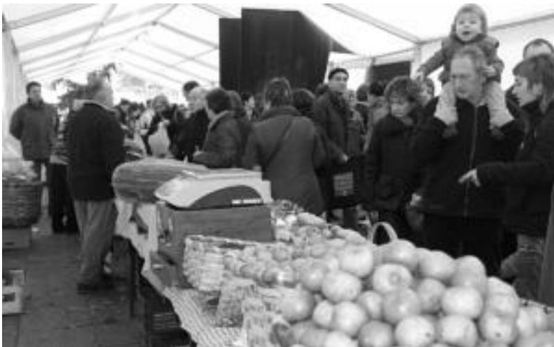
Triangulo plazan, garaioko fruitu eta barazki eskaintza zabala aurki zitekeen. E. EZEIZA