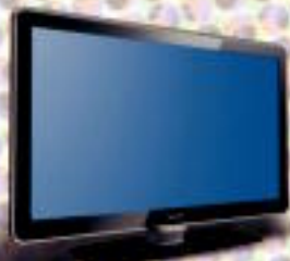
Philips LCD TDT 26" telebista

Ordaindu kutxa ren zure kreditu-txartelekin eta zure oparia hementxe ikusiko duzu: www.kutxa.net .