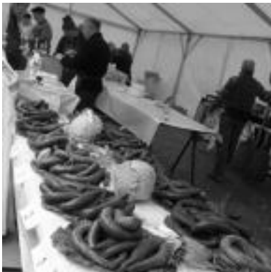
Azokaren baitan, Odolki Lehiaketa izan zen. E. EZEIZA