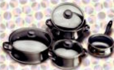
MAGEFESA sukaldeko tresneria