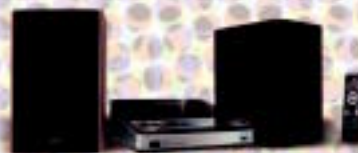
Philips mikrokatea, MP3 eta USBrekin