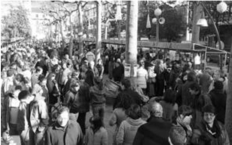
Eguraldia lagun zela, jende ugari hurbildu zen atzo goizean Tolosara, azoka berezia ikustera. E. EZEIZA