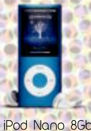
iPod Nano 8Gb