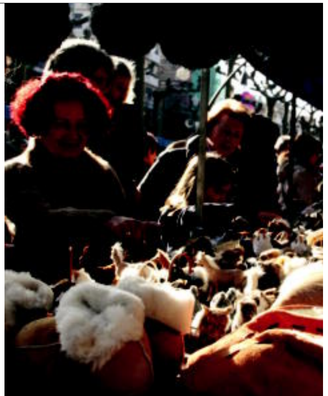
Jendetza izan zen goiz osoan zehar, produktuak ikusten, dastatzen eta erosten. Animaliak, jakiak, erropa... denetarik izan zen postuetan. ESTI EZEIZA