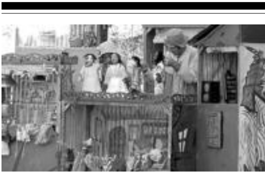
Txotxongiloak ikuskizunaren parte garrantzitsua izango dira. HITZA