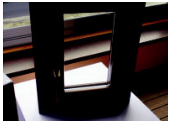
Energiaren Euskal Erakundeak gehienez, 1.650 eurokoak izango dira. R. CALVO

Bukatzeo, Zuhaizki zurdindegiko zuzendariak diru laguntza hauek ez direla etxebizitzetara mugatzen aipatu du, «komertzio, denda, taberna, hotel edo beste edozein eraikuntza moteetara ere zabaldu daiteke eta», gaineratu du.