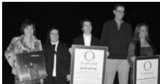
Laskoraino, Hirukideko eta Inmakuladako zuzendariak, herenegun.

Atzokoekin, Tolosari dagokionez, lau ikastetxeek dute, hau da, atzo saria jaso zutenek eta Tolosaldea Lanbide Heziketa Institutuak, zilarrezko Qa baitu. Eskualdean, berriz, beste bi ikastetxeek dute zilarrezkoa, Ibarraoak eta Anoeta-Irurakoak, alegia. EAE mailan, 207 erakundek dute zilarrezko Qa eta 48k urrezkoa.