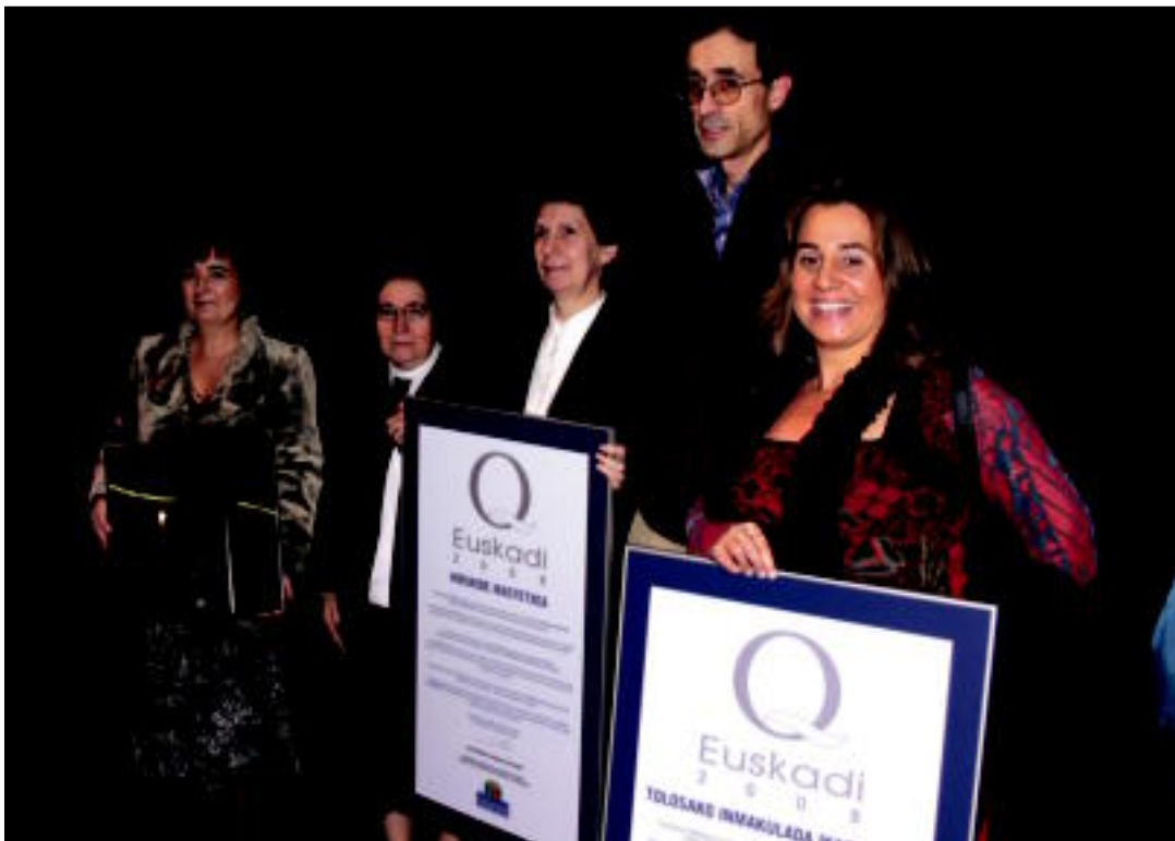
Laskorain, Hirukide eta Inmakuladako zuzendariak, herenegun, ziurtagiriak jaso ondoren.