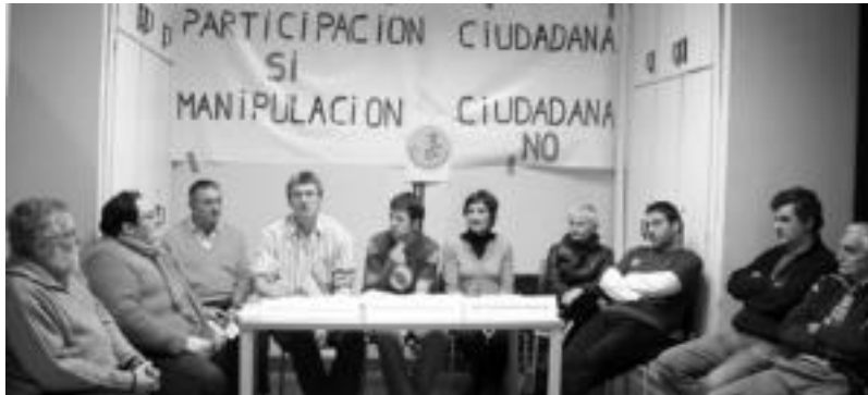
Zahartzaro Duinaren Aldeko plataformako kideek agerraldia egin zuten herenegun, World Kafeaz hitz egiteko.

Zahartzaro Duinakoe behin baino gehiagotan salatu dute, Udalak parte-hartzea ukatu diela, eta oraingoan ere gauza bera adierazi