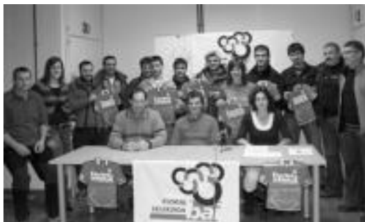
Eskualdeko hainbat kirolari elkartu ziren herenegun, babesa eskaintzeko. E. E

Herenegun egindako agerraldian, Euskadiko Futbol Federazioari Euskal Herriko selekzioak na-