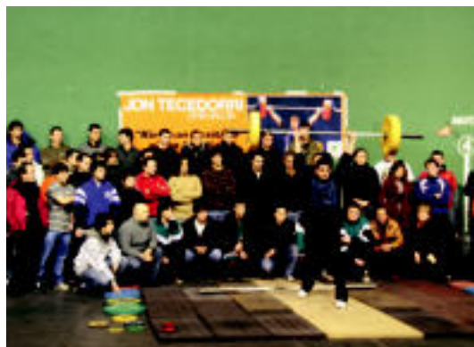
Jon Tecedor gogoan izan zuten Danena-Olaederrako pultsulariek. R. CALVO

TOLOSALDEA Anoetan eta Zizurkilen azken eguna izango dute gaurkoan; Ibarra, berriz, aste osoan izango dira ekitaldiak kirolaren inguruan 6