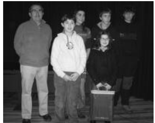
Saridunak, tartean Navararren aita, pozik agertu ziren sari banaketan.

Partida eta gero bi jokalariek, lagun eta senitartekoekin batera, Tolosako Usabal sagardotegian afaldu zuten.