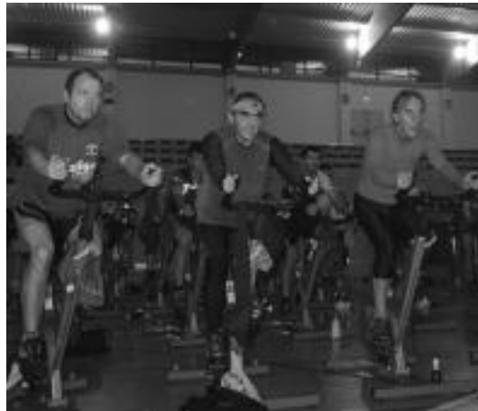
Zigonezko eta emakumezko ugari hartu zuten parte Anoetako maratonia. N.L.