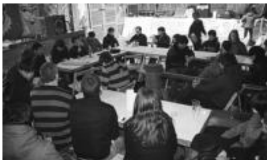
Alegiako Gaztetxean, bazkaldu ondorengo herriko bertsolarien saioan. n. u.

AHTren aurkako manifestazioa ere antolatu zuten atzo iluntzean, eta 40 bat herritar bildu ziren. Bestalde, zozketa bat egin zuten Alegiako AHTren aurkako taldeak eta 15 zenbakia izan da saritua.