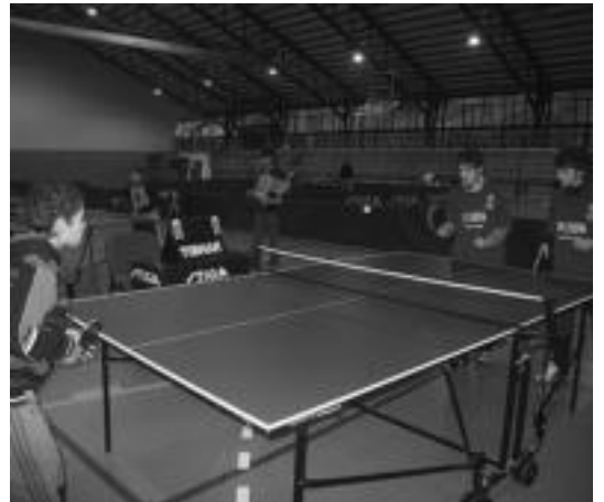
Mahai tenis ikastarotxo egin zuten atzo arratsaldean Ibarra. R. CALVO

Kirol Asteari Anoetan, familian gozatzeko ekitaldi batekin. Izan ere, haur eta heduak batuko dituen ginkana jolas berezia egingo dute gaurgoizean. Herriko familientzat igandea igarotzeko plan egokia, ez bairik gabe.