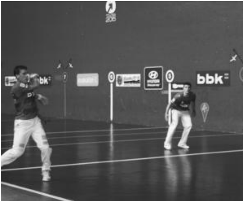
Lehia handiko partida izan zen atzo, Tolosako Beotibar frontoian Olaetxeak eta Mendizabalek egin zutena. R.CALVO