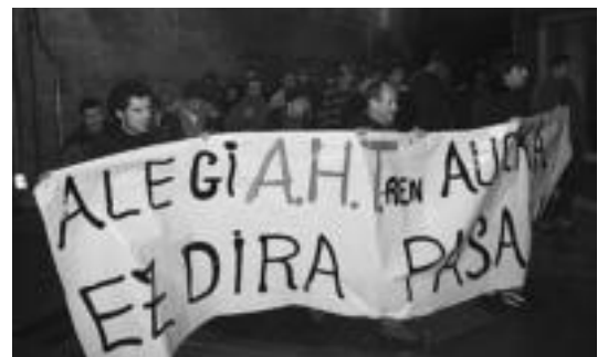
40 bat lagun bildu ziren AHTren aurkako manifestazioan. n. u.

Zahagi ardoa prestatu zuten Gaztetxean, gero izango ziren kontzertuetarako egun osoan izandako giro horri eusteko. Hesian eta Disorders taldeak izan ziren gauean. Bi taldeak ere, arduratuko ziren horretaz.