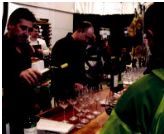
Bazkaldu aurretik jendeak ardoa dastatu zuen. NEREA URBIZU