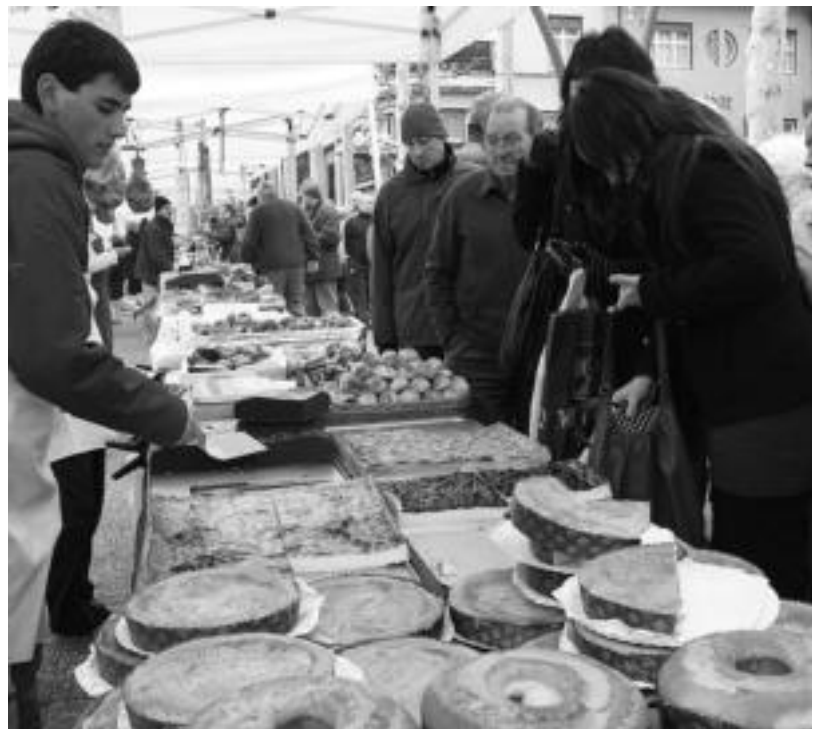
Urtero bezala, Azoka Berezia izango da abenduan, hilaren 20an, hain zuzen ere. NEREA URBIZU

Ikusiko dugu. Handik aterata naizenez, urte batzuk pasa beharko ditut kanpoan, baina gogo handia daukat berriz bueltatzeko.