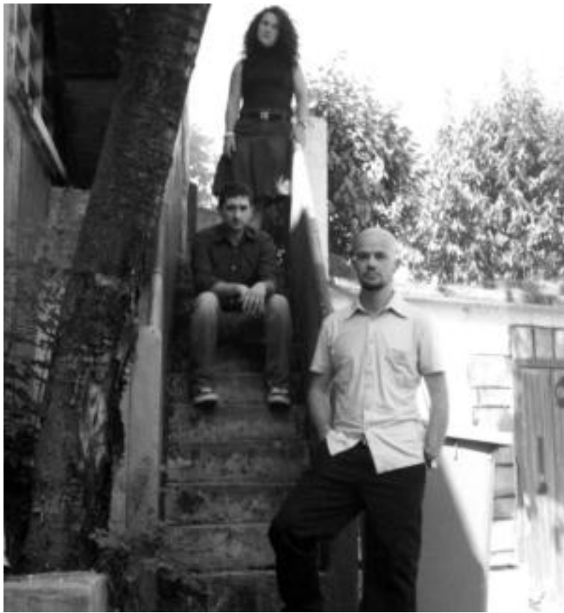
Humus talde tolosarreko kideak.

Bai, argi eta garbi. Aurreko diskoetan beste gauza batzuen bila joaten ginen. Gauza teknikoek gehiago arduratzen ginen. Oraingo honetan berriz, hori guztia alde batera utzi dugu eta gauza indartsu, sasoi-koa eta zuzen bat egiten ahalegindu gara. Eta egia esan, gustura gaude atera zaigunarekin. Besteak, agian, metal deitzen den rock mota ho-