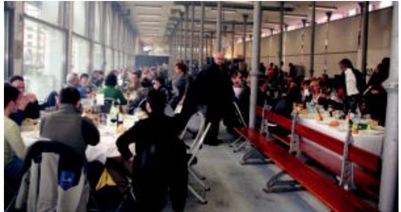
Ateak zabaldu orduko jende andana bildu zen Zerkausiko jatetxearen sarreran txuleta jateko gogoz. ASIER IMAZ

Beotibar pilotalekuan II. Txuleta Erronka jokatu zen atzokoan. Bertan, Titin III-Zubieta eta Bengoetxea VI-Beloki aritu ziren lanean. Leitzarrak eta burlatarrak 22-14 irabazi zuten partida, ondorioz, txuleta zinta bat irabazi zuten. Partida ostean jaso zuten saria pilotariarik.