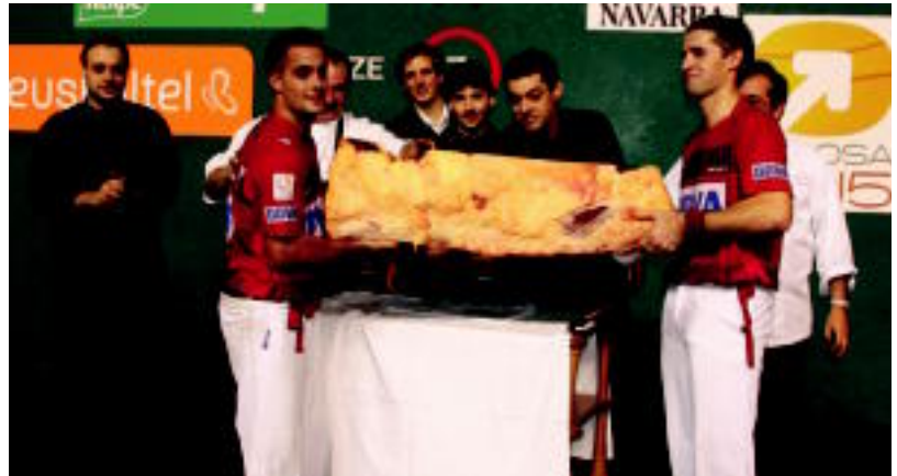
II. Txuleta Erronka Oinatz Bengoetxeak eta Ruben Belokik irabazi zuten Titin III-Zubietaen aurka 22-14. ASIER IMAZ