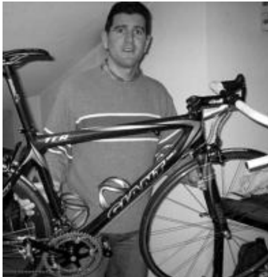
Abraham Olano txirringularitzaren inguruko mahai-inguruan egongo da.

rean eta spinning maratonean parte hartzeko izena alde aurretik eman behar dela ere esan dute, hilaren 11 baino lehen, zehazki. Kiroldegira jo behar da horretarako.