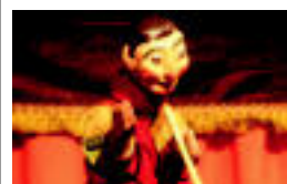
'Rutinas' saioa, Kasinoan. I.T.

TOLOSA Herenegun egin zuten lehenengo saioa; 17 kidek osatuko dute 7