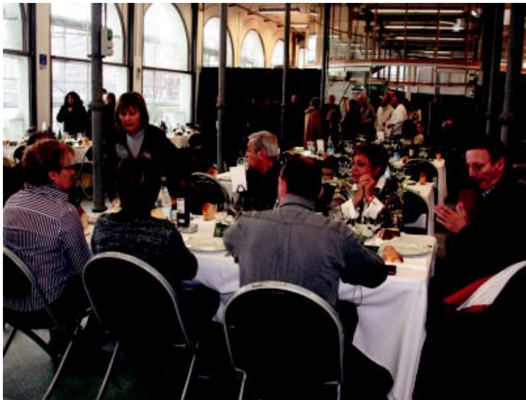
Jende ugari izan zen atzo bazkaltzen Zerkausian; egun guztietarako beterik dagoela azaldu dute antolatzaileek. A. IMAZ