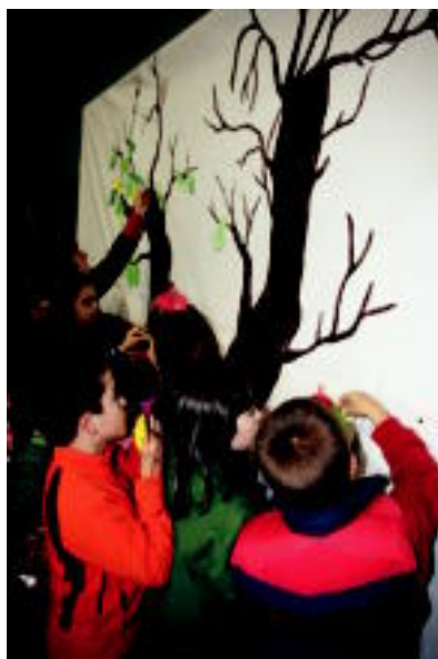
Ezkerrean, ikaztegietan, taloak egiten, eta eskuinean Asteasun, euskararen zuhaitza osatzen, atzo. I.GARCIA