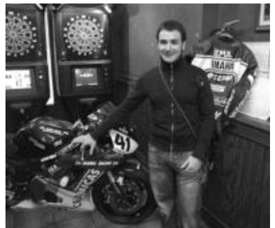
Ibarra Racingeko Koldo Alonsoren materiala ere izango da ikusgai. I.TERRADILLOS

Ibarako Belabieta kiroldegian aterekin astea antolatuko dute Kirol Astearen barruan. Ekintza ugarietan parte hartzeko parada izango da hilaren 13tik 21era. Bestalde, Belabietako arduradunek kiroldegian baja emateko zenbait argibide eman dituzte: kiroldegian baja eman nahi dutenek hileko lehen bi asteetan egin beharko dutela eta urte bukaeran abonamendu txartela entregatu beharko dutela.