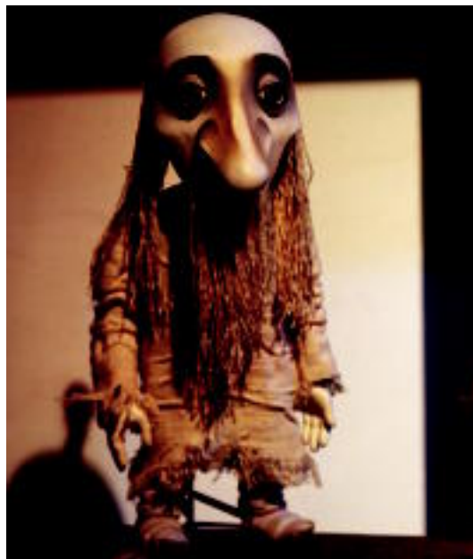
Voronezh konpainiaren txotxongiloetako bat Aranburu jauregian. I.T.