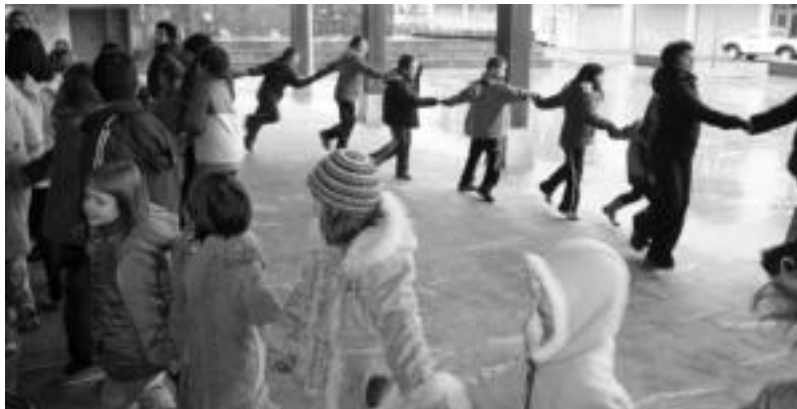
Ikaztegieta dantzan aritu ziren haurrak elizaren arkupeetan.