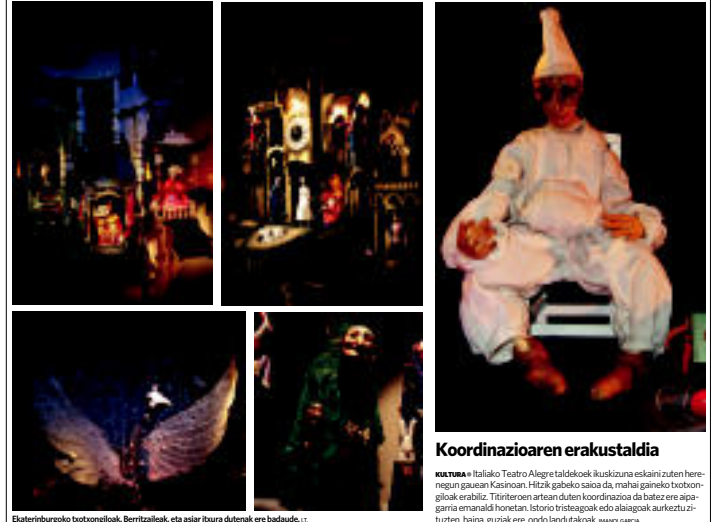
Ekaterinburgoko txotxongiloak. Berritakoak, eta esiar itzura dutenak ere badaude...