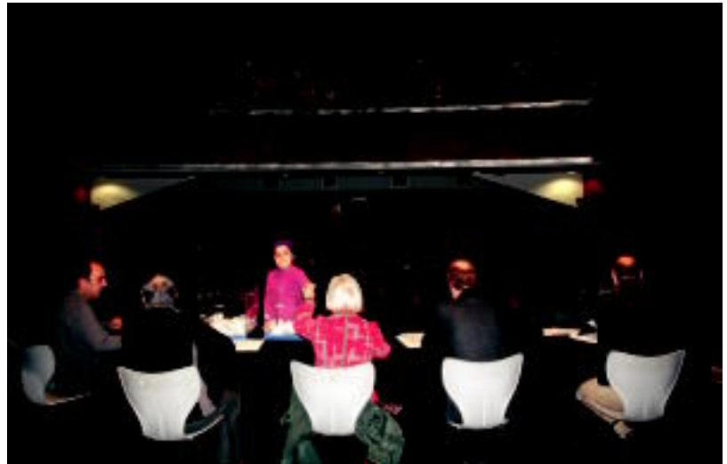
Haur batek atera zituen kutxetatik papertxoak, jendearen ikusminaren aurrean. I. GARCIA

Etxebizitzaren inguruko ezaugarriak ere zehaztu dituzte. Hain zuzen, egun Loatzoko musika eskola dagoen eraikinaren ondokoak izango dira eta Kale Nagusira begiratzeko dute. Eraikiko diren etxebizitzetatik zazpi 3 gela eta 2 bainugela izango dituzte; berrogeik, 2