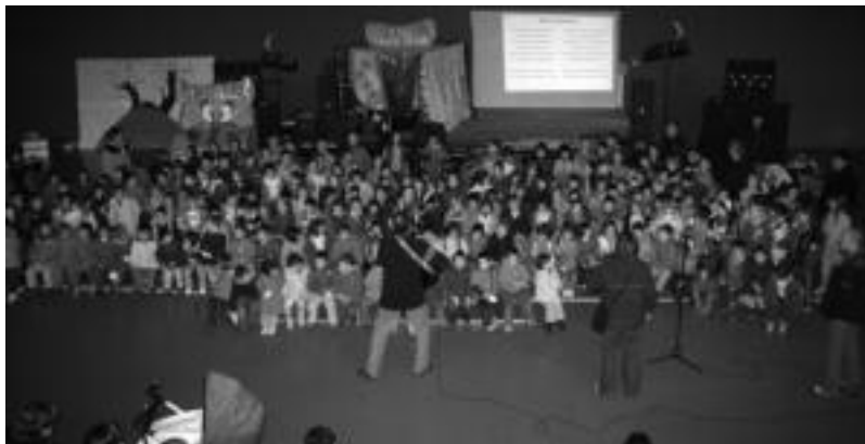
Asteasuko frontoian Pello Errotako ikasleak kantuan aritu ziren. I. GARCIA