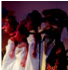
Voronezh konpainiaren txotxongiloak. Berritako eskioari dagokionez. Umorea nahiz beldura jorratzen dutenak ikus ditzakegu...