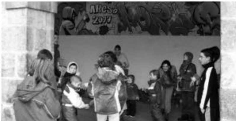
Areson haurrentzako jolasak egin zituzten atzo goizean. A. IMAZ

Tolosaldeko eta Leitzaldeko hainbat ikastetxeetan ere ekitaldiak antolatu zituzten euskararen inguruan.