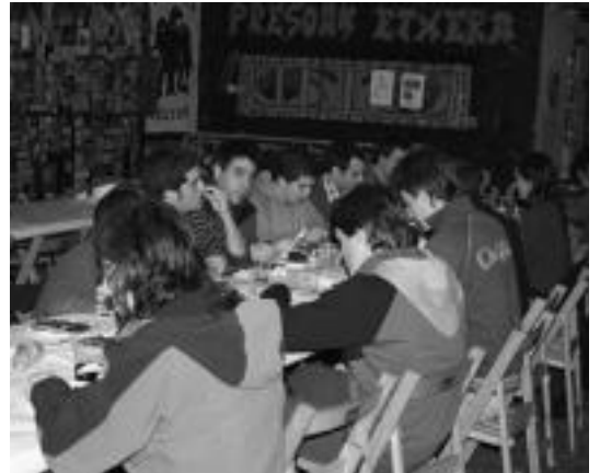
laz babarrun-jatea ere egin zuten Gaztetxearen. ASIER IMAZ