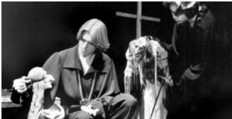
Obraztsob-en onena izeneko antzezlanaren ikusgai izango da gaur iluntzeko zortzietan. HITZA

Urtez urte ikuslegoaren arreta erakartzea zaila da, baina helburu hori lortzeko asmoz, egitaraua berritzen saiatzen dira Tolosako Ekinbide Etxekoak. Halaber, aurtun, lehendabiziko aldiz erakusketak berezi bat ikusgai izango da Leidorreko sarreran. Bilduma honek jaialdian estreinatuko den Lorezaina antzezlanaren eszenografia sortzeko jarraitu den prozesua azaltzen du. Erakusketaren azalpena emanaldia hasteko prest da-