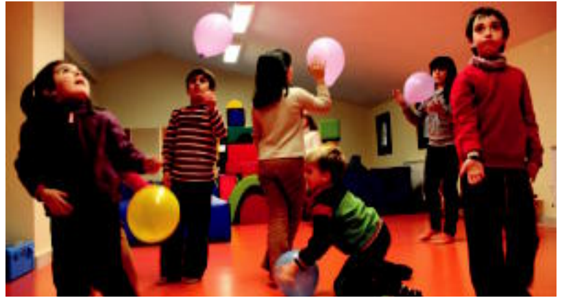
Albizturko antzerki ikasleak, hasierako beroketako ariketak eta jokuak egiten. N. URBIZU

Baina gauzak ez dira esatea bezain errazak. Ikasleek oztopo batzuk ere baiduzte klasea joateko orduan: lotsa. Kasu batzuetan haur batzuk amarekin gelditu izan dira klasean, eta gutxinaka askatzen joaten dira, autonomia hori