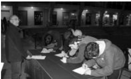
Hainbat lagunek sinatu zuten atzo manifestua. I. GARCIA