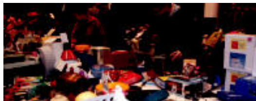
laz ere material ugari jarri zuten salgai. E. EZEIZA

Elkartasuna » Hainbat bide baliatu dituzte horretarako; datorren astean Tolosako dendetara joango dira.