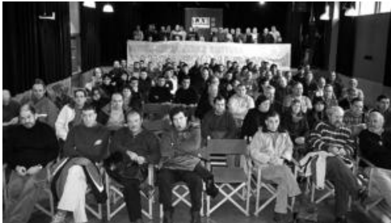
Tolosaldeko eta Goierriko LAB sindikatuko ordezkariak Zaldibian herenegun burututako batzarrean. ARKAITZ APALATEGI

LABek plazaratutako irakurketan ondorengo gaiak aztertzen dituzte: langileen egoera; erantzule politiko eta ekonomikoak eta egoera aldatzeko aukera.