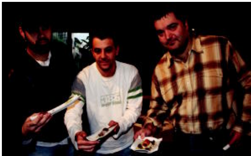
Pintxo lehiaketako irabazleak, euren lana eskuan dutela, atzo eginiko agerraldian. IÑIGO TERRADILLOS

BEREZIA «Aldi baten amaiera adieraziko du aurtengoak, To.Pic gabeko azken jaialdia izango baita», azaldu dute >3