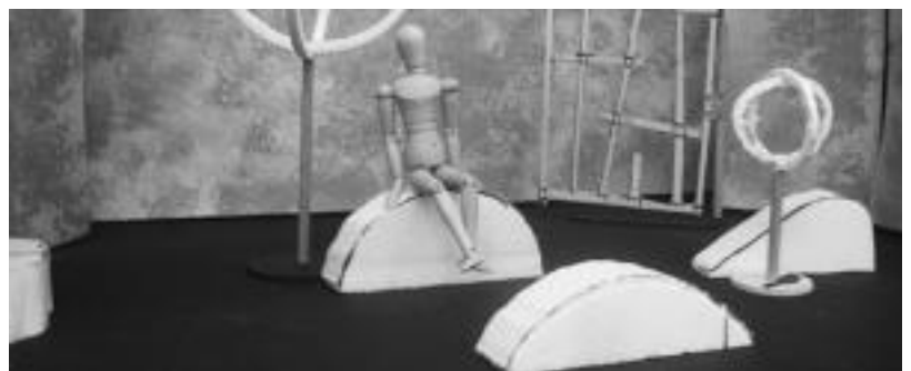
Atzo aurkeztu zuten jaialdia, Donostian; Madrigo Teatro de la Lunak bere azken lana estreinatuko du. EZEIZA/HITZA

ronetz, Nazioko Antzerkia eta Yekaterinburgoko Antzerki Nazionaletik datozen funtsekin erakusketazabal eta adierazgarri batean izango du.