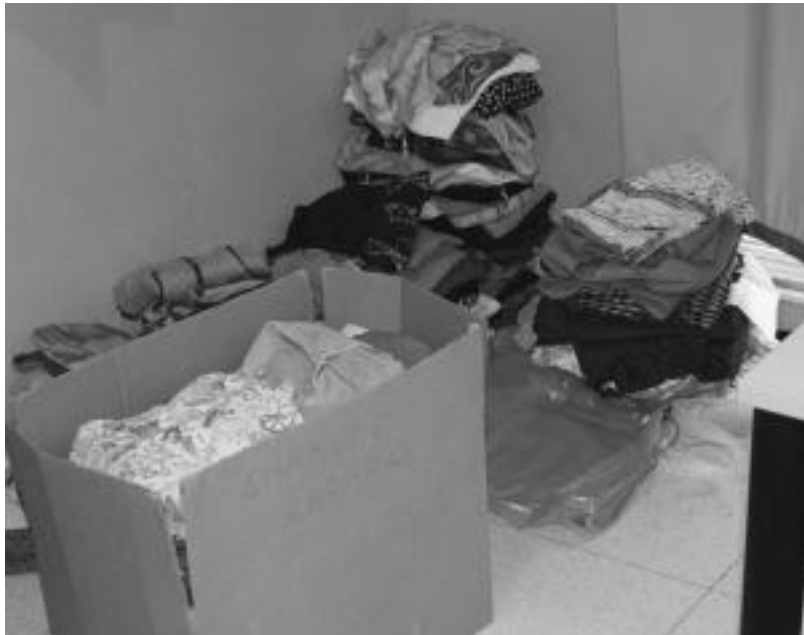
Kultur Etxean herritarrek utzitako material guztia txukuntzen aritu ziren. Irudian, arropak. N. U.

11:00etan irekiko dute azoka eta eguraldiari begira egongo dira. Hasiera batean plazan izango da baina eguraldi txarra eginez gero,