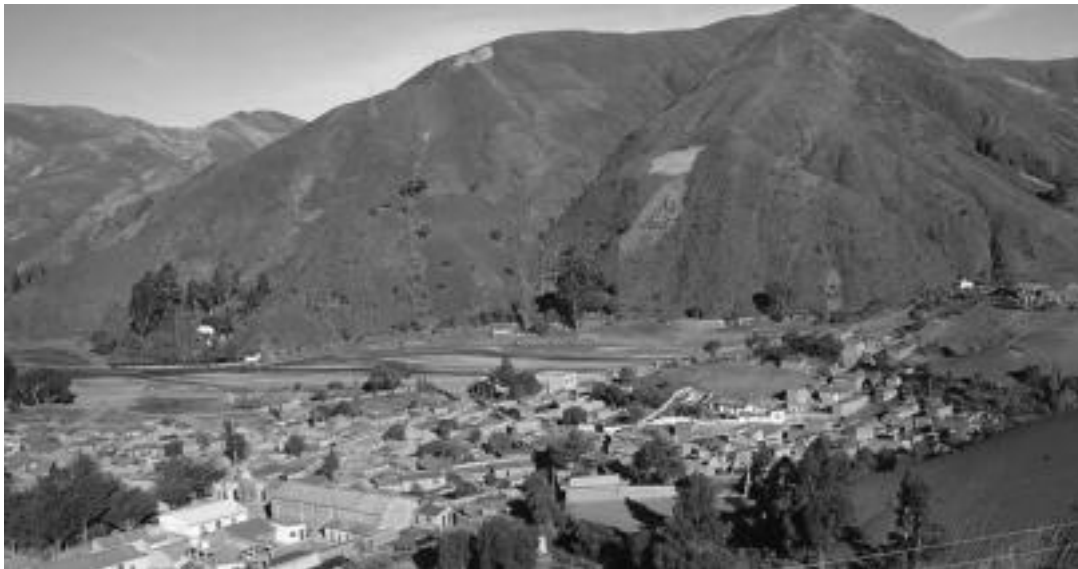
Caripuyo herrikoak dira lagunduko dituzten ipar potosiar indigenak. Herria nekazal eskoletatik oso urrun daude. HITZA

Bihar Alegian Bigarren eskuko I. Azoka antolatu du Kultur Batzordeak; ateratako dirua Boliviako Ipar Potosiko lurralde txiro batera bidaliko dute bertako ikasleei laguntzeko.