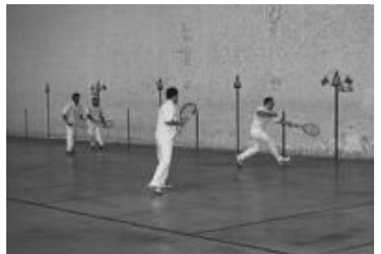
Iazko txapelketan hartutako irudia. I.GARCIA

Partidak datorren asteburuan, hilaren 29 eta 30an hasiko dira eta abenduan, 6, 7, 8, 13, 14 eta 20 egunetan, izango dira gainontzeko partidak. Finala berriz abenduaren 21ean izango da.