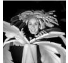
Kultura anitz uztartzen ditu lanak. HITZA

Bikoteak, hala ere, azkenean alde egitea lortzen du eta munduan zehar ibiltzea joaten dira osaba Mattek bidalitako gutunek bultzaturik. Bisitatzen duten herrialde bakoitzean hitz magiko bat bilduko dute. Hitz horiek oso baliagarriak izango zaizkie bidaiaren bukaeran.