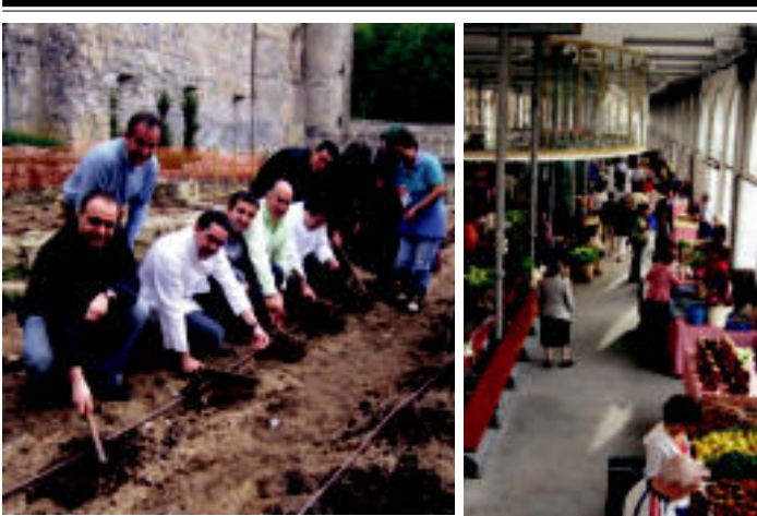
Pasa den maiatzean erandako lurrak, biltzatzen dituzte; ondoren Zerkausira doaz azken urratsa, aukeratzeko, babarrunak platerakada on bat jateko da.