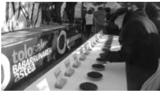
Iaz ere babarrun desberdinak izan ziren ikusgai azoka berezian. E. EZEIZA

Ekintza ugari izango dira Tolosan Babarrun Astea dela eta; Babarrunaren Ibilbidea, azoka berezia, ekoizleen lehiaketa, enkantea eta txapelaren lehiaketa izango dira goizean zehar.