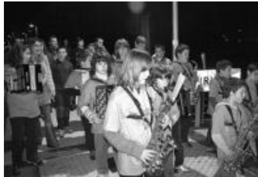
Loatzokoek kalejira egin zuten atzo Irura eta Anoetan artean. I. GARCIA

egingo dute, Leidor aretoan; Santa Zezilia kontzertua, hain zuzen. Doakoa izango da eta Tolosako Udal Txistulari Bandak, Maiatz Akordeoi Orkestrak, Isidro Larrañaga Akordeoi Orkestrak eta Tolosako Musika Bandak hartuko dute parte bertan.