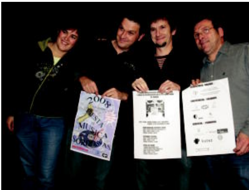
V. Sentsibilizazio Astea aurkeztu zuten Gaintzen elkarteok, herenegun eginiko agerraldian. ESTI EZEIZA