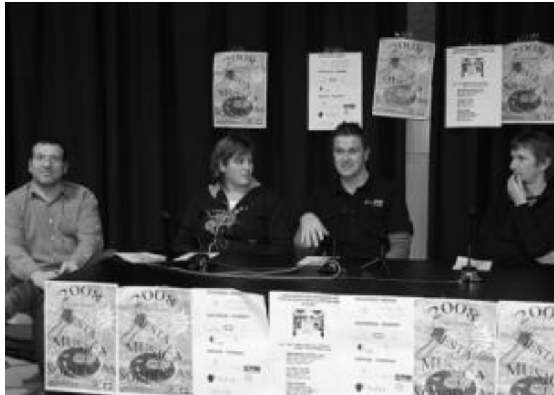
Herenegun aurkeztu zuten V. Sentsibilizazio Astea, Gaunditzen elkarteko kideek. E. EZEIZA

Sentsibilizazio aste honek, gorren eta entzun dezaketenen arteko ha-