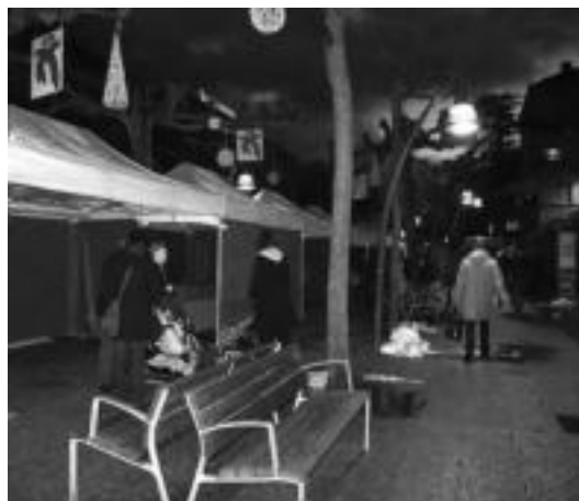
Gaurtik igandera bitartean, San Frantzisko Pasealekuan egongo da. E. EZEIZA

■ Irakaslea. Pertsona bat behar dugu, astelehenetik ostegunera arratsalde, Batxilergoko 1. mailako matematika, fisika, kimika eta teknologiako klaseak emateko. Deitu 616 97 49 64 edo idatzi amaia.sagasti@hotmail.com