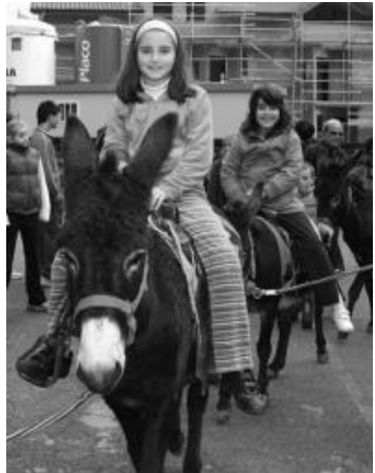
Amasan asto karreraren ostean, hauen gainean ibili ziren haurrak.

Txapelketarekin amaitu ostean, txerrikumeak han zeudenen artean zozketatu zituzten, hurrengo urteko txapelketa bitartean, etxean entrenatzen joateko agian.