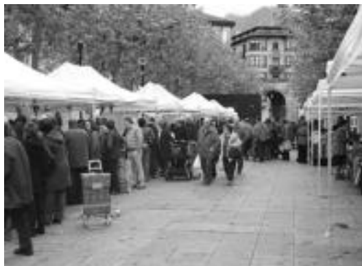
Pasa den astean bezala, Triangulo plazan izan zen atzokoan azoka. I.T.

Azoka » Triangulon giro polita izan zen nagusi, Berdura plazan giro lasaiagoa; barazkien eskaintza oso zabala da.