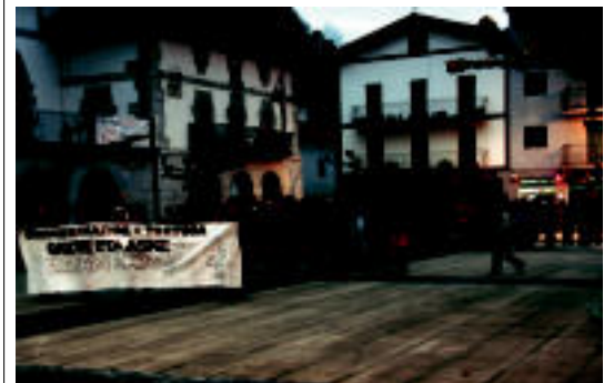
400 lagun inguruk hartu zuen parte manifestazioan. N. URBIZU