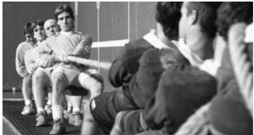
Auzolan A taldekoak lehiatzen, atzo, Ibarako Belabieta kiroldegian. I.T.

be hasi ginen, baina orain ia fuerte gabilta». Txapelketan bete bete- an daude sartuta, eta astean hirutan entrenatzen dute, finalera iristea helburu dutelarik. «Finalean ia denak berriz ere zerotik hasiko dira», dio ibartarrak.