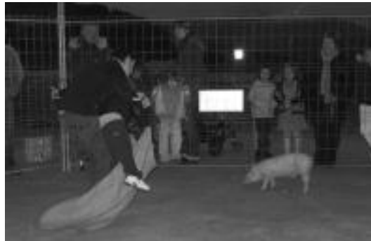
Haurrek nahiz helduek hartu zuten parte Alkizako txerri harrapaketan. E.E.

Oraindik, festak jarraitzen du Atzoko parrandaren ostean, bihar ramunik ez dutenek, ez aspertzeko, herriko artzain-zakur lehiaketatikurera joateko aukera izango dute. Hau Meza nagusiaren ondoren izango da.