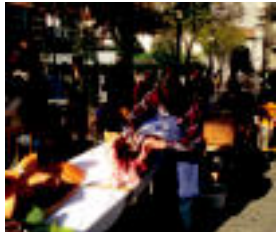
Pasa den urtean ere berria izan zen protagonista, U. IBEROZ

Ibarra Eguerdian txerriki desberdinen erakusketa eta dastatzea izango da, eta ondoren, bazkaria herriko plazan.