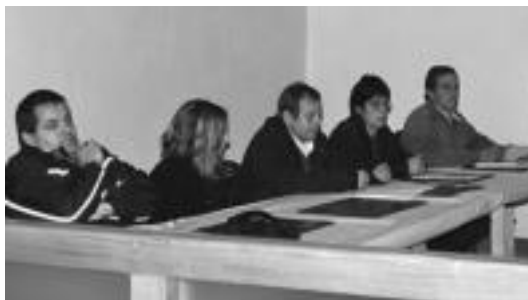
Ezohiko bilkuran 60 herritar joan ziren. Irudian, zinegotzi batzuk.