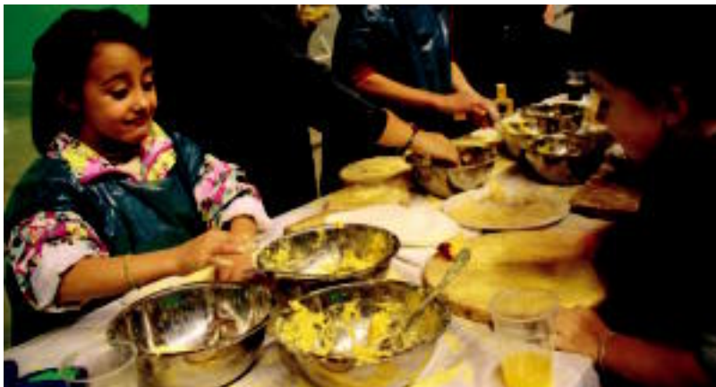
Goian, Amasako Sanmartinetan atzo egin zuten asto karrera; behean, Baliarrainen egin zuten talo tailerra.

LEITZA Lau t'erdiko txapelketako finalerdia jokatu zuten atzo; goizuetarrak erraz irabazi zuen 6