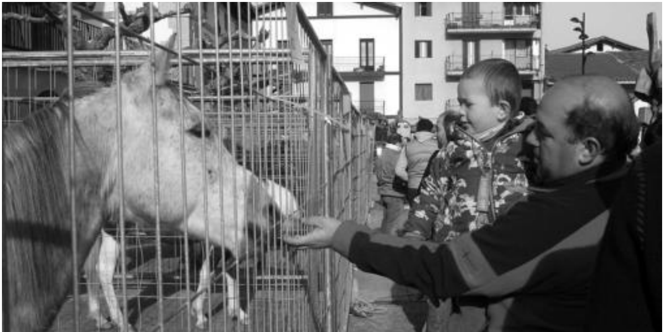
Hurten ere animaliak (zaldia, behorak, oiloak...) izango dira, iaz bezala. Irudian, joan den urteko Amezketako ferian, aita-semeak zaldia ikusten. ANDER OTEZABAL

Herritarrek osatutako azoka izango da etzi goizean, Amezketako plazan eta Kultur Hamabostaldiaren baitan. Guztira, 40 postu ezberdin izango dira, tartean bitxikeriak izanik.