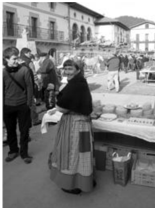
Saltzaileak baserriarrek jantzita egongo dira, argazkian bezala. A. OTEZABAL

Aipatutako produktuez gain aurretik Buruntzunin elkartearen kide-ekpostu bat izango dute eta bertan, mendiko materiala izango dute (hainbat dendak emandako arropa eta abar). Horretaz gain, herritarrek ere eraman dezakete mendiko materiala, Buruntzunin zineko postuan saltzeko: bigarren eskuko gauzak izango lirarteke, noski. Aurretik jasotzea eskertuko lukete el-