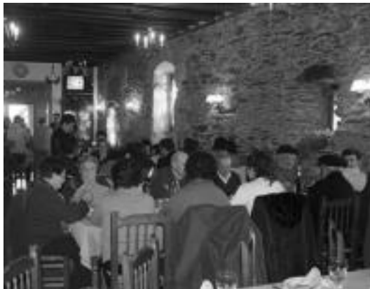
Zartagi jatetxean izango dira jubilatuen bazkaria eta hamaiketakoa. A. OTEZABAL

Etzi Jubilatuen Eguna dago antolatuta Baliarrainen. 11 jubilatutako dirak Zartagi jatetxean bazkaltzeko. Baina aurretik hainbat ekitaldi izango dira: 11:30ean ha-