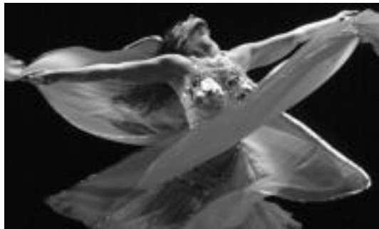
Ekialdeko erritmoak nagusituko dira bihar 'Babelesque' ikuskizunean. HITZA

Tolosa » Bellydance Superstar-ekoak hemen dira Mundua Tolosan zikloaren baitan; emanaldia 20:30ean da.