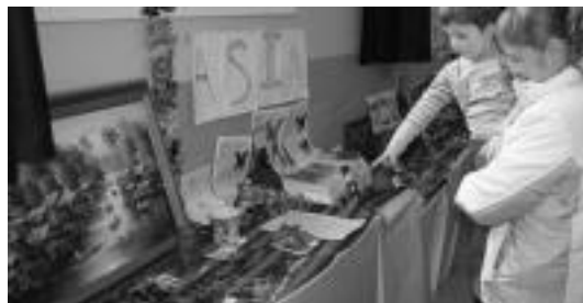
Egipto-Aresoko papiroak eta ikasle txikiak amari bere lana azaltzen. A. IMAZ