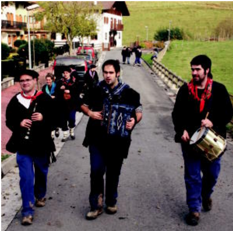
Kalejira egin zuten atzo jaien baitan; gaur ere izango dute zer gozatua. IMANOL GARCIA