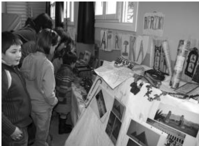
Aresoko eskolan Afrikaren eta Asiaren inguruko erakusketa zabaldu zuten egun batez bertako ikasleek. ASIER IMAZ