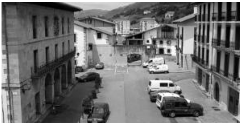
Berastegiko udaletxe inguruaren hobetzea ere aurreikusten du zaharberritzeko proiektuak. HITZA

Zaharberritzea «behar-beharrezkoa» zela argitu du Udalak, baita ere, egitura arazoak (egiturako