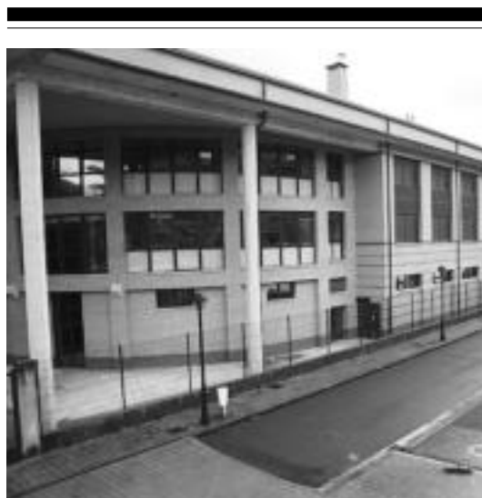
Ez zen eskolarik egon atzokoan eskualdeko itunpeko ikastetxeetan. I.T.

Guk, kasu honetan, bakarrik joateko erabakia hartu dugu. Dena den, beste askotan erakutsi izan dugun bezala, kolaborazioak, koalizioak edo loturak egin ditzakegu, beti ere, herriaren alde egitea bada helburua.