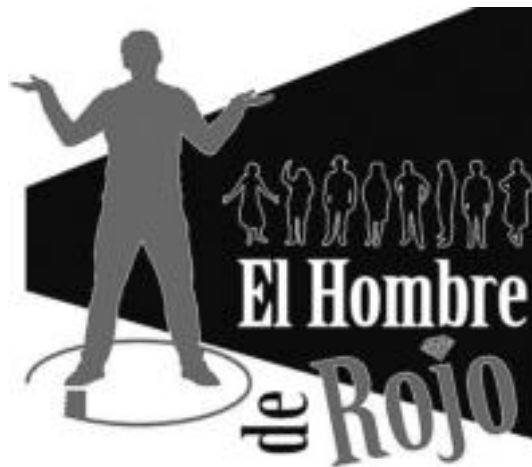
El hombre de rojo antzezlan aurkezten duen kartela. HITZA

tzen ez den ostatu batean garatzen da; gizon erretxin baten ostatuan. Arduradun honi bere ostatuan jendea egoteak gogaitu egiten du. Bertan lapur txoriburua eta sentikorra, idazle inozente eta beldurtia, nazioarteko lapur banda xe-