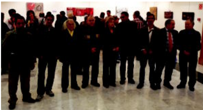
Herenegun inauguratu zuten Kultur Truke 08 Hamabostaldia; irudian udal ordezkari eta antolatzaileak. HITZA