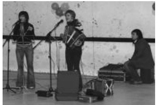
Musika eskolakoen emanaldiko une bat iaz, Kultur Astearen baitan. N.U.

Bestalde, krosak eskatzen duen antolakuntza maila ikusita, laguntza emateko asmoa dutenak udalaxe inguruan 09:00etan azaltzea eskatu dute elkartekoek, «lana egiteko egongo da eta».