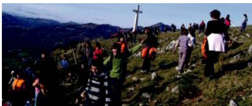
Ezustekorik gabe heldu ziren guztiak Uzturre mendira; ondoren, indarrak berreskuratzeko zer jan izan zuten. HITZA

guru aritu ziren eta oso gustura gelditu ziren, goiz pasa ederra eginenez. Halaber, Alpino Uzturre elkarteak eskerrak eman nahi izan dizkie Insalusi, Opil okindegiari, Aralar Kirolak dendari eta Gurutze Gorriari emandako laguntzagatik.