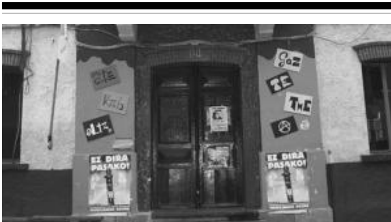
Etzi, azaroaren 15ean, 'Geldirock!' ekimena ospatuko dute Leitzako Gaztetxean. NAIARA GARZIA