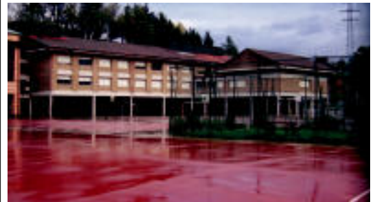
Itunpeko ikastetxeak hutsik egon ziren atzokoan. I. TERRADILLOS

TOLOSALDEA Tolosako, Ibarako, Villabonako, Irurako eta Anoetako ikastetxeetan bat egin zuten atzoko deialdiarekin 2