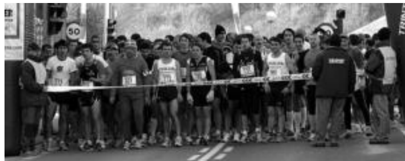
Iaz 170 lagunek hartu zuten parte Ikaztegieta XVIII. Herri Krosan. Irudian, joan den urtean, ateratzeko unean. HITZA

Zozketa bereziak ere izango dira: zer zozketatuko duten jakite-hain zuzen, gitarra-jotzaile talde bat ariko da ere, zortzi bat neska, eta tartean ere kantatzen ariko