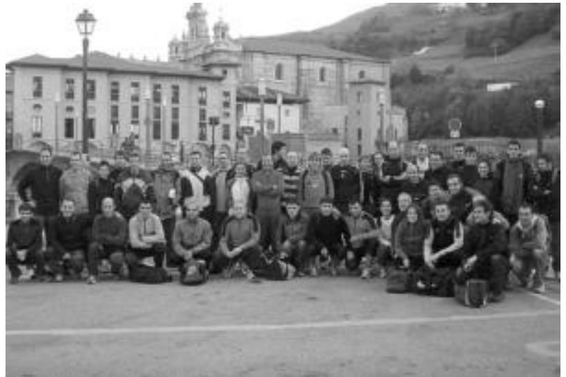
Tolosatik autobus bat atera zen korrikalariekin Behobia aldera. JOXEMI SAIZAR

Halere, lasterketa herrikoiek honek duen arrakasta parte-hartzaile kopuruan datza eta bide ertzean izaten den jende andanak ematen duen animoan. Giro horrek egiten du erakargarri eta horregatik korrikalari askok, ahal duela, urtero errepikatzen du proba. Giro ona ere korrikalarien artean sortzen da. Esaterako, autobus bat joan zen Tolosatik korrikalariz beteta.