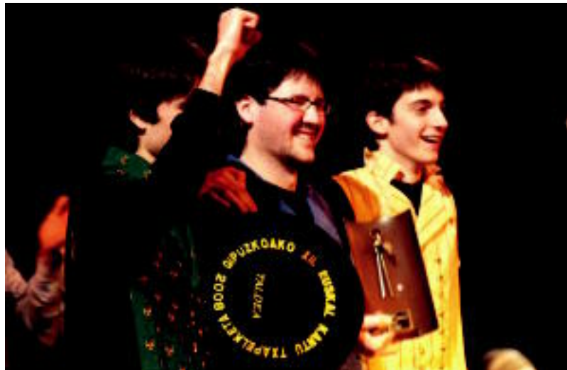
Taldean atalean, T-Klax hirukotea izan zen garaile; sorkuntza eta publikoaren saria ere irabazi dituzte. HITZA

zen eta antolatzaileen esanetan, «maila altua egon zen finalean». Zenbait saritan puntu gutxiko alde egon zen finalisten artean eta lehia oso estua izan zen.