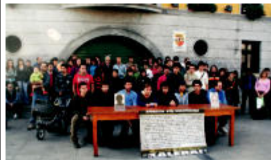
Ezker abertzaleak larunbatean egin zuen agerraldia Ibarra plaza. R. CALVO

TOLOSALDEA-LEITZALDEA 411 korrikalarik amaitu zuten herenegun Behobia-Donostia 2-3