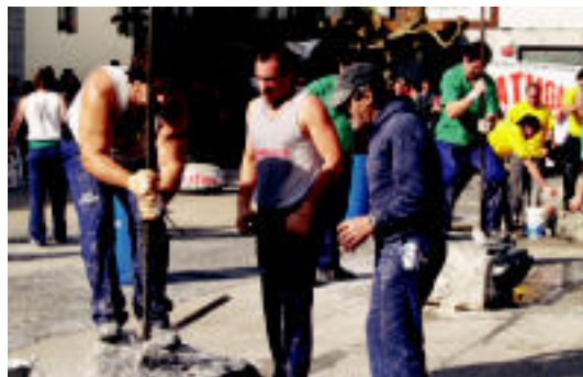
Harri-zulaketan, bizkaitarrak. Berdez, Amezketakoak eta horiz Altzokoak.