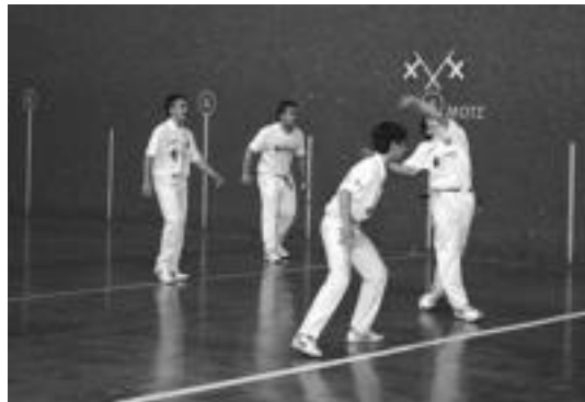
Nafar Jokoan jardunaldi berri bat jokatu zen asteburuan Amazabalen. HITZA