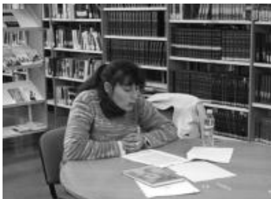
Hiru herritar aritu ziren lehiaketan aurkeztutako lanak irakurtzen. A. IMAZ