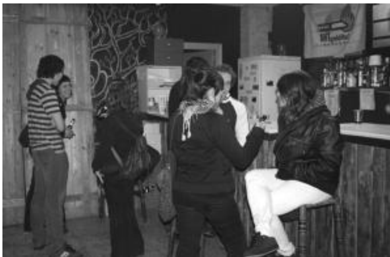
Bazkaldu eta gero ere giro ederra zegoen Otsabin; gazteak kontzertuak hasi bitarte inguruan ibili ziren. R.CALVO

Sanblaspiko Gazte Asanbladak, gainera, bi galdera hauek gizarte-