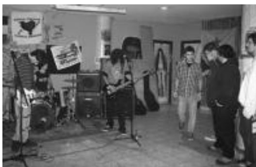
Hondarribiko Inoiz Ez taldearen emanaldiko irudia.

ratu nahi izan zituen: «Zertarako behar dugu, aurreikuspenen arabera, Donostia eta Bilbo arteko bidaia 30 euro inguru kostatuko den tren? Norentzako egin nahi dute bailaraguztian geltokirik izango ez duen Abiadura Handiko Trena?».