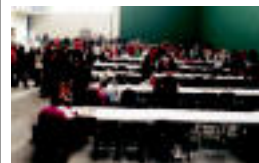
Frontoia jendez bete zen. A.I.

TOLOSA Sanblasipiko kideen eskutik izan ziren atzo 7