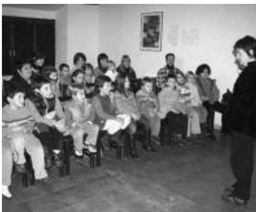
'Galtzagorriak' saioa ikusteko aukera izan zuten haurrek.