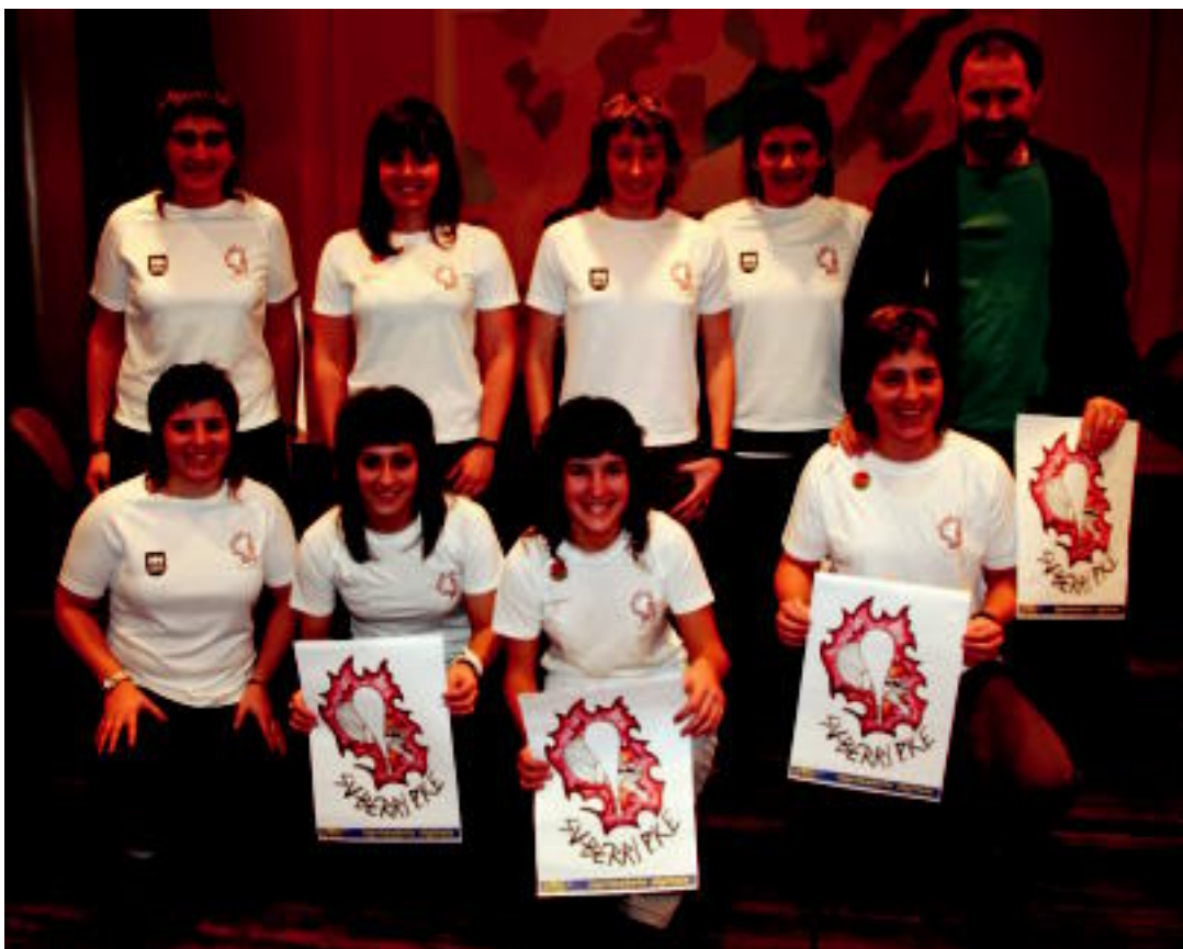
Su-Berri pilota elkarteko ordezkarriak, herengun eginiko aurkezpenean; orain arte bederatzik emakume federatu dira.