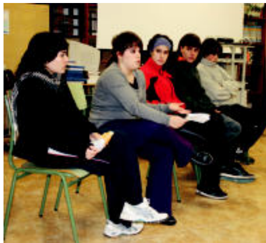
Ikasle Eguna egin zuten atzo Leitzan. A. IMAZ