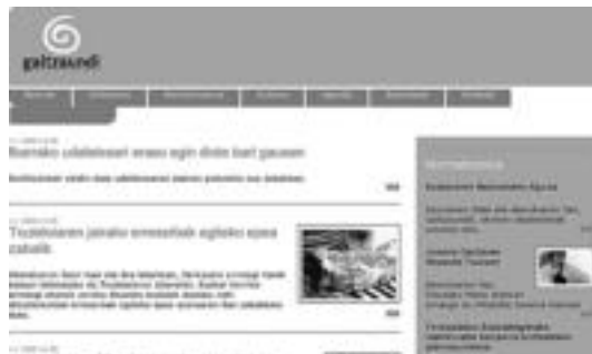
Galtzaundi Euskara Taldearen webgune berriaren itxura. HITZA

Edizio jarraitua izango da ekimen berri honen erronka nagusie-