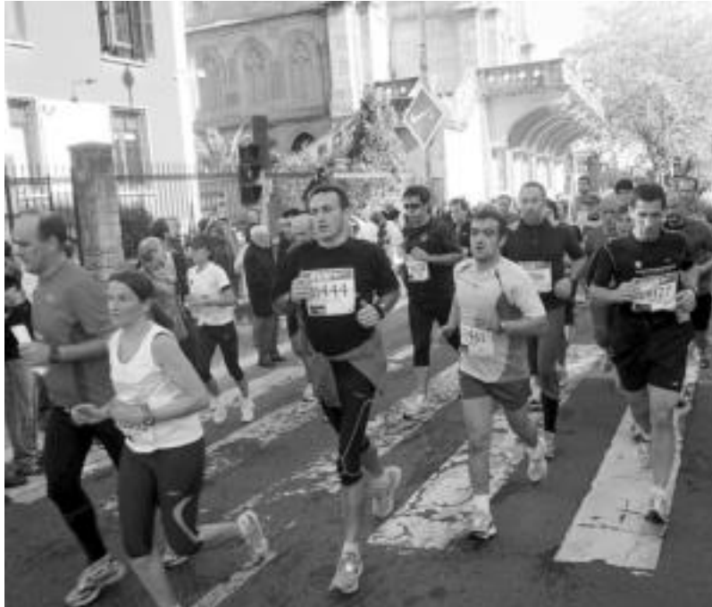
Milaka korrikalari ikusi ahalko dira bihar Behobia-Donostia lasterketan. A. OTEZABAL