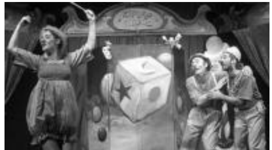
Giriguai emanaldiaren bi eszena.