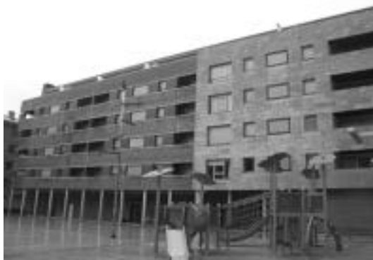
Gurea zinemaren ondoan kokatuta daude Fleming eremuko 10 bizitzak. I. G.

Hamar etxebizitzak batez beste azalera erabilgarria 96 metro koadrokoa izango da. Txikiak 89,15 m 2 izango ditu eta handiak 97,55 m 2 . Etxebizitza bakoitza bere trasteleku eta garajearekin erosi beharko dira.