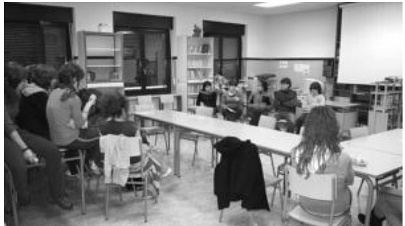
Leitzako Ikasle Egunean euren burua aurkeztu zuten institutuan Ikasle Abertzaleko kideek.