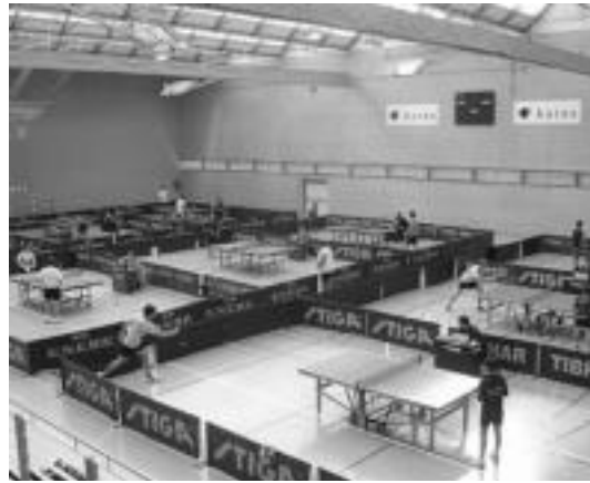
Olaederra kiroldegian jokatu zuten txapelketa iragan asteburuan.