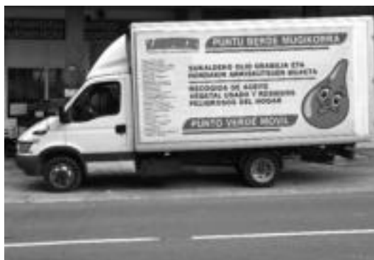
Puntu berde mugikorra eskualdean zehar. HITZA

Zerbitzua gauzatzeko, behar bezala hornitutako furgoneta bat