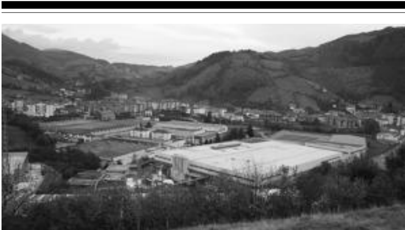
Torrosas SA taldearen barnean aurkitzen da Leitzako Sarriopapel fabrika. ASIER IMAZ