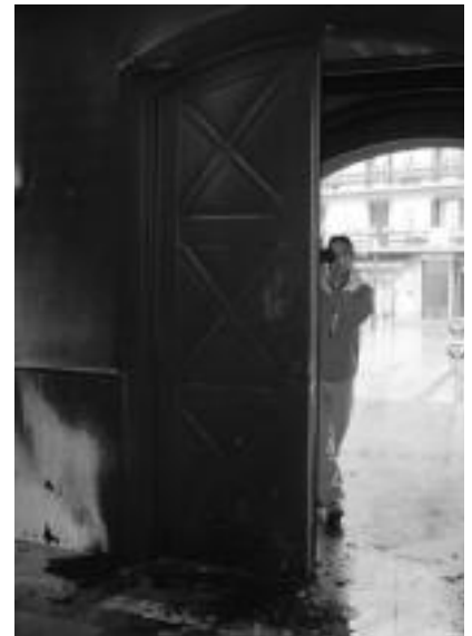
Atean kalteak eragin ditu suteak; lehen irudian Udaletxe kanpoaldea ikusi daiteke eta bigarrenegoz barrualdea. a.c.