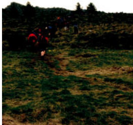
Aizkardi martxoan mendi ibilaldia antolatu zuen. N.LATABURU

Sari interesgarriak jarri dituzte aukeran irabazleentzat. Hala, argazki onenari saria argazki kamera bat