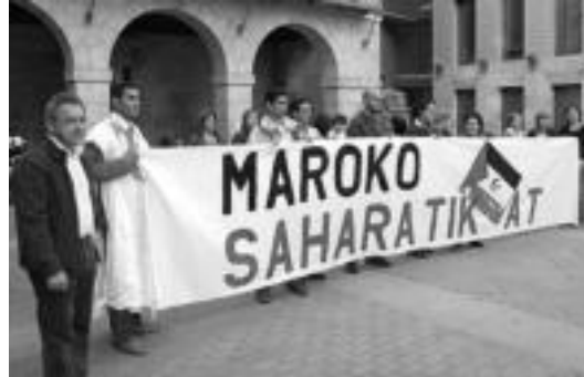
'Maiatza Borrokan' jardunaldien baitan elkarretaratzea egin zuten.

1975ean Marokok Martxa Berdea nola abiarazi zuen gogoratu zuten aurkezpenean Sahararen aldeko elkarteak kideek. «Marokoko Hassan II.a erregeak bertako biztanleak altxarazi eta Martxa Berdea abiarazi zuen, espainiar administrazioaren zegoen Mendebaldeko Sahararen inbasioa burutzeko. Azaroaren 6an, Sahararen hiriburua den Aaiungo inguruetara iristen da Martxa Berdea. 50.000 lagun martxa militar bat burutzen ariko bailiran espainiar soldaduen parez, pare jartzen dira Mendebaldeko Sahararen marokotarasuna aldarrikatuz. Soldadu espainiarrek Nazio Batuen Erakundeak eskatu moduan, lurraldea defendatu eta Sahararen autodeterminazio eskubidea babestu behar zuten, baina, azkenean, EEBBak eta Frantziaren presiopean Espainiako Gobernuak bere politika aldatzea erabaki zuen eta Mendebaldeko Sahara Rabateko Gobernuari era lotsagarri batean uztea adostu zuen, eta horretarako, Madrilgo akordioak deiturikoak presatutako zituen».