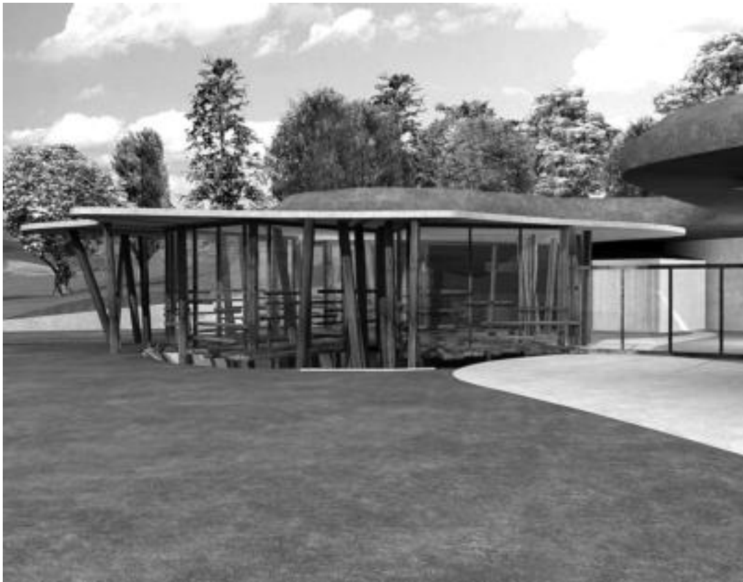
Ipupomamuaren irudi birtuala. HITZA