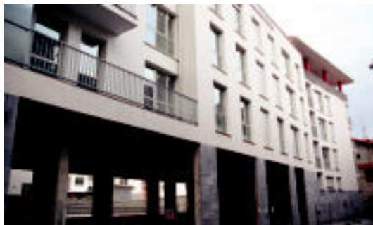
La Salvadorako eremuko babeseko etxebizitzak, Kale Nagusitik ikusita.

La Salvadorako eremuko babeseko etxebizitzak egun Loatzo musi-