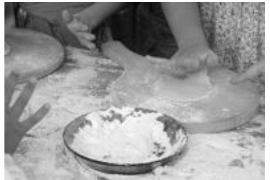
Taloak egiteko tailerra antolatu dute hilaren 15erako. Haur eta gaztetxoentzako izango da, eta ondoren dastatzeko aukera izango da. HITZA